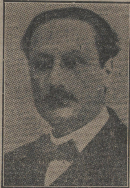
El nuevo ministro de Abastecimientos, D. Leonardo Rodríguez.

El salir de Palacio el conde de Romanones, acompañado por el nuevo ministro de Abastecimientos, D. Leonardo Rodríguez, anunció a los periodistas que en el ministerio de Estado celebrarían inmediatamente una reunión con el ministro de la Gobernación, alcalde de Madrid y gobernador civil, para tratar de la huelga de panaderos.