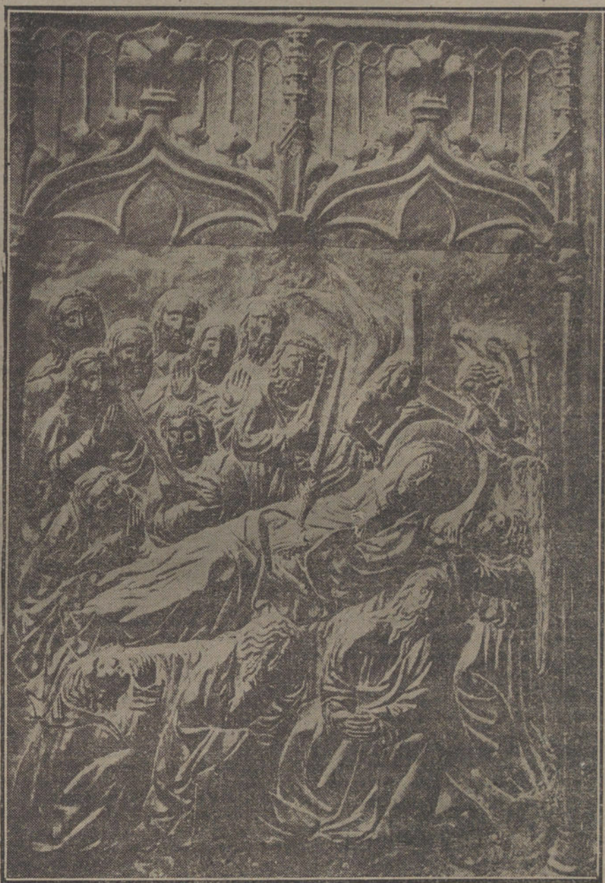
Medios-relieves, repujados en bronce, que decoran las puertas principales del templo.

Las puertas de bronce están divididas en seis grandes cuadros, tres por hoja, encerrado el conjunto en marcos con estilizaciones de la flora regional; los repujados representan escenas de la vida de Jesucristo y la Virgen, en me-