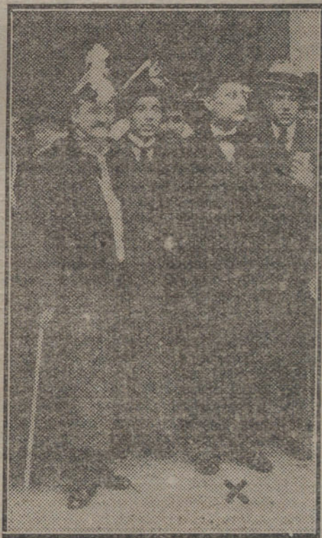
El nuevo ministro de Abastecimientos, D. Leonardo Rodríguez, acompañado del conde de Romanones, saliendo de Palacio después de haber jurado el cargo.

El entierro se verificará mañana, á las tres de la tarde.