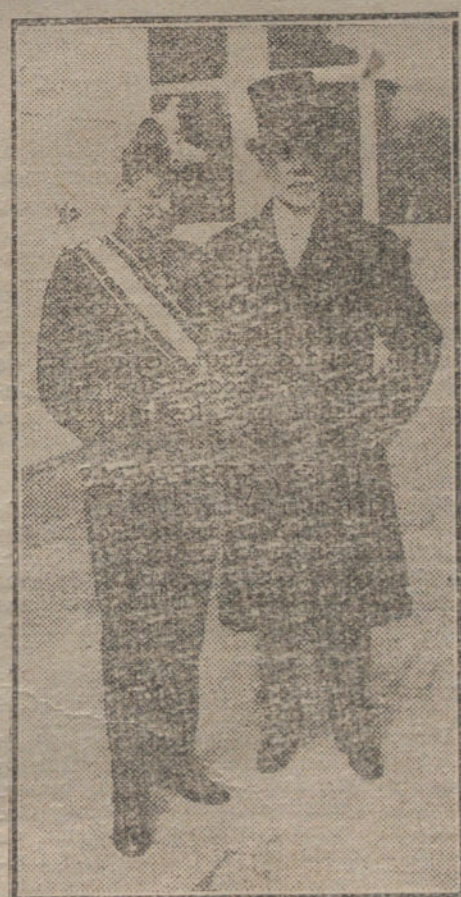
El nuevo ministro plenipotenciario de Portugal, al salir de Palacio, acompañado del primer introductor de embajadores, después de haber presentado sus credenciales al Rey.

Tuvo el ministro de la Gobernación frases de calurosos elogios para las fuerzas militares y los jefes técnicos que han prestado inapreciables servicios, debiéndose en gran parte a estos elementos el éxito de las medidas puestas en práctica por el Gobierno.