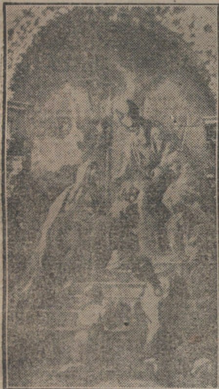
Lienzo de Lucas Jordán, que figura en el camarín de la Virgen.

Cuanto desconocen los cuadros que Lucas Jordán pintara en la iglesia de Guadalupe, tienen un concepto erróneo del artista italiano. A través de sus obras más populares—la escalera principal del Escorial y el techo de la Casona—, Jordán es un pintor avoroso, mercantilizado y vacilante, que imita a sus antecesores y produce con una fecundidad pasmosa, sin dar descanso ni a los pinceles ni a la imaginación. Jordán, en Guadalupe, es un pintor personal, atisbo fácil de lo que hubiera conseguido con más reposo y menos picardía. Los nueve lienzos con que, por encargo de Carlos II, decoró el camarín de la Virgen, constituyen, sin duda, lo mejor de su obra. En los asuntos no se advierte aquel vicio de confusión de los techos del Escorial, donde aparecen mezclados irreverentemente santos, filósofos y musas, escenas bíblicas, episodios guerreros, pasajes mitológicos y de fábulas; y en la técnica, no hay tampoco aquellas vacilaciones que en la pintura del Casón se notan entre el