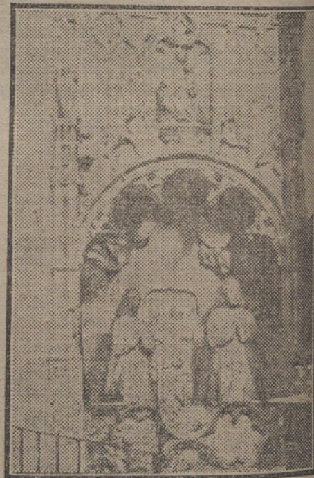
Sepulcro de los Fernández de Velasco, obra de Joaquín Egas.

figuran en los claustros, capillas y habitaciones del Monasterio. No podemos detenernos a escudriñarlos, cuando su única mención no cabría en la brevedad de estas notas. Citemos, sin embargo, los retratos de Carlos II, Do-