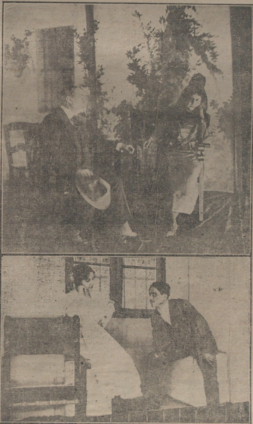
Dos escenas del drama de los hermanos Quintero, «La calumniada», que se estrena esta noche en el teatro de la Princesa.

Gobernación.—Real orden (rectificada) disponiendo que la devolución de fianzas constituidas para garantizar el cargo de administradores provinciales de Beneficencia se ajuste a las reglas que se publica.