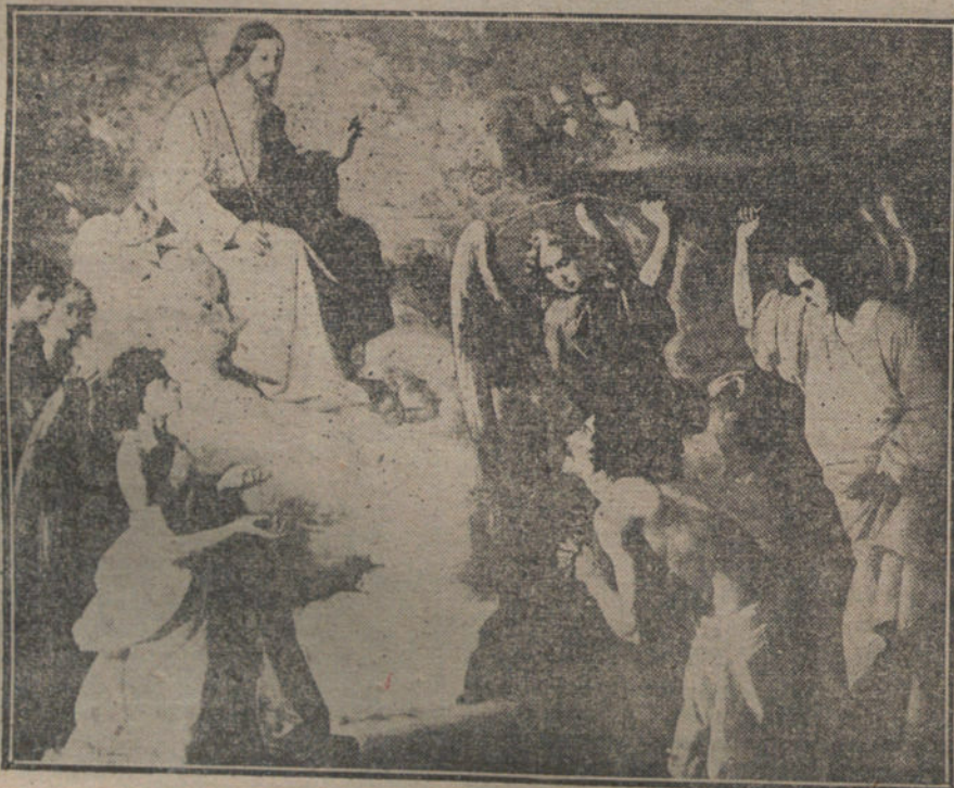
«La flagelación de San Jerónimo». Cuadro de Zurbarán.

En total, son diez: uno sobre el altar de la capilla de San Jerónimo, llamado la «perla de Zurbarán»; otro, apaisado, en la misma capilla, cuya autenticidad se discute por algunos, y ocho en el recinto que hemos descrito. Representan escenas de la vida de