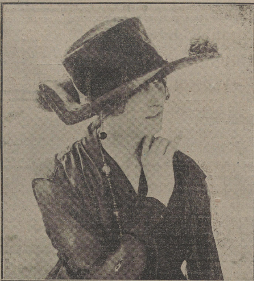
Sombrero de «peluche», negro, guarnecido con fantasías de pluma azul, modelo de la casa Bretagne.