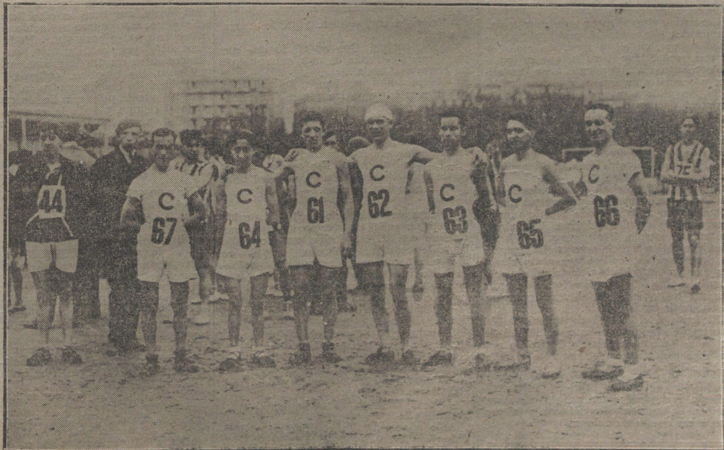
LAS CARRERAS PEDESTRES DE SAN SEBASTIAN. —Equipo de la Federación Castellana, que ha quedado en primer lugar en la clasificación de equipos regionales.