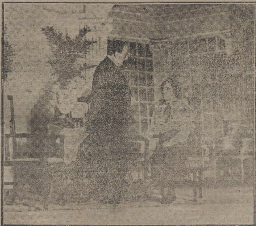
Una escena del drama «La comedia del honor», estrenado anoche en el teatro del Centro.

Acerca de las subsistencias.—Primero, obtener del Gobierno la derogación del Real decreto que permite a las Compañías de ferrocarriles la elevación del 15 por