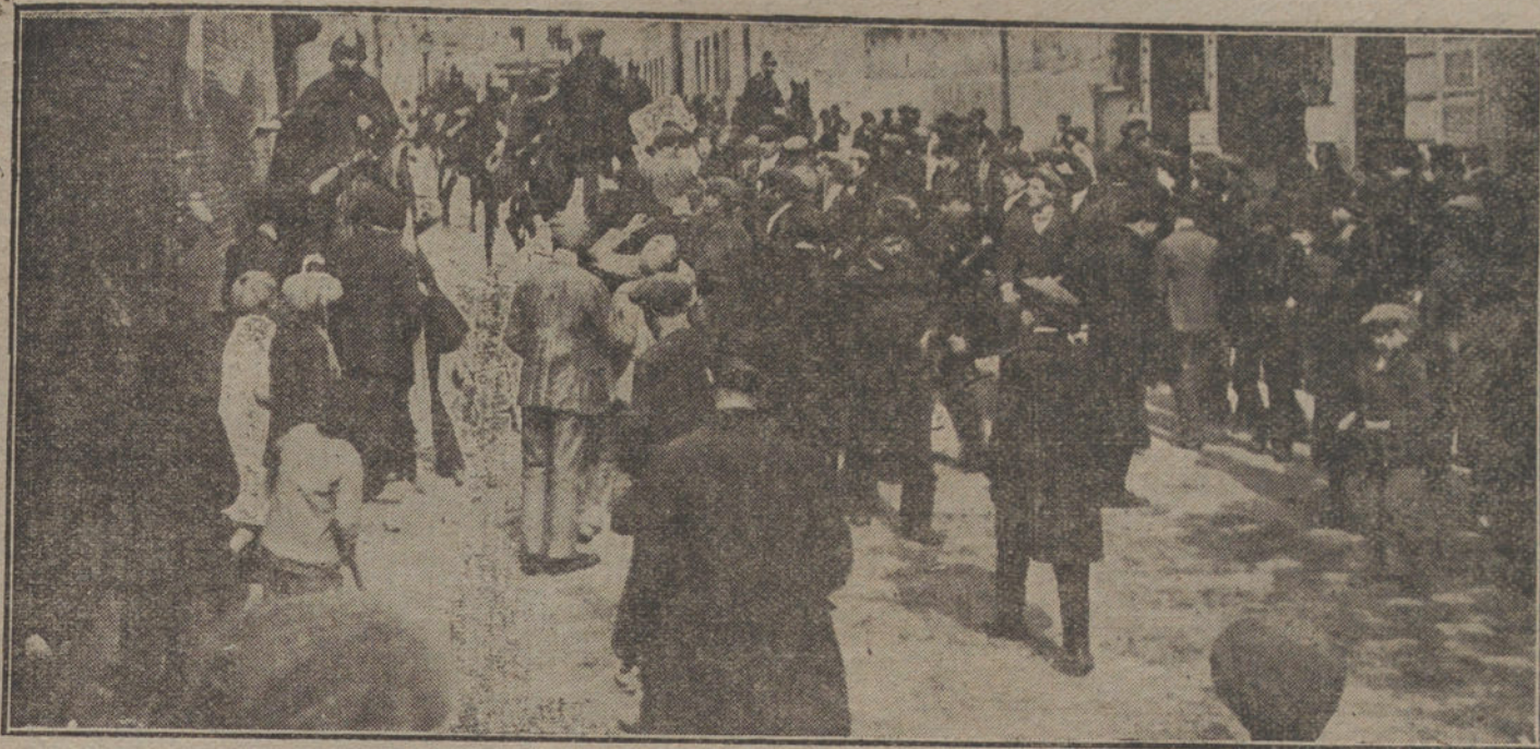
La fuerza pública disolviendo uno de los grupos que han asaltado las tiendas de la plaza del Progreso.

LOS OBREROS ASOCIADOS SE REUNEN, Y, CON LOS NO ASOCIADOS, SE DECLARAN EN HUELGA. LOS PATRONOS, DISGUSTADOS CON LA NUEVA REAL ORDEN DEL MINISTERIO DE ABASTECIMIENTOS TOMAN TAMBIEN IMPORTANTES ACUERDOS PARA NO ACATARLA