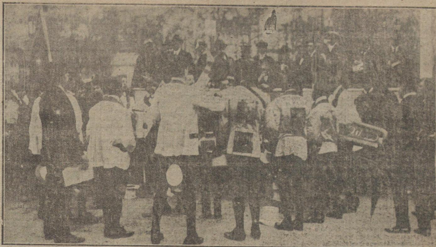
EL CARNAVAL EN MADRID.—Comparsa titulada «La Rotativa», formada por vendedores de periódicos, que ha llamado poderosamente la atención.

ciudad, sin luz, sin tranvías, sin fuerza para los talleres. Iuvo el Estado que incautarse del funcionamiento, que con dificultades y no pudiendo llenar el servicio, corre a cargo de elementos del Centro Electrotécnico del Ejército y de los tripulantes de los submarinos españoles.