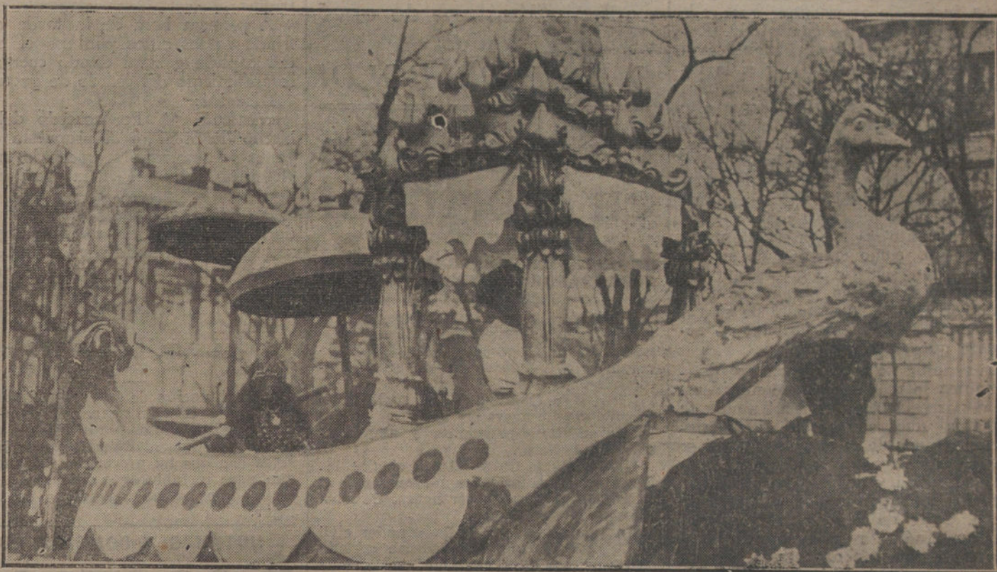
EL CARNAVAL EN MADRID.—«Indias en canoa», tercer premio de carrozas.

A España se le abrió una honda herida con Gibraltar, y Francia quiere ahora poseer otro Gibraltar en las costas de África. Es decir, que si los ingleses tienen en su mano la llave de la Península, los franceses quieren te-