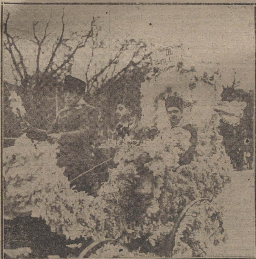
EL CARNAVAL EN MADRID.—«De Holanda», primer premio de coches.

ner la llave de nuestras colonias en Marruecos.