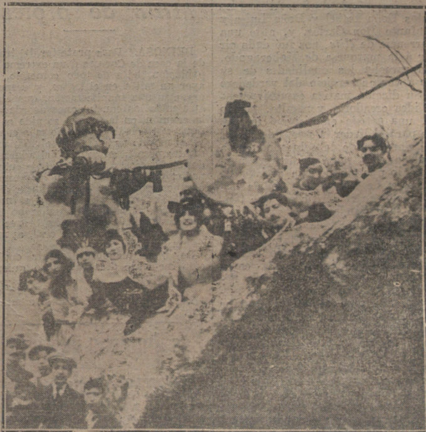
EL CARNAVAL EN MADRID.—«Viva León», segundo premio de carrozas, primero de los concedidos.

Los marinos hicieron presente su reconocimiento á la ciudad por las atenciones de que han sido objeto.