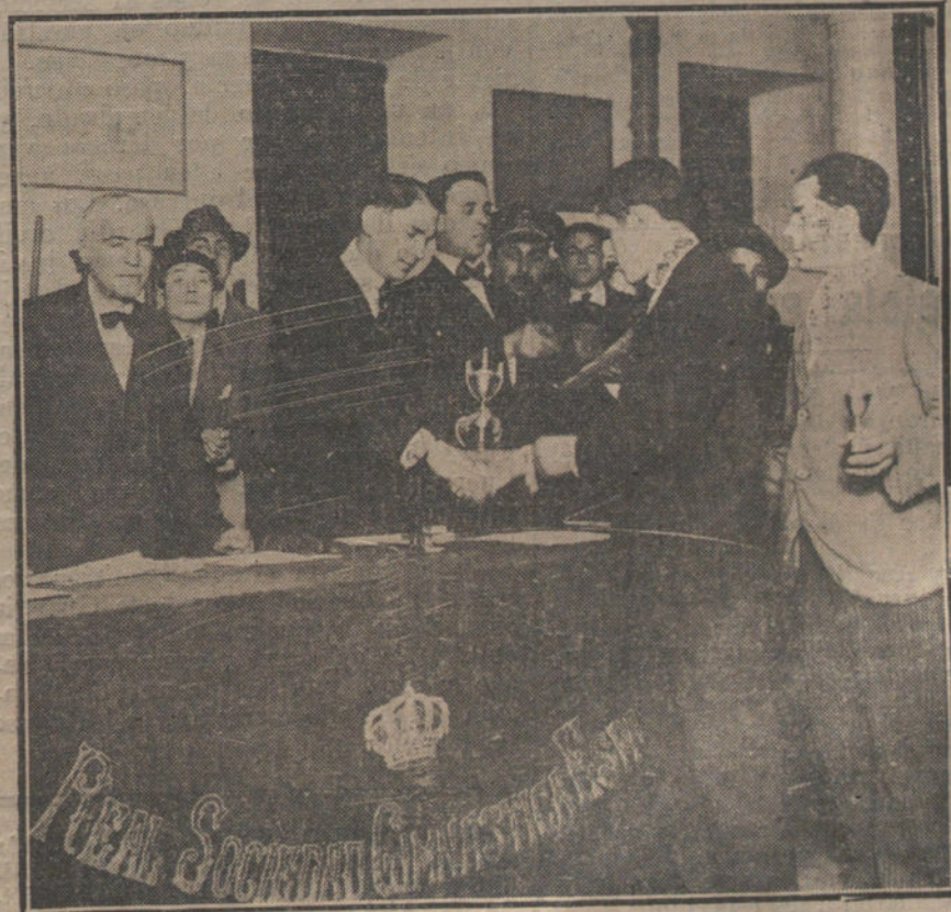
EN LA REAL SOCIEDAD GIMNASTICA.—Entrega de las copas Piñán a los ganadores de la carrera entrenamiento de «aeros».

Mefistófeles, con La Mentira, El Engaño, La Seducción, El Cinismo, La Perversidad y La Lujuria, había derrotado nuevamente a la Virtud. Huyó Mefistófeles de aquel palco con la carga preciosa entre sus manos. Un rumor de rezos llegó a sus oídos a tiempo de pasar por una iglesia. Eran las preces de las valerosas, las incorruptibles, las inconquistables, que elevaban al Señor sus cristianas plegarias por las engañadas que en Carnestolendas encuentran a la Desgracia.