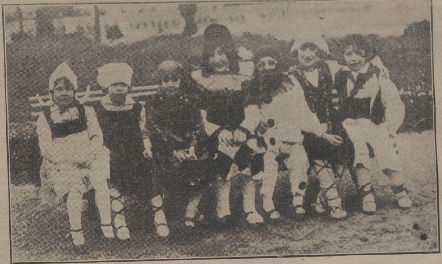
EL CARNAVAL EN SAN SEBASTIAN.—Disfraces infantiles, que han llamado la atención, durante las fiestas de Carnaval, en San Sebastián.