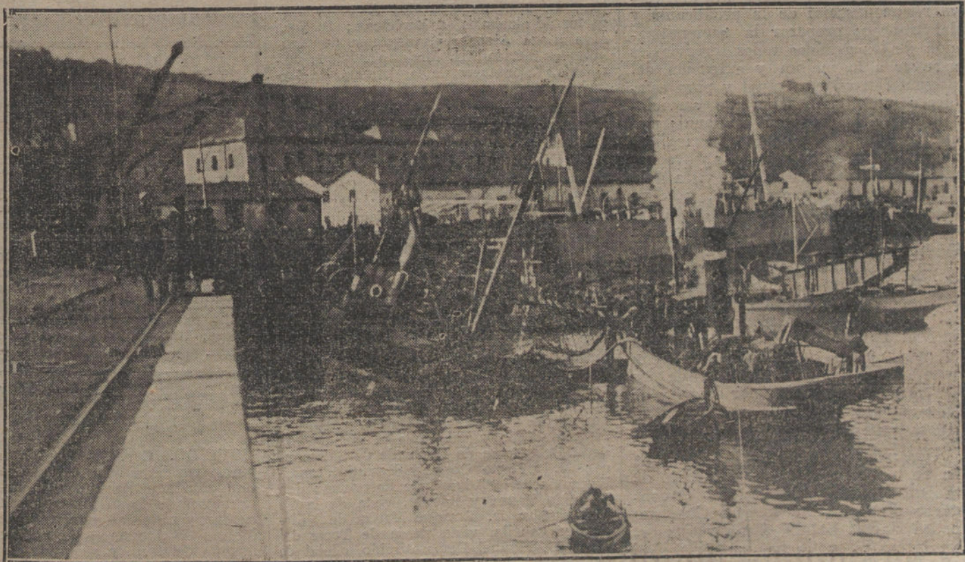
Estado en que quedó el vapor «Antonio», de la matrícula de San Sebastián, hundido en la bahía de Pasajes.