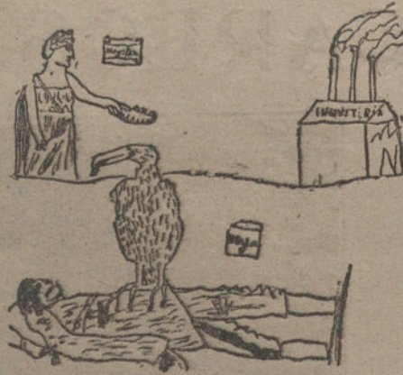
LA PAZ, por F. Vela.