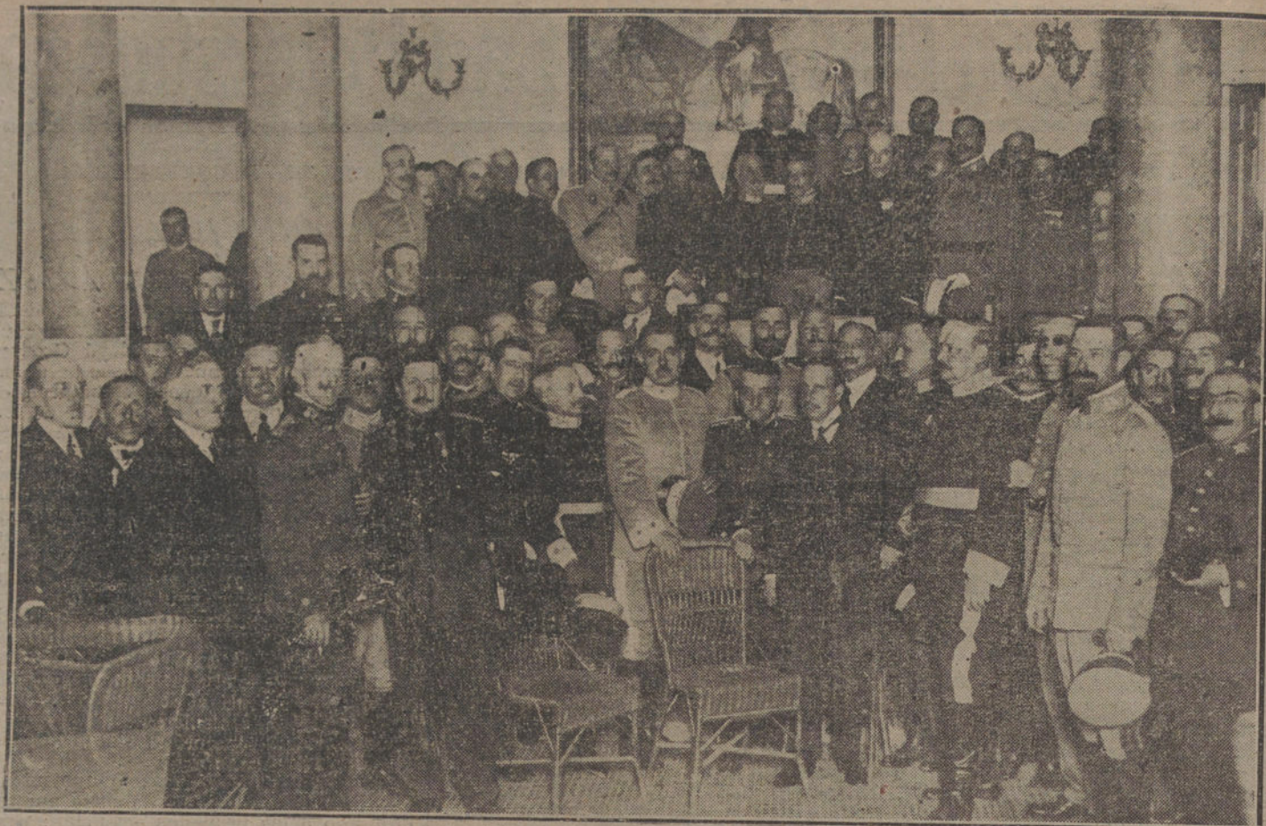
EN EL CENTRO DEL EJERCITO Y DE LA ARMADA.—Homenaje tributado anoche al general Berenguer por sus compañeros de academia, con motivo de haber sido nombrado residente general de Marruecos.

Ni queremos exclusivismos enojosos, ni hemos ido jamás contra el espíritu del cuerpo, ni es posible hablar de demagogia en nuestra profesión sin recordar a aquellos sabios maestros que nos in-