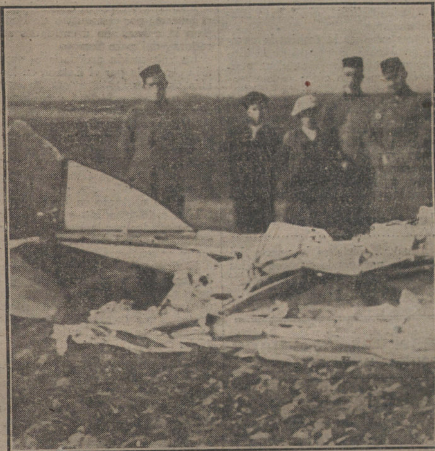
EL ACCIDENTE DE CUATRO VIENTOS.—Soldados del Cuerpo de Aviación, custodiando los restos del aparato destruido.

Y, ¿por dónde ha de comenzar esta ansiada rectificación?