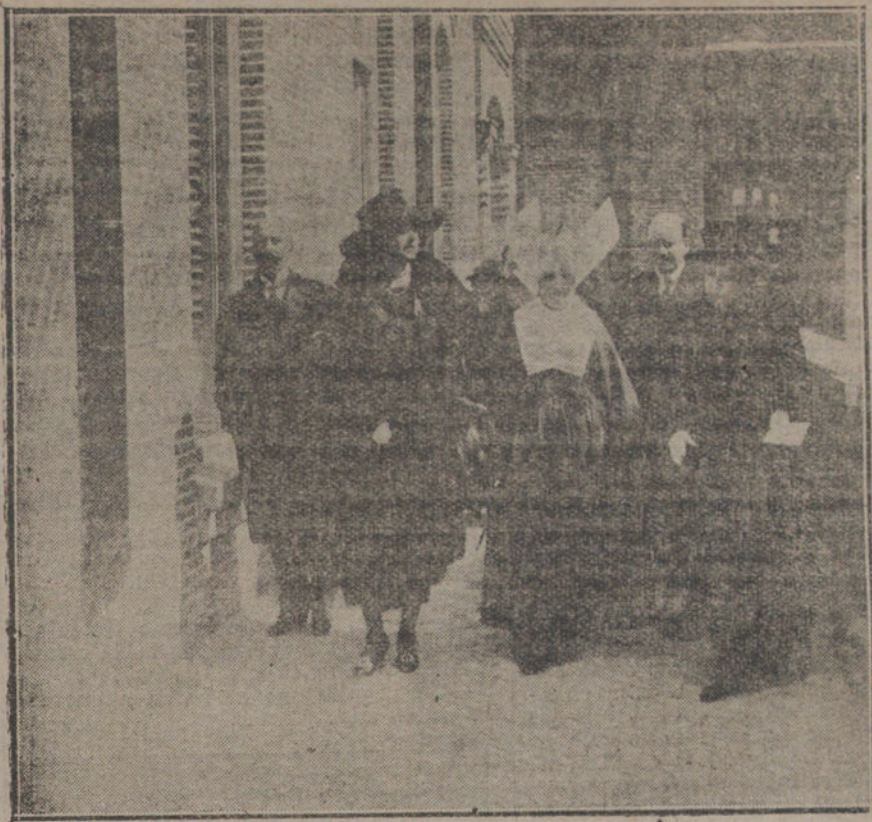
Su Majestad la Reina con su madre, la Princesa Beatriz, saliendo de los nuevos pabellones del Asilo-Hospital del Niño Jesús, cuya inauguración se ha verificado esta mañana.

De esta forma, la equidad se distribuiría á todo el mundo, y es muy posible que hasta algunos propietarios que en la actualidad no sacan á sus fincas la debida renta, se verían compensados, á la vez que se evitaba el abuso de otros caseros, que, como los felices mortales á quienes ha tocado en suerte poseer una casa en la Gran