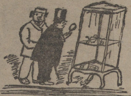
EN EL MUSEO, por Miguel Mateos. (Nueve años.)