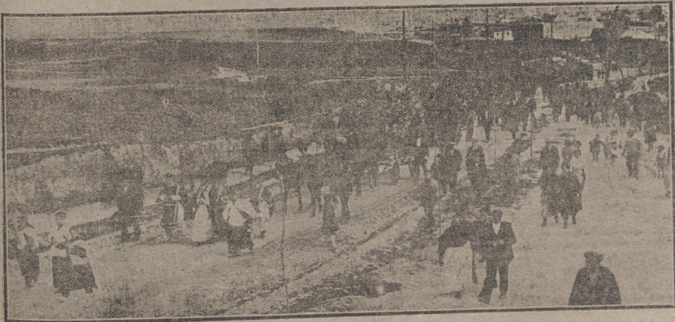
EL ACCIDENTE DE CUATRO VIENTOS.—Manifestación de duelo, con motivo del entierro de las víctimas, verificado esta mañana.

Don Pedro Carbonell gozaba de generales y sinceras admiraciones y simpatías por su carácter modesto y cariñoso. Fué profesor de Su Majestad el Rey Don Alfonso XIII y de los mejores maestros de ahora, entre quienes figura Afrodísio.