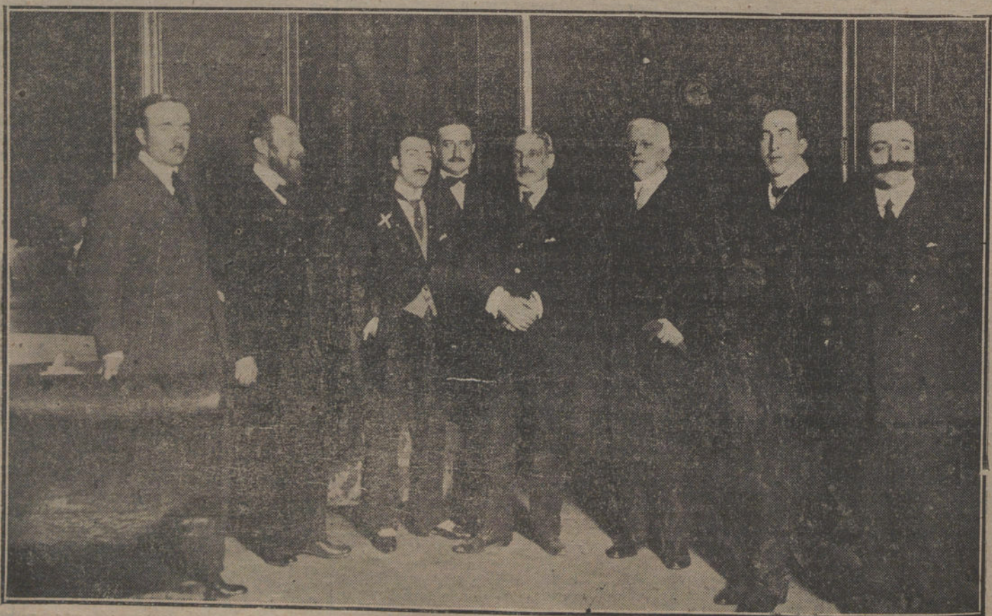
EL EL ATENEO.—El Sr. Alcázar (x) y el embajador de Italia, al terminar la ceremonia sobre «Las fuerzas vivas de Italia».

Señoritas de Bugallal, Guisasola, Fernández de la Cuesta, Narváez y Ulloa, Ho-