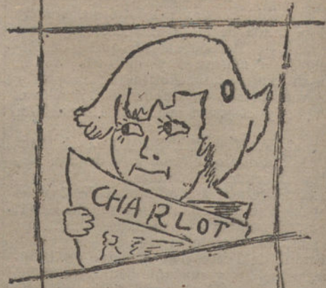
UN ADMIRADOR DE CHARLOT, por Consuelo Gómez Mesa. (Diez años.)