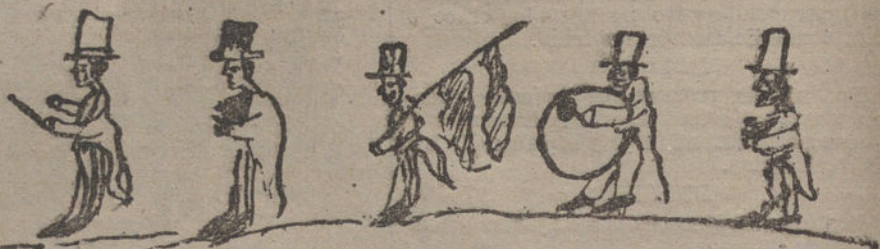
LOS QUE PASAN POR MI CALLE, por Eladio García. (Nueve años.)