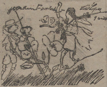
JARDIN FANTASTICO, por Luisa López. (Nueve años.)