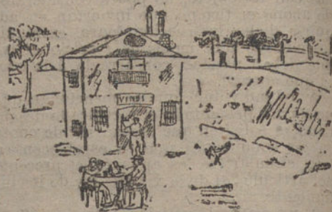
UNA TABERNA DE LA VIRGEN DEL PUERTO, por F. Moreno. (Diez años.)