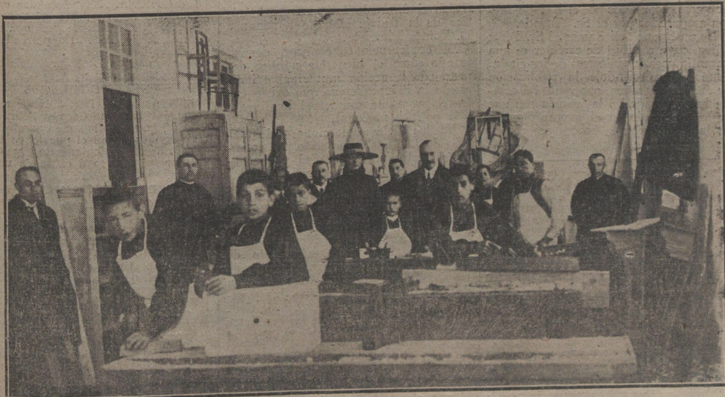
Sus Altezas Reales los Infantes Don Carlos y Doña Luisa, durante la visita que hicieron ayer al Asilo «Porta-Celi» para golfes.

—Vengo en nombre del Gobierno para ver por mí mismo el estado de Barcelona, pues su situación preocupa mucho al Gobierno. Mi actuación será, por tanto, la de un notario: levantar acta del estado de Barcelona y comunicarlo al Gobierno.