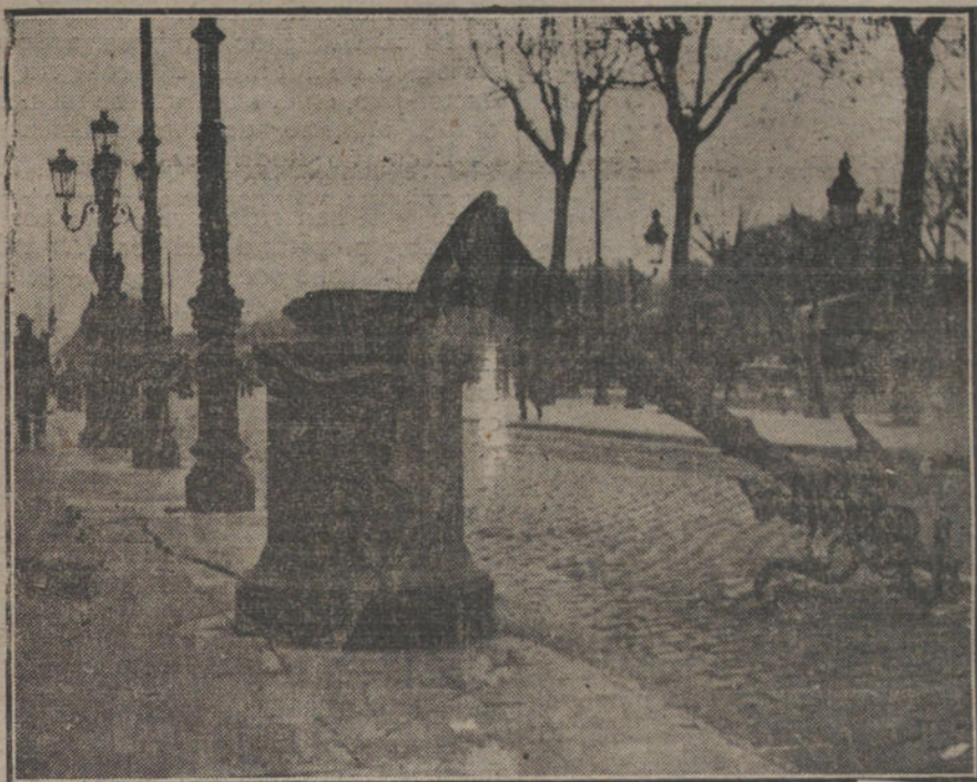
LOS SUCESOS DE BARCELONA.—Efectos de las explosiones producidas por la entrada de aire en las tuberías del gas, á consecuencia de las deficiencias con que se presta el servicio desde el planteamiento de la huelga.

El fiscal que ha intervenido en la ruidosa causa de la Sociedad El Radium hubiera hecho mejor papel derivando su indignación contra los policías ineptos y los jueces débiles, que no han presentado un solo sumario con los datos precisos para decretar una responsabilidad terminante. Los verdic- tos han de ser reflejo forzosamente de ese estado de inmunidad que gozan