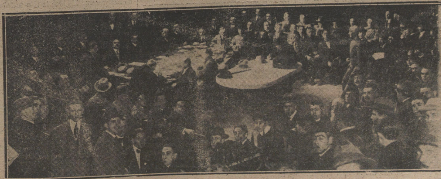
Aspecto del anfiteatro de la Facultad de Medicina, durante la celebración del mitin de médicos. (Fotografía VIDAL.)

Nadie se explicaba cómo habían ocurrido a larga distancia dos sucesos tan iguales. La causa, después averiguada, es que la energía eléctrica viene de Lezama, y para su distribución tiene un transformador, en el cual cayó una chispa eléctrica que quemó y dejó toda la línea como si fuera de alta tensión.