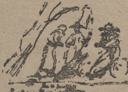
EN EL FAR-WEST, por Luis López Escoriaza. (Nueve años.)