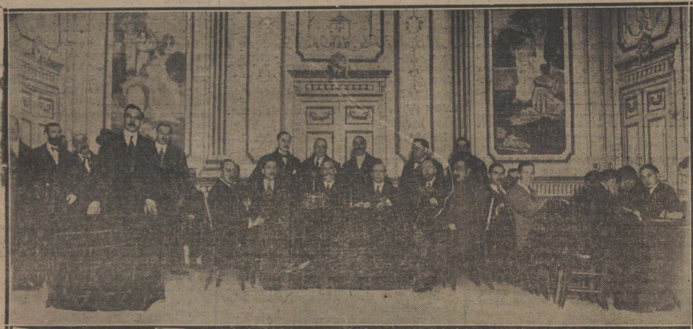
Mesa presidencial del mitin celebrado esta mañana en el teatro del Centro contra el precio excesivo de los alquileres.

En el teatro del Centro se celebró esta mañana el anunciado mitin para protestar contra la subida de los alquileres, organizado por la Asociación de vecinos de Madrid.