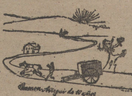
PAISAJE, por Ramón Arregui. (Diez años.)