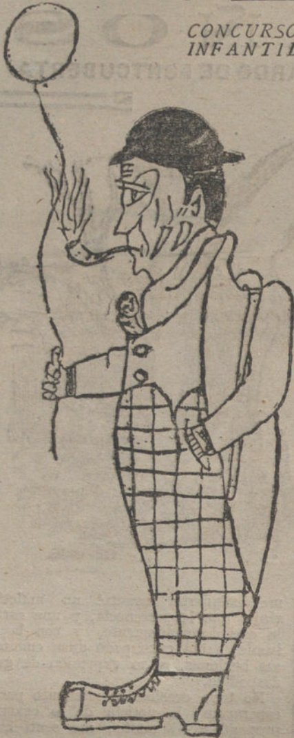
EL CHARLOT DE MI PUEBLO, por Rafael Martín. (Nueve años.)

versación en la cual poder deslizar estas palabras, oyendo disimular: