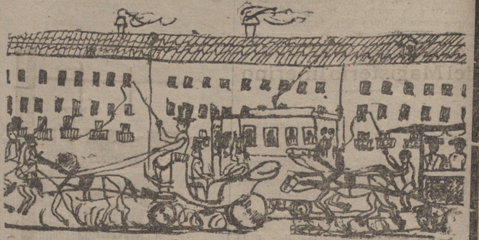
MADRID EN DIA DE TOROS, por Emilio Aladrén. (Trece años.)