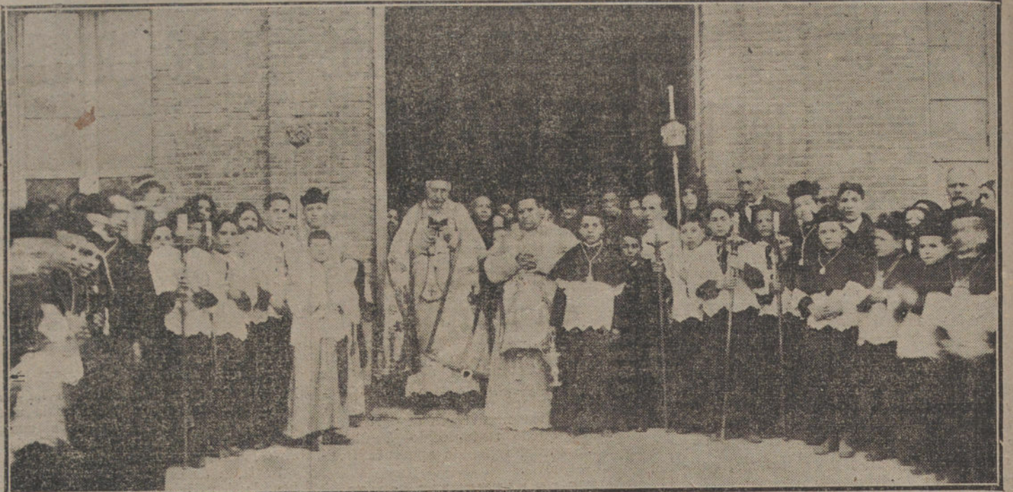
Acto de la bendición de una nave para nuevos talleres de carpintería, en el Asilo de los Padres Salesianos.

La ceremonia de traslado, a la que asistirán Comisarios de Jefes y oficiales de