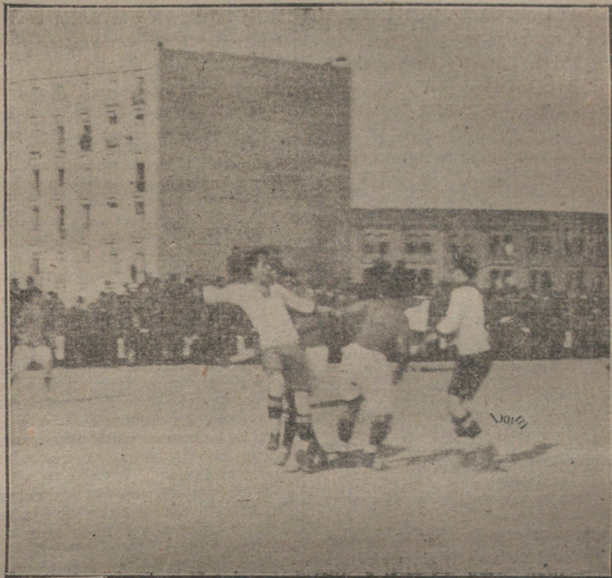
Un momento interesante del partido de foot-ball, jugado ayer tarde entre «C. D. European», de Barcelona, y el «Madrid F. C.»

En virtud de esta ley, un propietario puede desahuciar al colono, al arrendatario o al inquilino según le venga en gana, sin otra consideración que su capricho. Cuando las teorías antiguas sobre el derecho de propiedad están siendo objeto en todo el mundo de amplias revisiones, es absurdo que España se encastille en una legislación atrabiliaria y opresora. El inquilino, el arrendatario o el colono son, en realidad, copartícipes del propietario. A él han unido la prosperidad de su negocio, y éste, por lo tanto, no debe depender de la veleidat o la codicia usuraria del dueño de la finca. ¿Cómo redimir al colono del esfuerzo asiduo, si el propietario puede, en cualquier momento, desahuciarle? ¿Cómo indemnizar al inquilino de las pérdidas ocasionadas por un traslado inmotivado? La