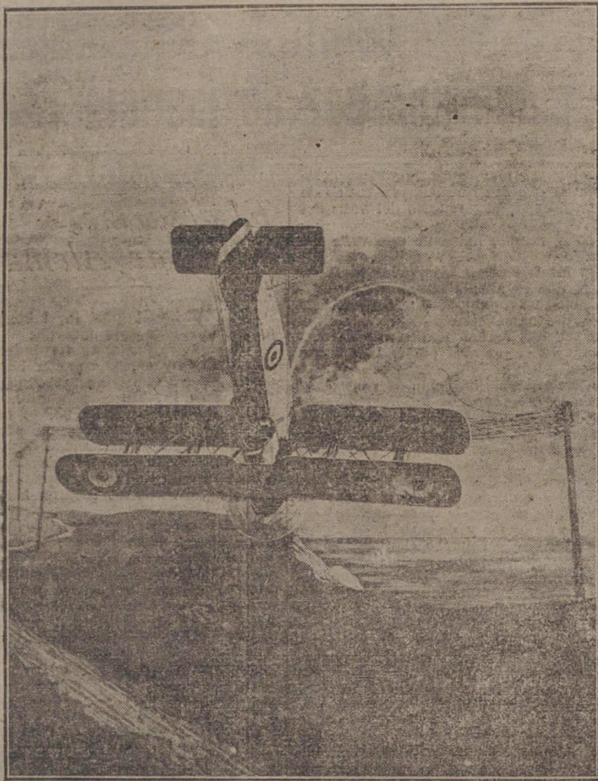
LAS ENSEÑANZAS DE LA GUERRA.—Interesante empleo de los aeroplanos para cortar las líneas telefónicas, según procedimiento usado en la pasada guerra.

PARIS. M. Breton, ex subsecretario de Invenções, ha dado una interesante conferencia en la Liga de la Enseñanza sobre el papel desempeñado por los carros de asalto. Hizo la historia de su invención y de su empleo. La estabilización de los frentes tras de las redes de alambradas condujo en breve al estudio de medios