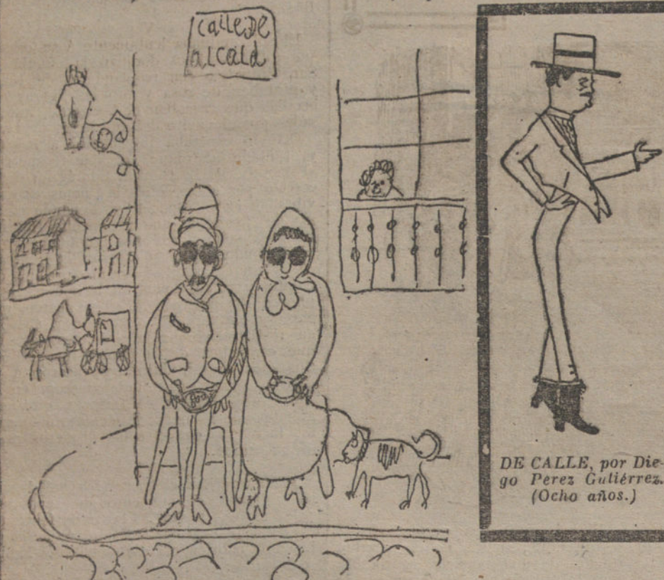
DE CALLE, por Diego Pérez Gutiérrez. (Ocho años.)

—Veinte céntimos no más, Felipa. —Hay que ver!