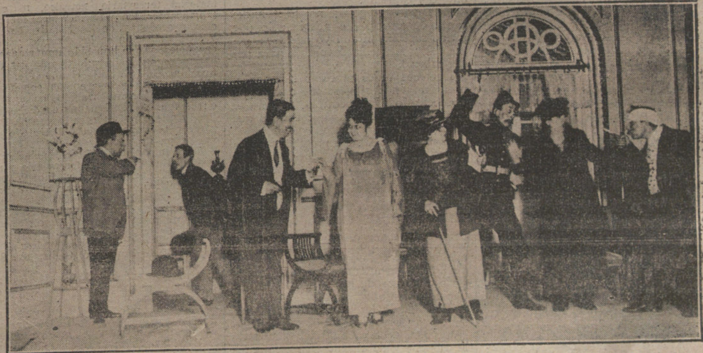
Una escena del juguete cómico, «La plaza de primo», que se estrena esta noche en el teatro de la Infanta Isabel.

La reducción de la jornada, idea acariciada por nosotros, tiene la virtud de situar a los obreros en un estado moral nunca obtenido, máxime cuando todos los oficios y artes del mundo se aprestan a imponer en esta hora suprema de la justicia y de la razón, la