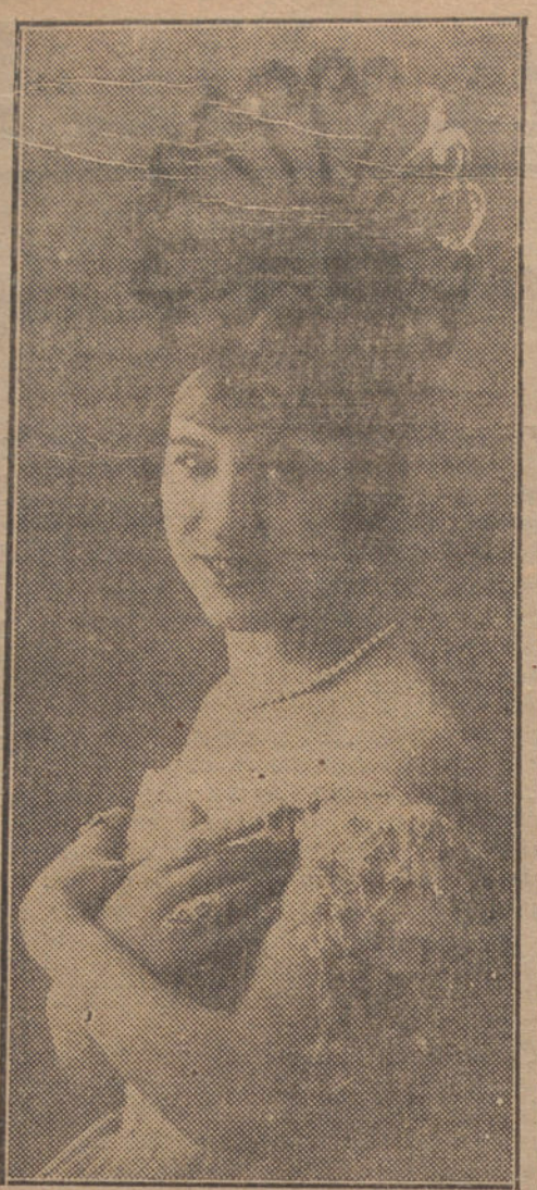
La Damayanti, preciosa bailarina, que se ha presentado en Lara con feliz éxito.

les interesa mucho saber que en la calle del Barquillo, 21, se ha instalado un nuevo salón de audiciones para la venta de PATHEFONOS, GRAMOFONOS, DISCOS PATHE Y AGUJA, PIANOS, AUTOPIANOS Y ROLLOS . Discos, a 2 pesetas. Rollos, a 1,50 pesetas.