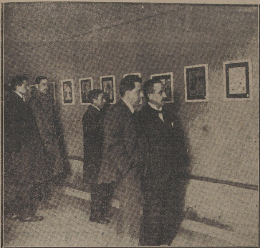
Un detalle de la Exposición de caricaturas de «Tito», inaugurada ayer en el Ateneo.

do hace el más mínimo gesto de cansancio, se le fusila. A la cabeza de su policía secreta, Clemenceau sostiene a antiguos policías del Zar de Rusia, entre los que hay algunos especialistas de la provocación y de la tortura.