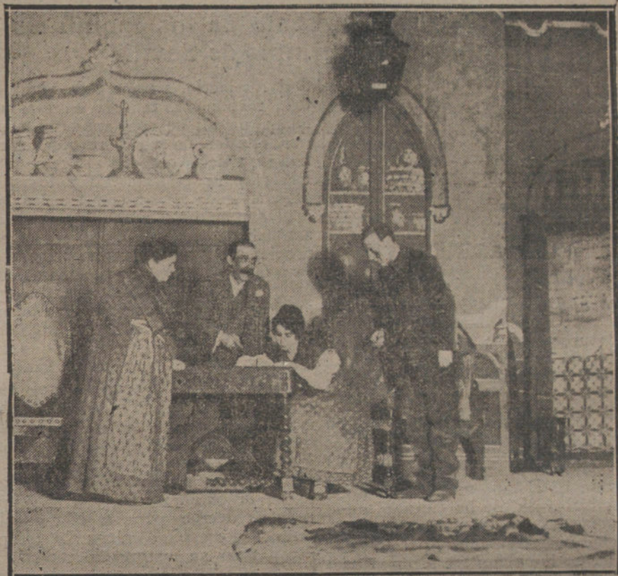
Una escena del drama «La Casaca», estrenado anoche en el teatro del Centro.

Por última vez puede intentarse ahora una solemne rectificación; por última vez el país quiere confiar en la enmienda de sus directores. Cuando empezó á hablarse de imprimir al Poder alguna fertilidad con el ingreso de ciertos elementos nuevos, la nación ha querido reiterar sus aspiraciones. Si no se le hace caso, si se desoyen sus deseos, si todo se reduce al fin á una de tantas farsas desacreditadas, ¿con qué derecho podrá pedirse paciencia? ¿No habrá sonado la hora de que nos aprestemos á la defensa personal? Por otro lado, tampoco quedan muchas horas para decidirse. In-