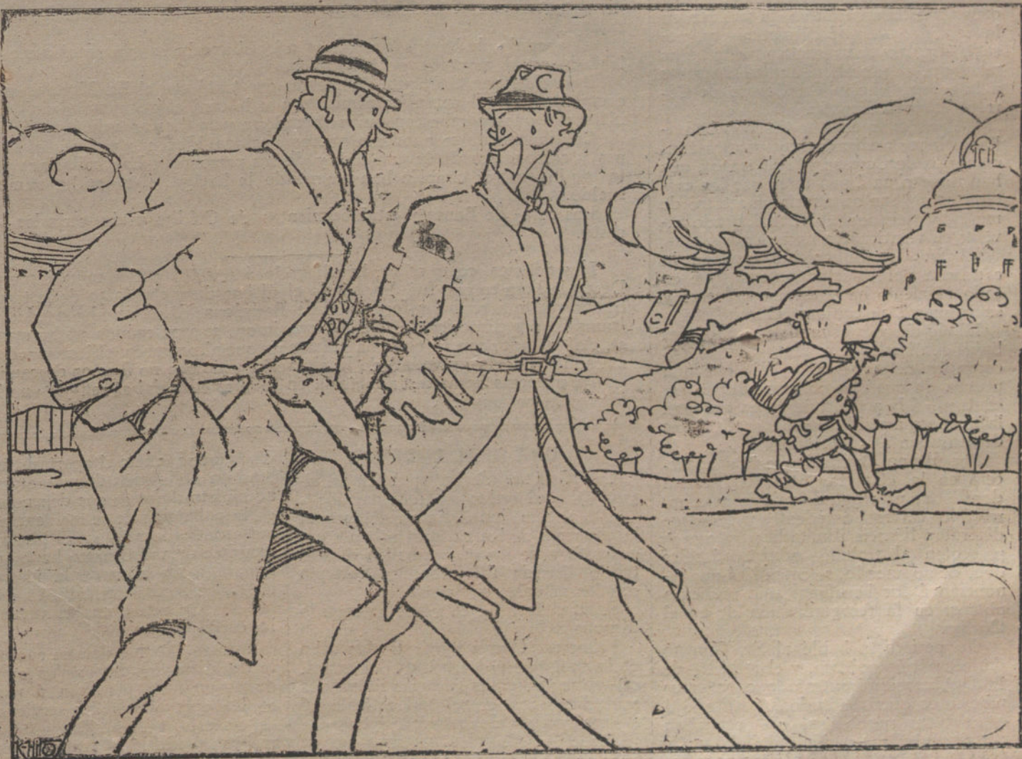
LA HUELGA DE CARTEROS

—... y debe resultar algo pesado para quien, continuamente, haya de tomar cartas en estos asuntos.