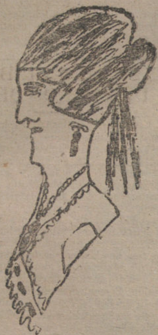
MI HERMANA, por Carmen Bermúdez. (Once años.)