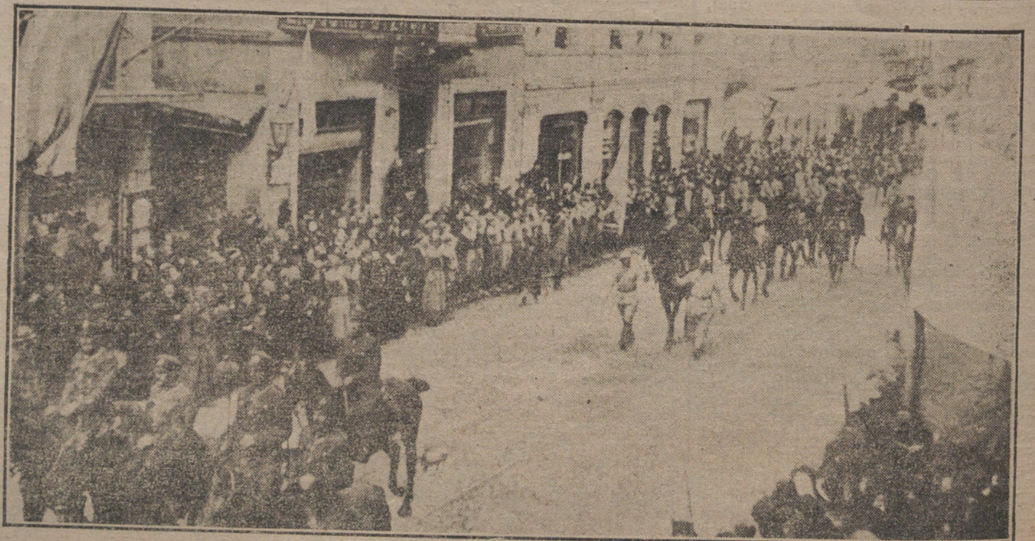
DESPUES DEL ARMISTICIO.—Entrada de las tropas aliadas, dirigidas por el general Franche d'Espérey, en Constantinopla.