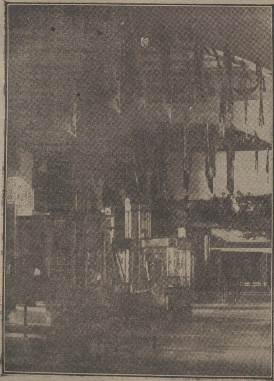
Un ángulo del Museo de Banderas de la Academia de Infantería de Toledo, donde serán depositadas las banderas, sacadas esta mañana del Museo de Artillería. Ayuntamiento de Madrid

El «Daily Chronicle» dice: «Los rumanos, polacos y checoslovacos son columnas sin las cuales no puede sostenerse una Europa central libre ni futura.»