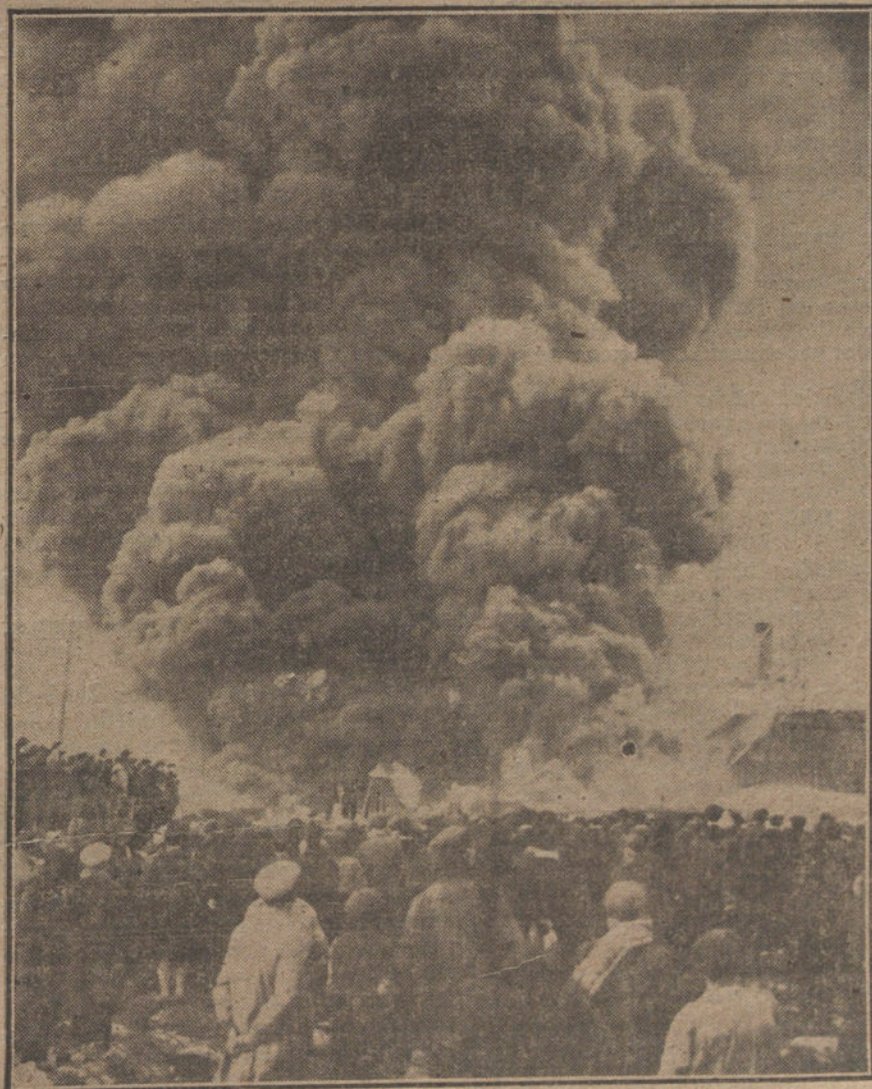
Formidable incendio en el puerto de Barcelona, de más de 2000 bala de algodón, ocasionado por la explosión de un cargamento de petróleo

«Esto no quiere decir—agregó—que, según el curso que los sucesos tomen, no nos reunamos, para estar prevenidos contra cualquier contingencia.