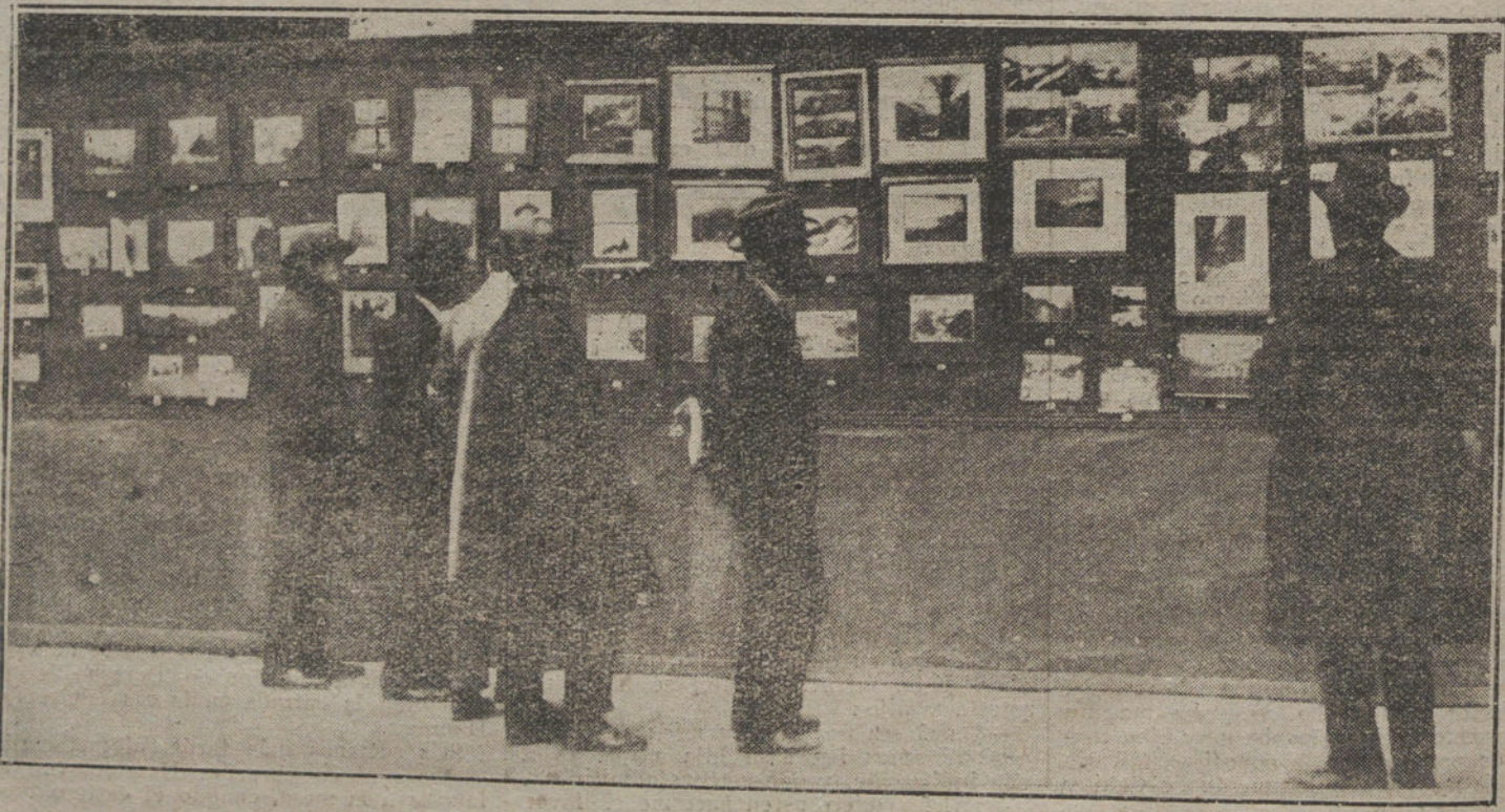
Un detalle de la Exposición de fotografías de la guerra, que se celebra actualmente.

A no ser que tomemos medidas muy serias para evitar que el bolchevismo salga de Rusia, todo el programa completo