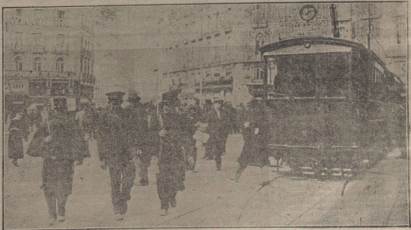
Los incidentes en las calles de Madrid.