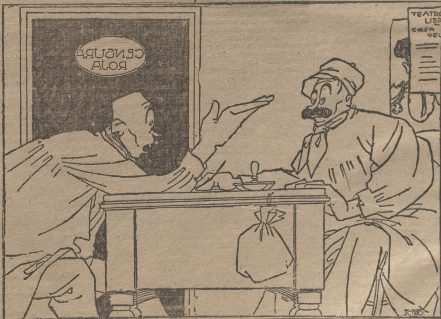
LAS ARMAS DEL OBRERO

El jornal mínimo será 2,50, para las mujeres y jóvenes que no pasen de diez y seis años. A las mujeres y hombres que se hallen comprendidos entre los diez y seis y diez y ocho años se les dará tres pesetas, y á cuantos trabajen en los subterráneos deberá abonárseles 5,25.