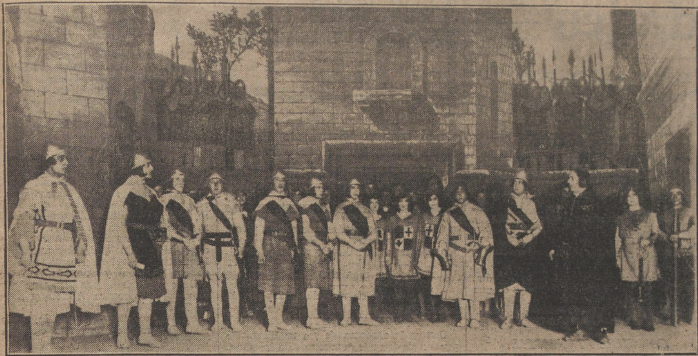
Una escena de «Blasco Jimeno», obra estrenada anoche en el teatro Español.

cuendan las palabras que pronunció Paderewski en Dantzig, en Diciembre del año pasado.