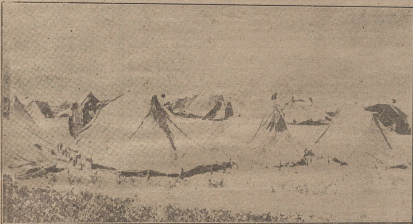
Campamento de las fuerzas del Raisuli en Beni-Arcs.

Un periódico ha dicho, reflejando, quizás, el propio pensamiento del señor conde de Romanones: