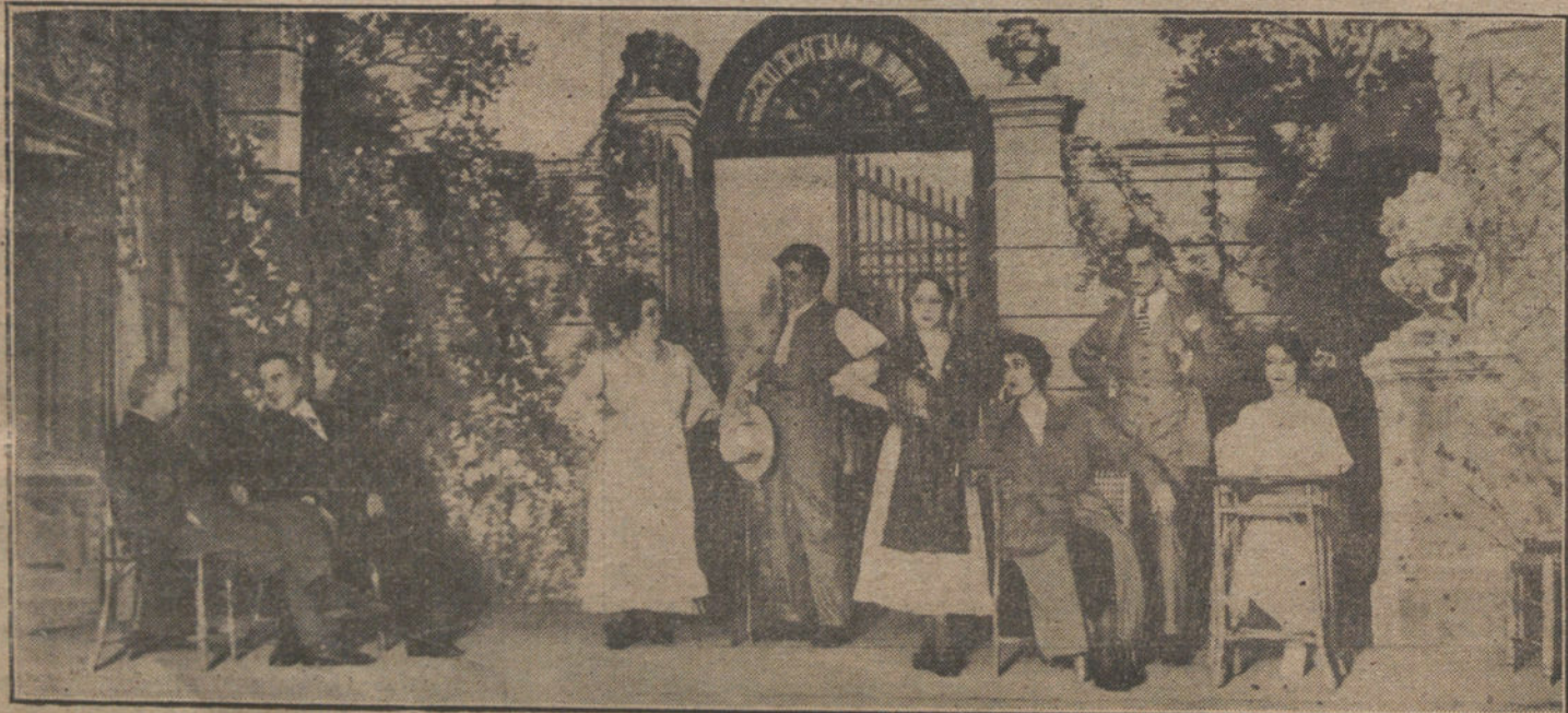
Una escena de «Nubécita de verano», obra estrenada en el teatro Infanta Isabel.

BERLIN (Radiograma de Nauen.) Los periódicos, comentando el cambio de notas sobre el desembarco de tropas polacas, re-