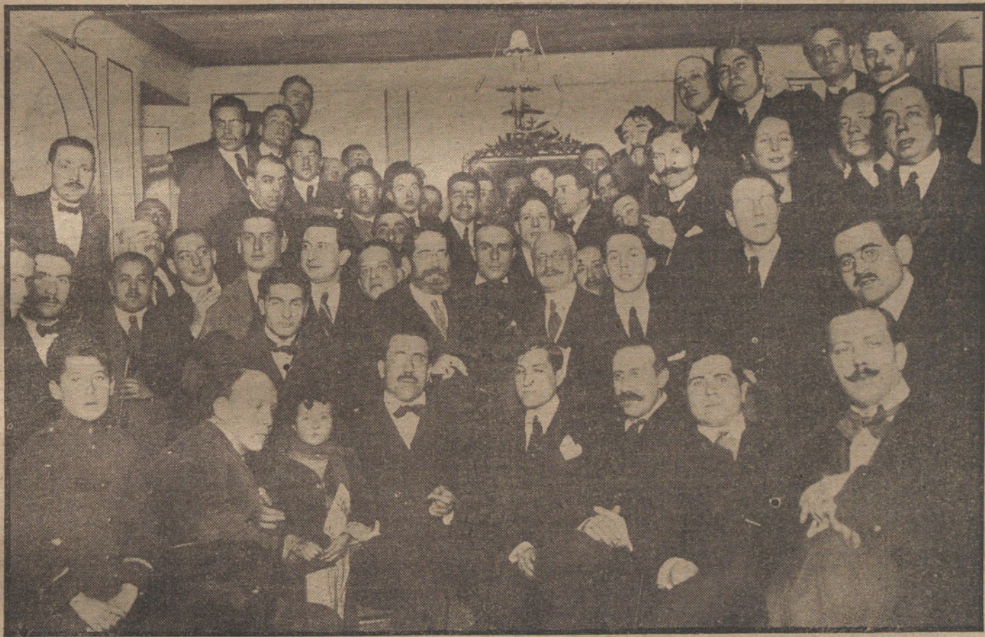
Aspecto de uno de los salones de Pombo al terminar el homenaje que se tributó anoche á los autores de «Egipto».

En tal caso, la guerra futura, roto el equilibrio, sería inevitable.»