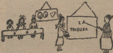
APRENDIENDO A LEER, por Pilar Yuste. (Once años.)