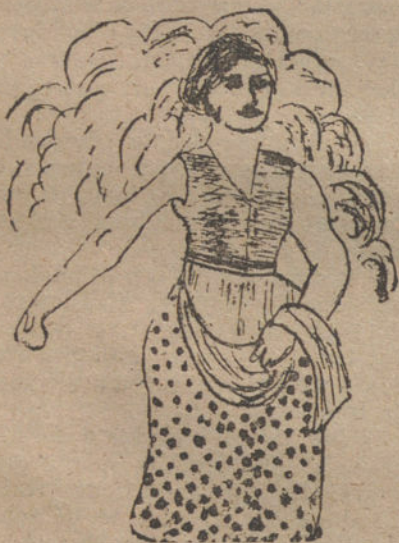
UNA MUJER SEMBRANDO, por M. Pontiveros López. (Trece años.)

gando una capa de aceite, otra de cebolla, cortada á filetes; unos dientes de ajos, dos hojas de laurel y un hilito de vinagre, sazónándolo de sal y un poco de pimienta blanca en polvo, y tapándose bien con un papel untado de aceite y una tapadera. Métase al horno para que se vaya cociendo muy suavemente. Al quedar bien cocida se sirve puesta en una legumbre.