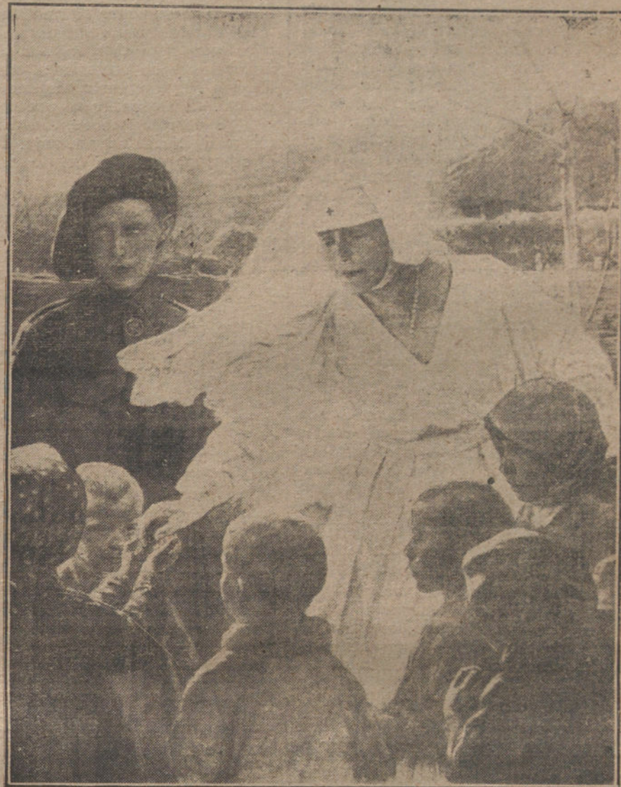
La Reina María de Rumania, en traje de enfermera, repartiendo limosnas en Luján a los huérfanos de la guerra

no; pero su respuesta fué bastante elocuente: