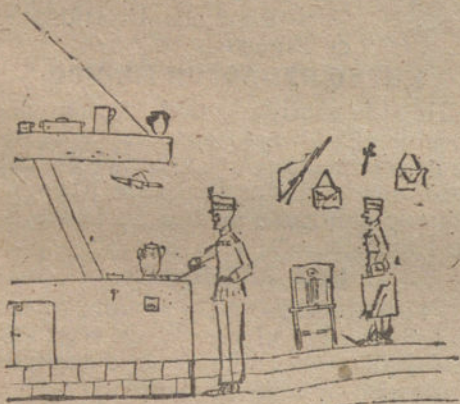
LA VIDA DE CAMPAÑA, por Carlos Serrano. (Diez años.)

ten enteros. Al servirse se coloca el arroz en el centro de una fuente redonda (si se quiere se puede moldear), y a su alrededor se colocan los tomates.