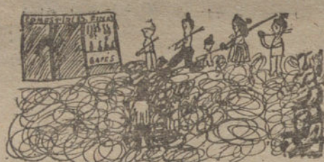
UN MOTIN, por Pilar Yuste. (Once años.)

—Anda, hombre, que están muy ricas. —Que no quité sopas. —Tienen ajo y canela. —¡Redíos, que no quité sopas! —Te daré una perrica pa vino. —Gueno; vengan las sopas.—