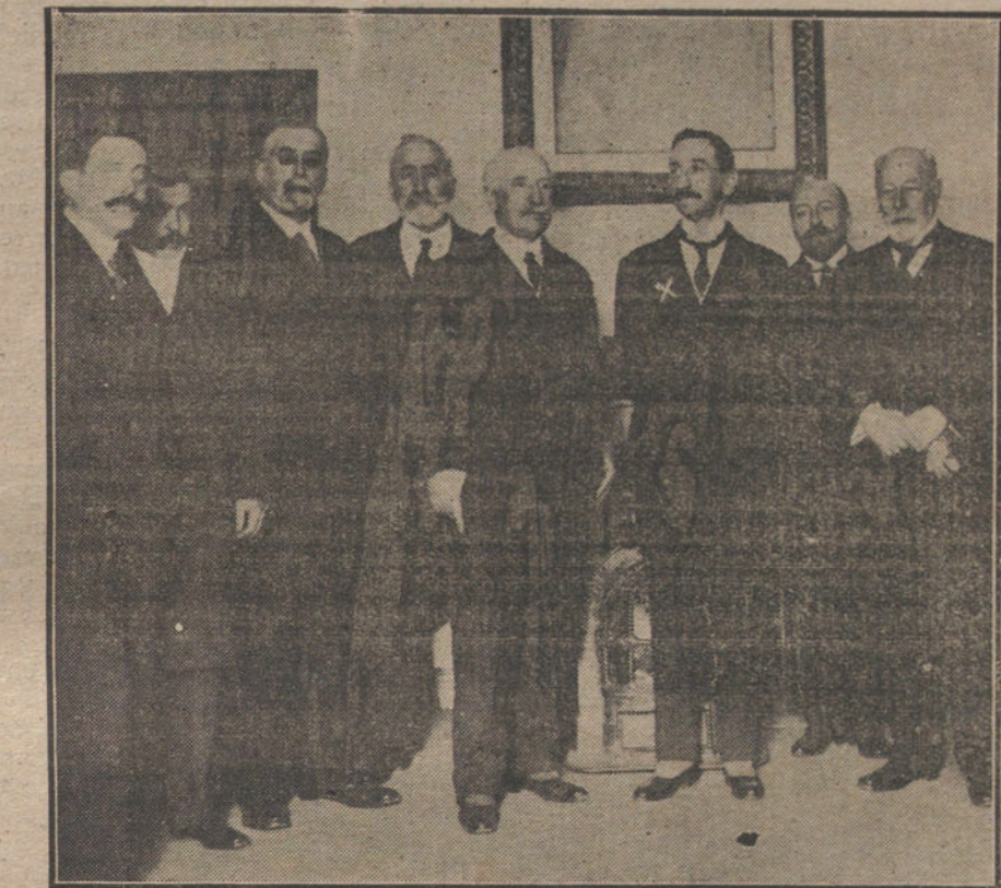
El viceconde de Eza, en la Asociación de Agricultores, donde ayer inauguró la semana agrícola, con una interesante conferencia sobre «El problema económico de España.

De todos modos, sean verídicas ó no nuestras noticias, el país no puede soportar en silencio la interinidad de una situación tan comprometedora. Porque es el caso de que los conflictos se echan encima. Las conmociones extranjeras no nos son indiferentes. El problema social no entra en vías de arreglo. La cuestión marroquí vuelve á preocupar-