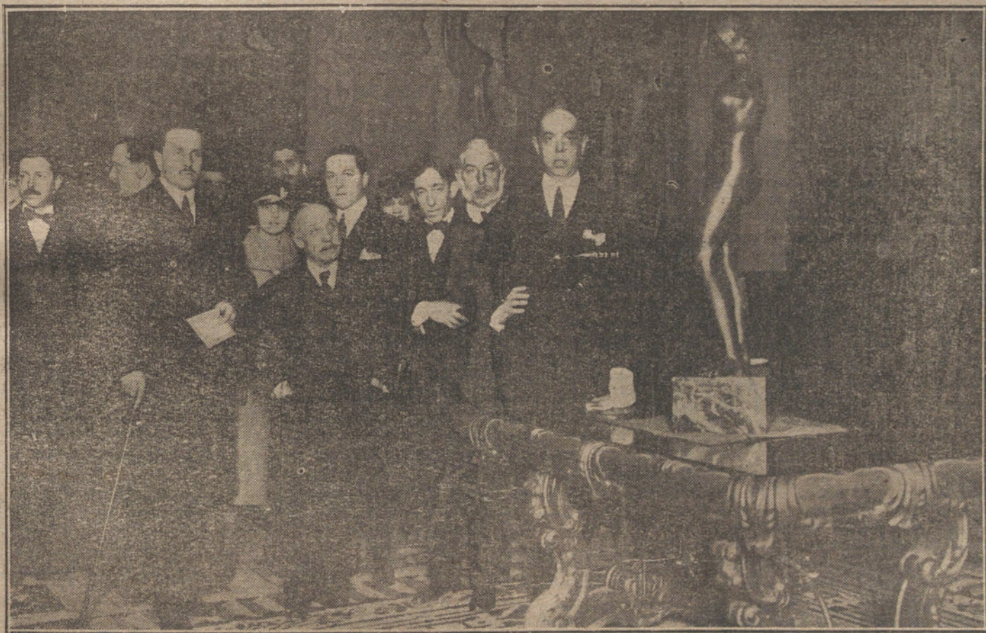
Apertura de la Exposición de obras del llorado escultor Julio Antonio, acto verificado ayer en los salones del teatro Real, con asistencia del ministro de Instrucción pública.

Muy señor mío: Ha causado indignación en Barcelona el artículo que, firmado por Adolfo Marsillach, se ha publicado en «El Imparcial» de esa, y en el que se ridiculiza y ataca al somatén. Esta indignación se ha hecho extensiva á todos los Cuerpos armados que en Barcelona se desviven para hacer renacer la calma y desmascarar á los que querían sembrar la ruina en la hermosa ciudad. En los Círculos militares se afirmaba que el dignísimo capitán general de la región exteriorizará la indignación que le causó la publicación del tal artículo, amparando con ello á los derechos de respeto y admiración á que se ha hecho acreedor el somatén por sus servicios prestados, que han contribuido á que en Barcelona vaya renaciendo la calma. Son grandísimos los servicios prestados por el somatén, formado por 12.000 hombres de todas las esferas sociales, des-