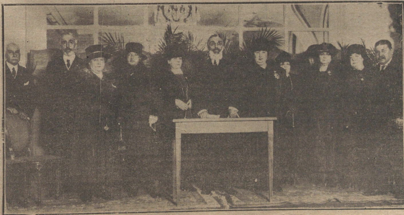
Conferencia dada ayer en el Hotel Ritz por el médico francés doctor Vidal, para las damas enfermeras de la Cruz Roja.