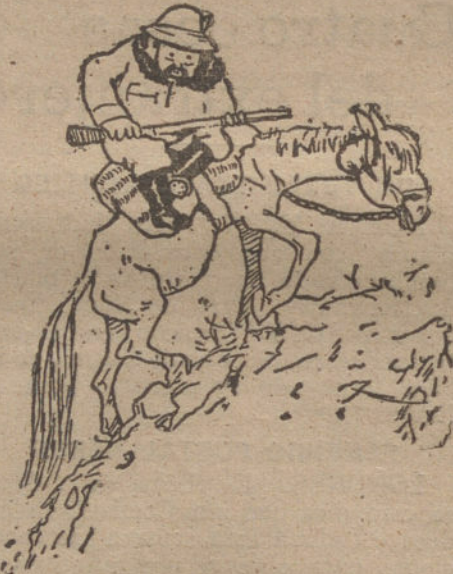
ASCENSION DIFICIL... PARA EL JACO, por Julio González. (Trece años.)