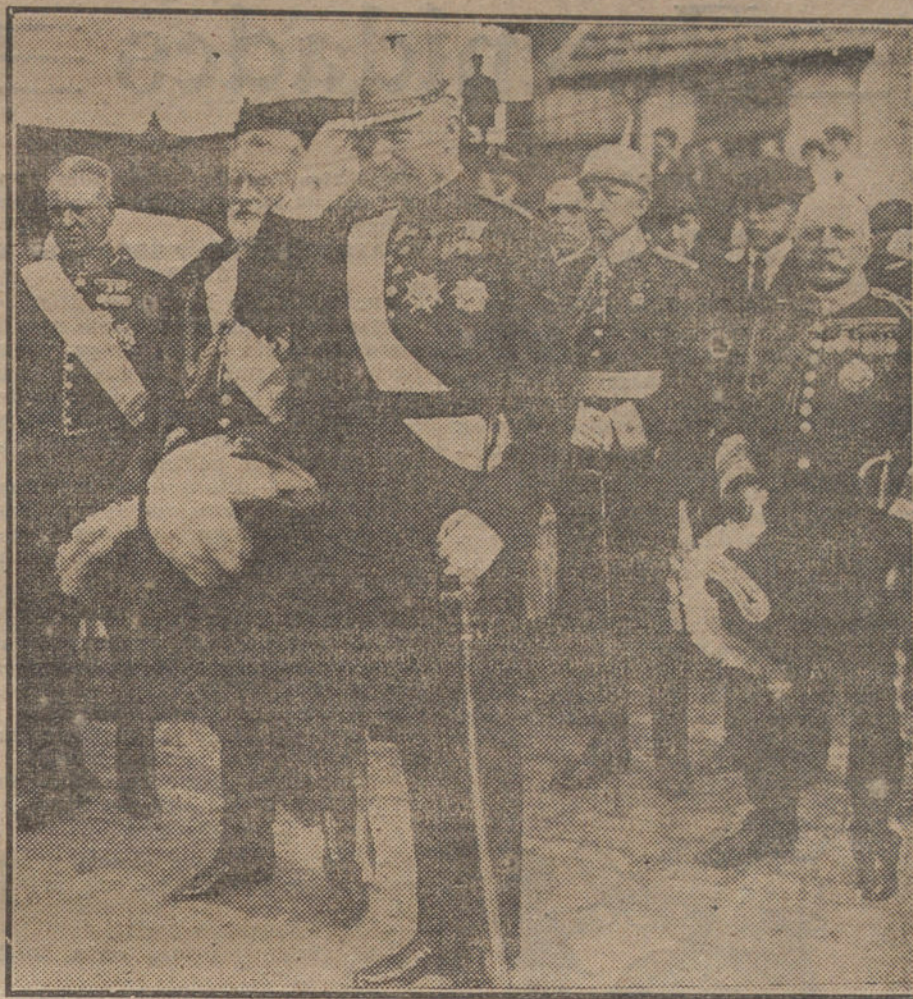
El Infante Don Carlos y demás personalidades que han presidido el duelo en el entierro del duque de Granada.