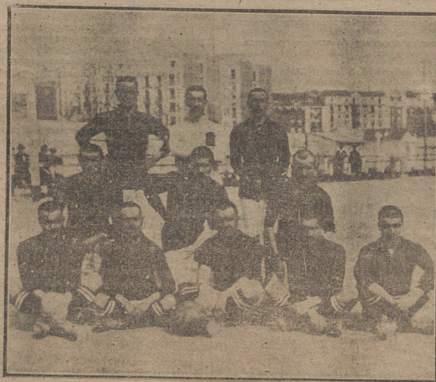
EL DEPORTE EN MADRID.—Equipo formado por soldados del regimiento de Húezes de Pavia, que esta mañana ha jugado un partido de foot ball contra el Ayuntamiento de Madrid.

Si la Dieta se niega será disuelta. Es probable que hoy mismo se proclame la República de los Consejos.