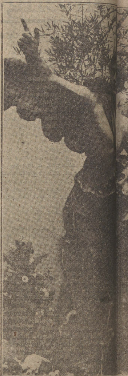
LA ORACION DEL HUERTO.—Nuestro Señor.

Combata después la interpretación de Teófilacto del texto de San Lucas, en cuya expresión no vio otra cosa que una hipérbole, y refuta asimismo la apreciación de Eutimio, según el cual