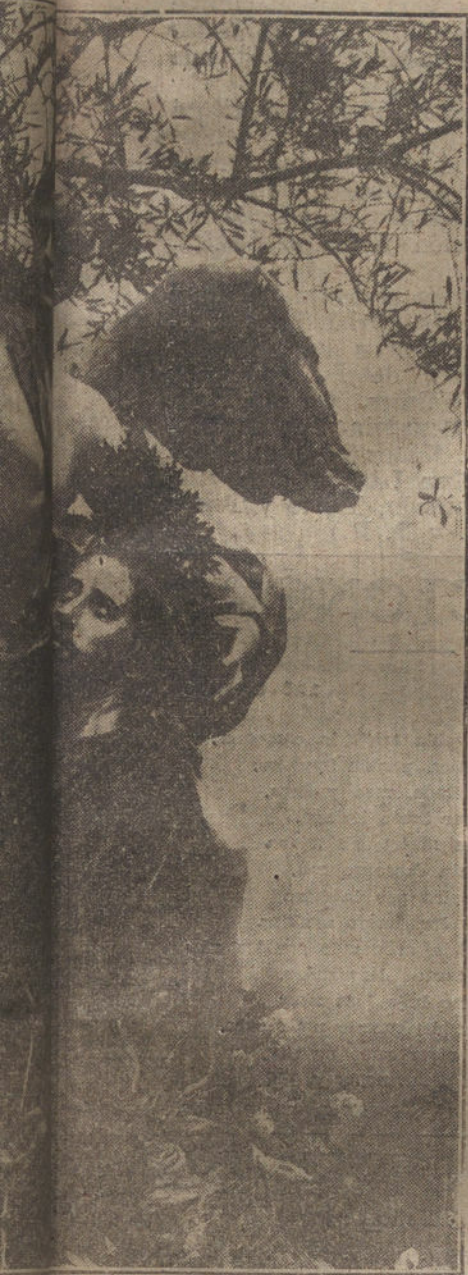
Representación de Sancho, que se conserva en la...

teológica, es tan profunda como sencilla: «Si aquella sangre—dice—hubiese manado milagrosamente, y no en virtud de la aflicción interior, no hubiera sido señal cierta y evidente de muy grande angustia y tristeza interior, pues milagrosamente hubiera podido emitirse con poquísima o ninguna aflicción. Ahora bien, esto es contrario al sentir de todos los Santos admitido por toda la Iglesia.» El milagro, pues, suprime la aflicción y enerva el amor.