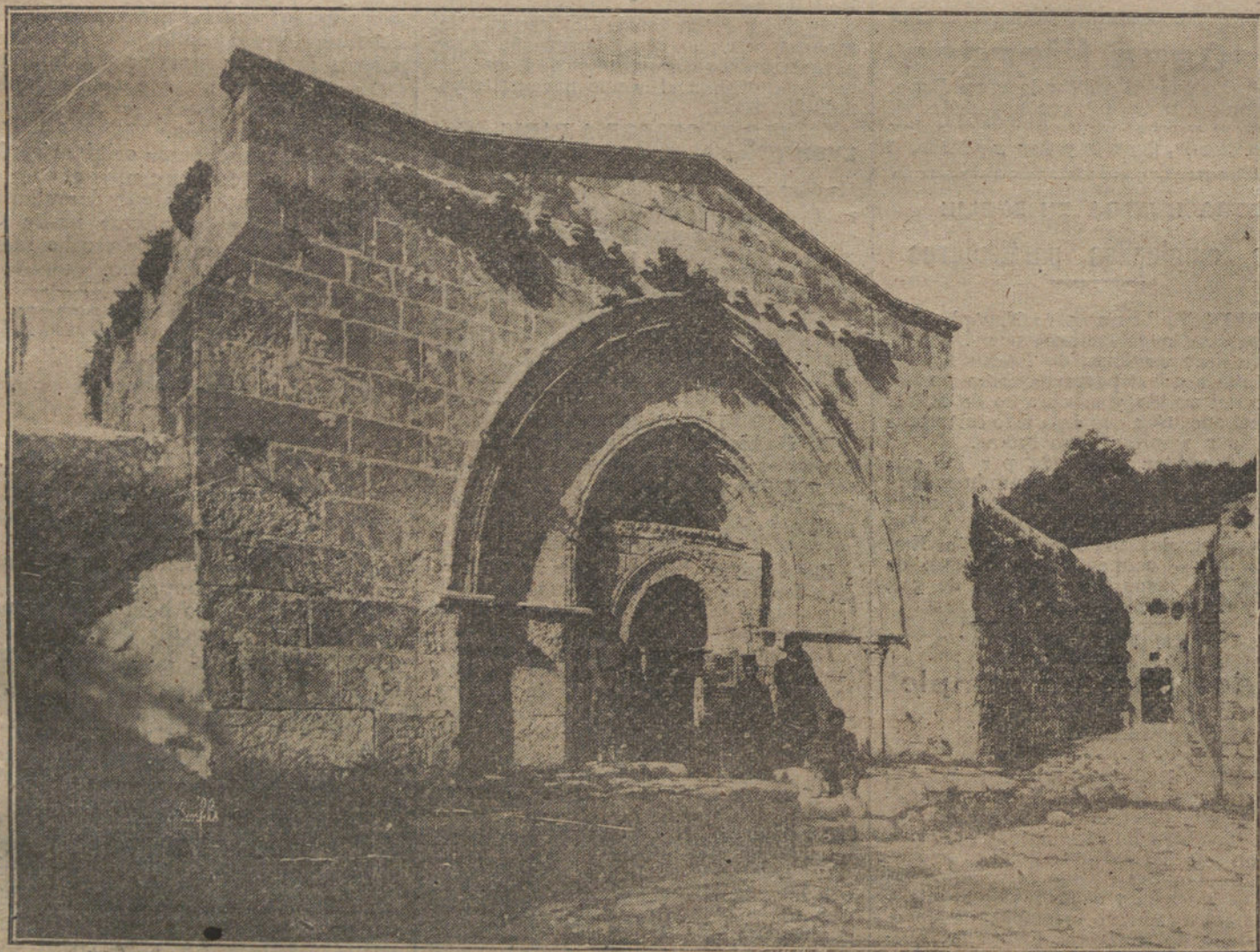
Tumba de la Virgen y Gruta de la Virgen Ayuntamiento de Madrid