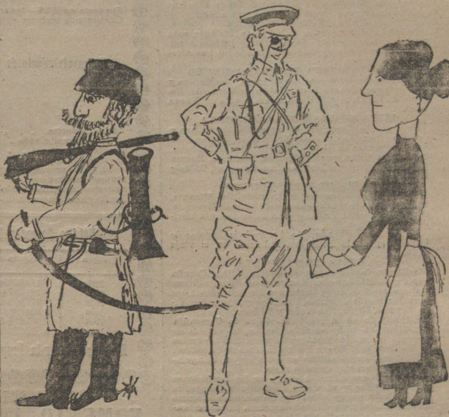
UN BOLCHEVIKI RUSO, por Marcelina García Ortiz (seis años.)