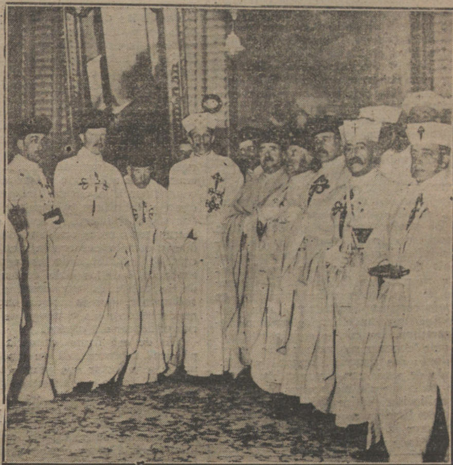
Su Majestad el Rey y Su Alteza el Infante Don Fernando, presidiendo los Oficios, verificados ayer en las Comendadoras, por el Capítulo de los Caballeros de Santiago.

Tercera. La orilla izquierda del Rhin quedará desmantelada, en el sentido de que no podrá Alemania sostener ninguna obra militar, bien sea en fortaleza, en estaciones, en campos de instrucción o en fábricas de material de guerra. Se trata, naturalmente, de la región alemana de dicha orilla izquierda; pues en algunas regiones, el territorio propiamente incorporado a Francia llega hasta el río, como ocurre, por ejemplo, en Estrasburgo.