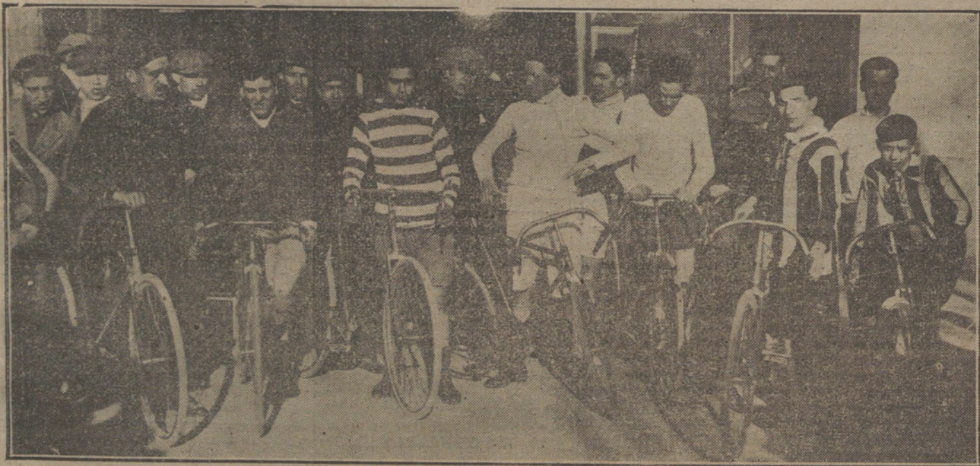
Ciclistas que tomaron parte en las carreras de competencia. Ayuntamiento de Madrid.

Los caballos, caballos de arcángel, caballos de Santiago, caballos de otra época, caballos de rin. Este número es sólo de pista y por eso no se ve durante todo el invierno, aunque ese coché con sombrero de copa, al que se le rompe el coché, y con la fusta en la mano tiene que llevar á la cuadra su caballo cogido de la larg