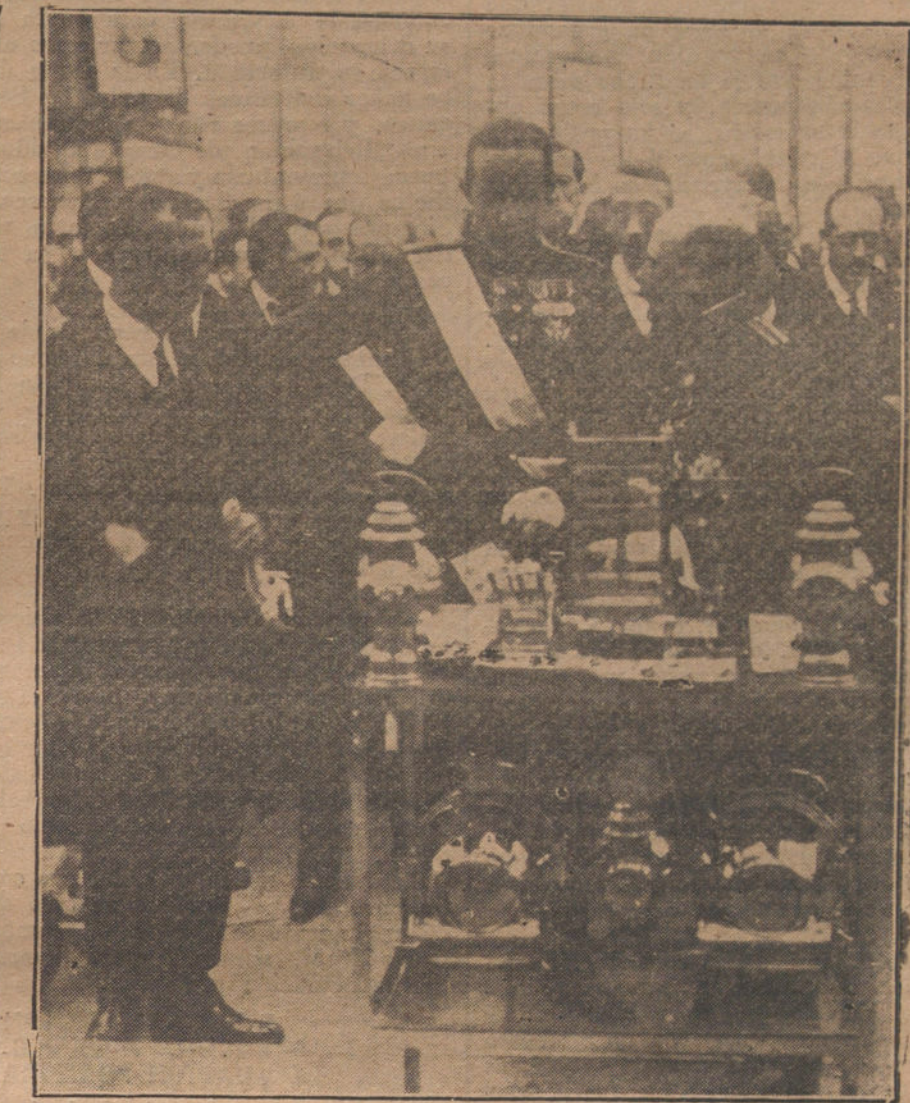
Su Majestad el Rey, viendo una de las instalaciones de la Exposición de Higiene, inaugurada ayer tarde.

no lo consiguen por los evidentes trastornos que causan á la propia opinión. Claro que en estos términos podría discutirse si el trastorno parte de