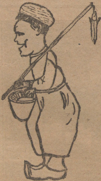
PESCADOR HOLANDES, por A. Correig Massó. (Nueve años.)

—No la quiero, «primera» muy «segun- da» —J. Jiménez Pérez. (La solución, mañana.)