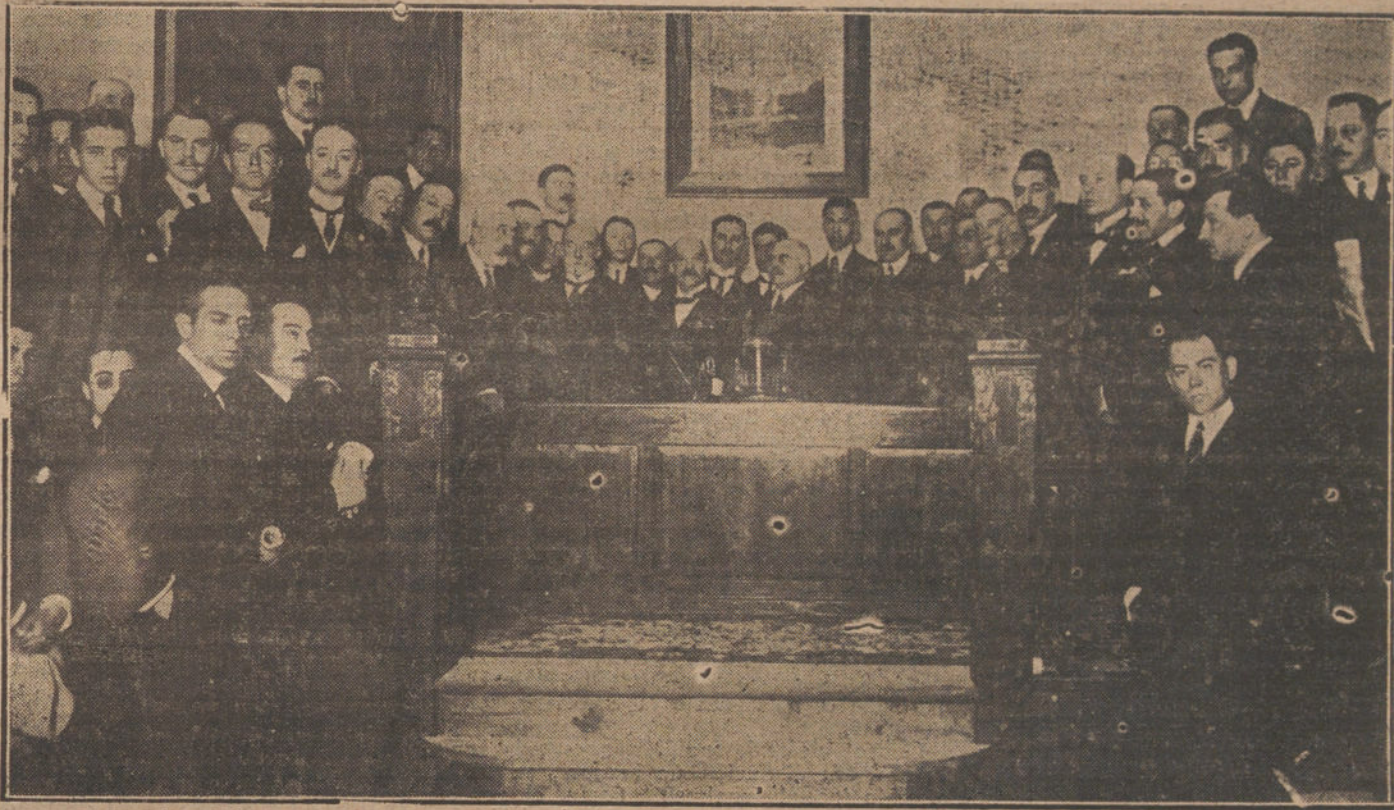
DEL CONGRESO DE MEDICINA.—Congresistas que han concurrido a las conferencias científicas, dadas esta mañana en el Hospital del Niño Jesús.

ALICANTE. Los tipógrafos siguen completamente intransigentes, y la huelga es absoluta. No se publica ningún periódico.