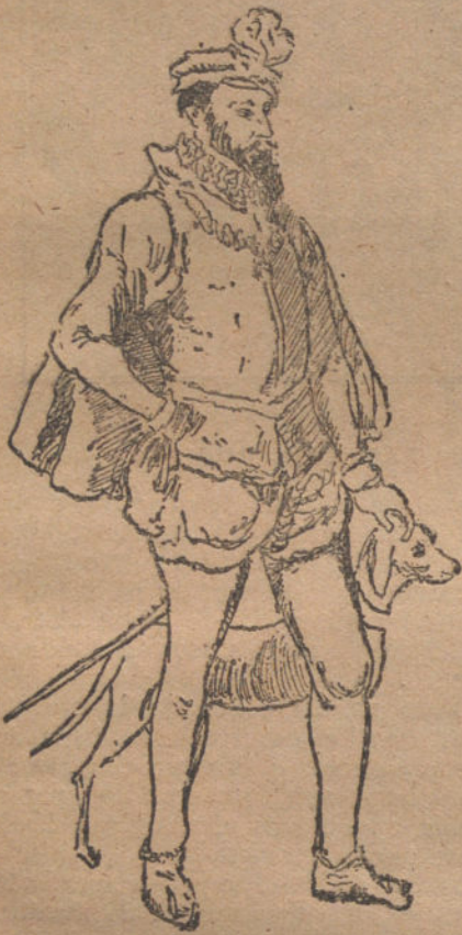
«DE PIE ESTABA CARLOS V...», por Miguelito Alfonso Pérez.

las rajitas de huevo, mezclándole bien, procurando reducirlo a pasta, con la cual se hacen unas bolitas como albondiguillas ó un poco aplanadas. Se dejan enfriar y se untan con claras de huevo batidas. Se ponen en un plato y se las deja desli- zar en aceite muy caliente.