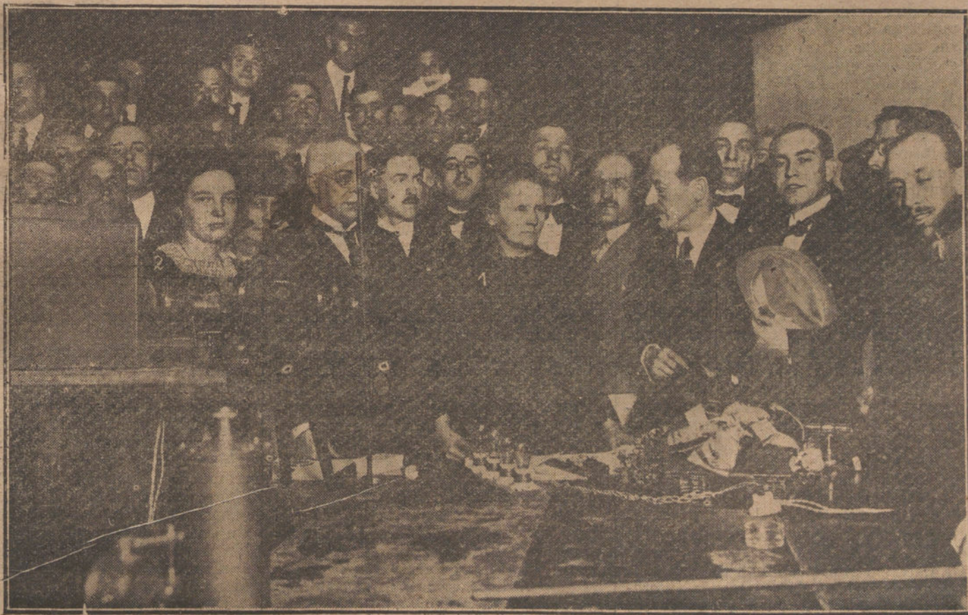
Madam Curie (1), con su hija (2), durante la interesantísima conferencia que dió ayer en la Facultad de Medicina.