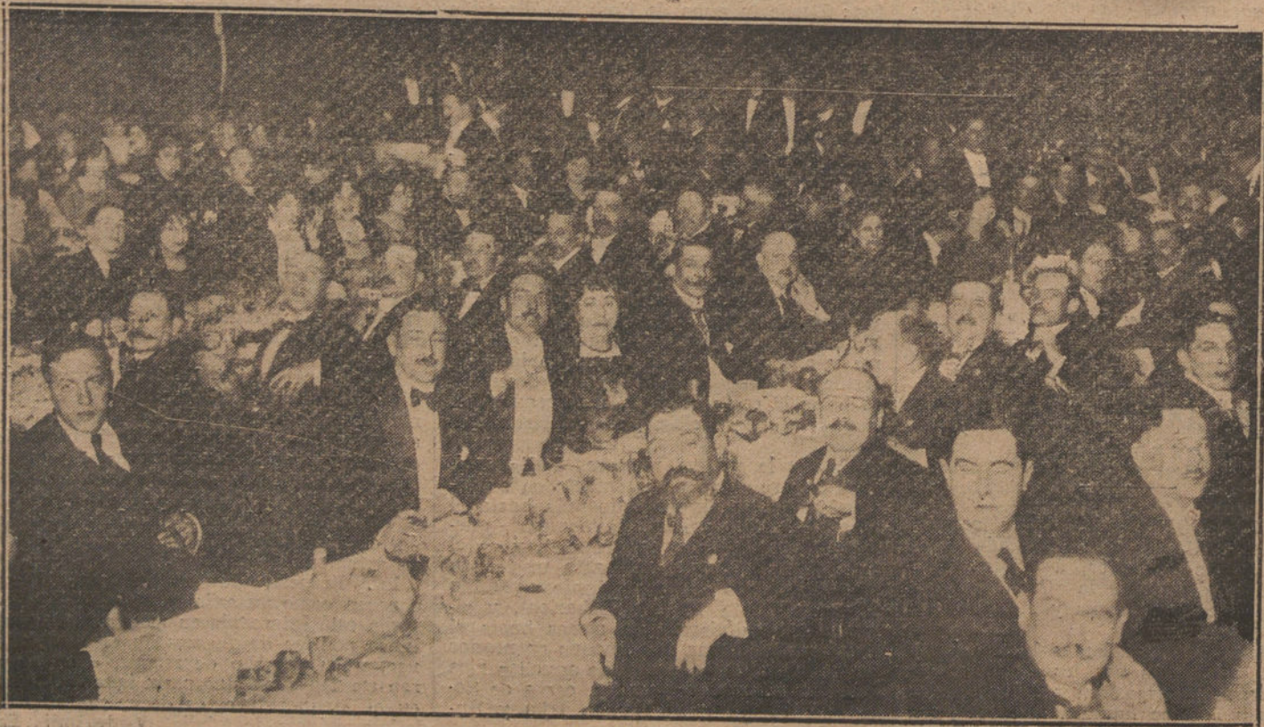
Bandueto celebrado anoche en el Palace Hotel por los asistentes al Congreso Nacional de Medicina

Producirá, pues, para un capitalismo ajeno, solamente al fijarse en un convenio condiciones justas. En su trato con Alemania, los aliados pueden, ó reconstituir nuevamente á Europa, ó destruirla por completo. Está en su propio interés