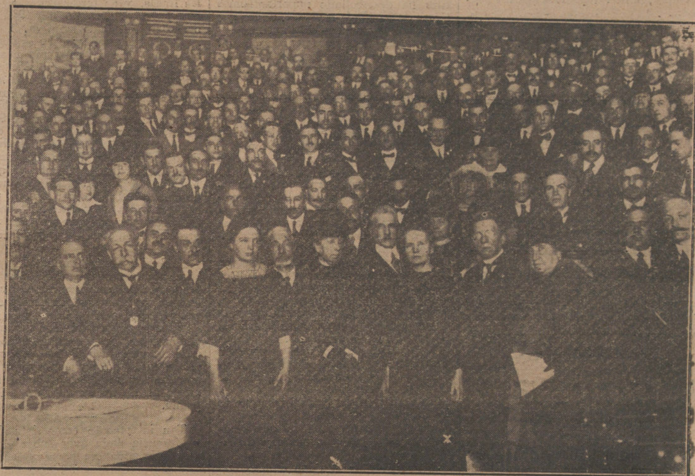
Su Majestad la Reina Cristina, acompañada de madame Curie (X), al terminar ésta la conferencia dada ayer ante el Congreso de Medicina, en la Facultad de San Carlos.

Es natural que, de momento, el anuncio de que vendría carbón de Inglaterra ha producido una inmensa perturbación en el mercado hullero español. Las Compañías de ferrocarriles están continuamente anulando contratos con productores españoles; el pánico ha comenzado á cundir en la cuenca hullera de Asturias y de León; los valores de Empresas hulleras se hallan en baja, que es lo que se pretende seguramente, y todos los agiotistas que en el tiempo de la guerra jugaban al alza, están ahora haciendo fabulosos negocios jugando á la baja, aprovechándose del secreto que les da el disfrute del Poder. Este es el negocio escandaloso que se está haciendo alrededor y con motivo del de la firma del Tratado. Se quiere arruinar á la industria carbonífera española, con la finalidad de conseguir acaparar deter-