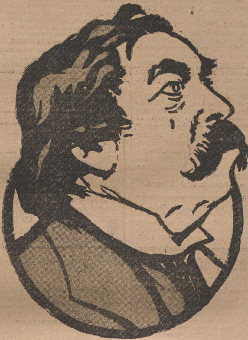
M. Aristides Briand, jefe del nuevo Gobierno francés que sustituirá al de M. Clemenceau, al firmarse la paz.

FRANCIA, ALEMANIA Y EL JAPON CONTRA INGLATERRA, LOS ESTADOS UNIDOS E ITALIA. LAS IRREDUCTIBLES DIVERGENCIAS EN LA COMISION DE LA LIGA DE LAS NACIONES. CLEMENCEAU Y LA «POLITICA DE DOULLENS». HACIA UNA INTELIGENCIA FRANCOALEMANA. LA POLITICA DE BROCKDORFF RANTZAU Y LA DEL FUTURO GOBIERNO DE BRIAND