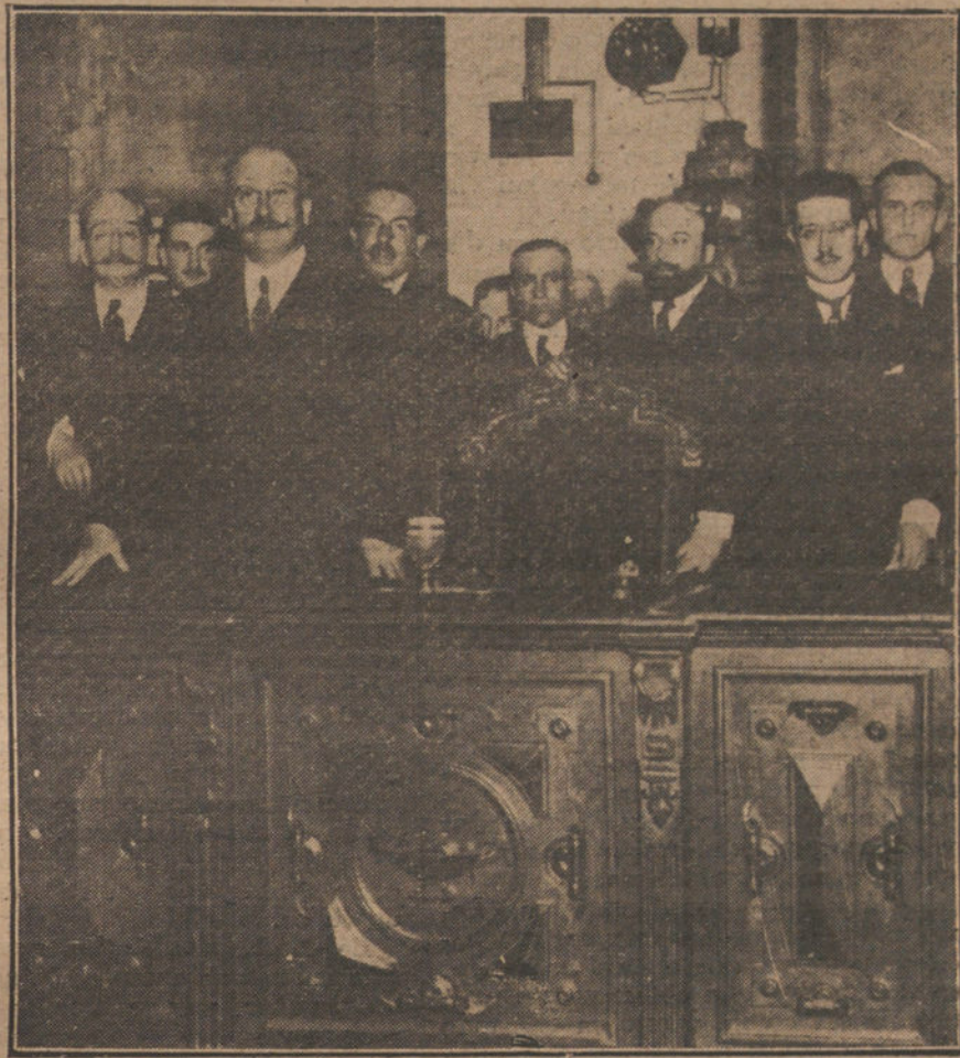
El jefe del partido radical, Alejandro Lerroux, al terminar su conferencia sobre «El momento político», dada ayer tarde en el Ateneo.

Que no fué la solución de la crisis consecuencia de un estado de opinión,