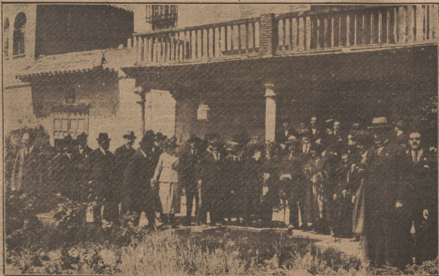
DEL CONGRESO DE MEDICINA.—Grupo de congresistas médicos, visitando la Casa del Greco, durante la excursión que se hizo a Toledo.

Así se cree que el doble centenario del nacimiento de Ponce de León y