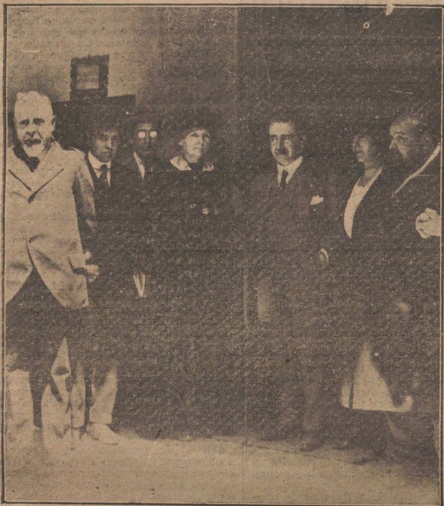
DEL CONGRESO DE MEDICINA.—Madame Curie, en la visita que ayer hizo con los demás congresistas a los monumentos de Toledo.

siguió romper nuestras líneas, apoderándose de la ciudad de Vilna.