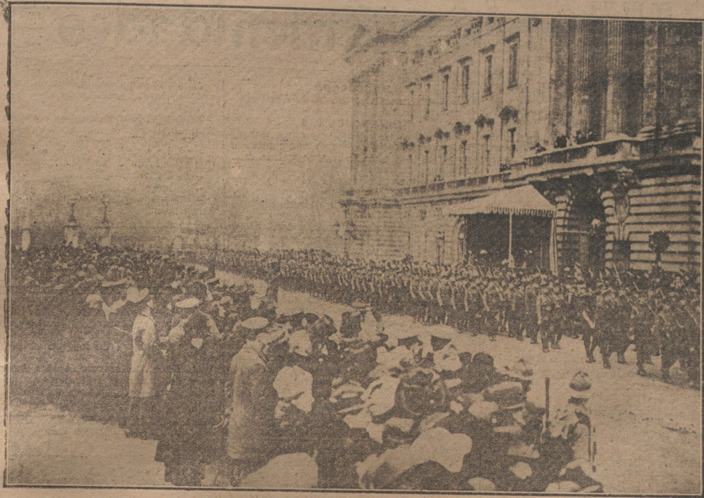
¡SPUES DE LA GUERRA. —Paso de las tropas inglesas repatriadas, ante el Palacio Real de Londres, desde cuya tribuna presencian los Reyes el desfile.

medidas relativas a la estancia de los plenipotenciarios.