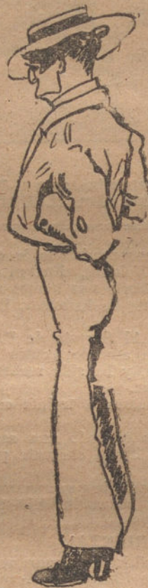
UN PERSONAJE DE LA CALLE DE SEVILLA, por Julio Alonso. (Diez y seis años.)

Se rehoga en la sartén una rebanada de pan tostado y una cebolla desmenuzada, lo cual, ya entrefrito y con el pan en migajas—se echa en el caldo mencionado de los garbanzos, dejando hervir el todo hasta estar deslizado. Con el caldo que resulta se cuecen los macarrones.