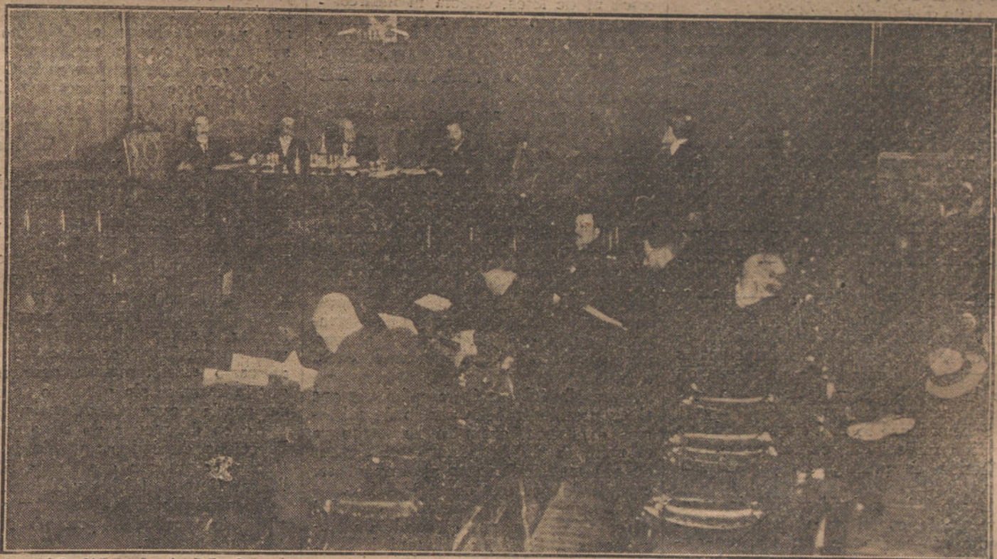
Asamblea de médicos provinciales de España, celebrada ayer tarde en la Diputación de Madrid.

Si no fué el Ejército, porque «La Correspondencia Militar» afirma que «ningún factor de la opinión militar dificultó, de cerca ni de lejos, directa ni indirectamente, la formación de UN GOBIERNO LIBERAL-PARLAMENTARIO, QUE NOSOTROS TAMBIEN CREEMOS DEBIO TRATARSE DE CONSTITUIR», ¿quién aconsejó la solución de esta crisis?