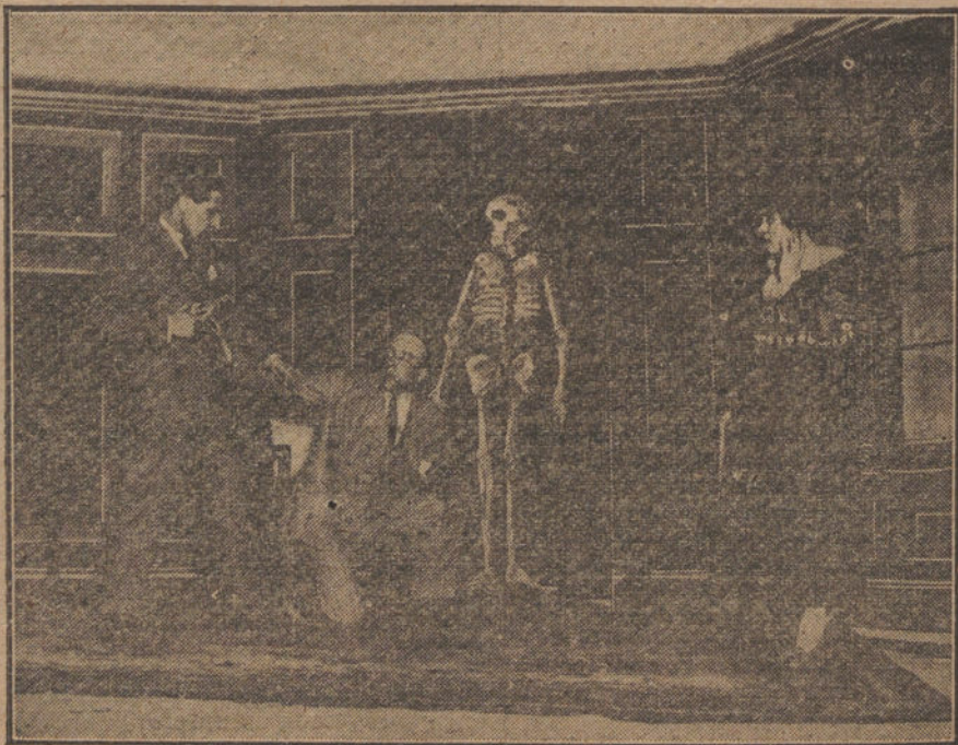
Una escena de «El hombre que ve la muerte», obra estrenada anoche en el teatro Cómico.

Tomará posesión de los locales asignados á la Delegación y se informará de las