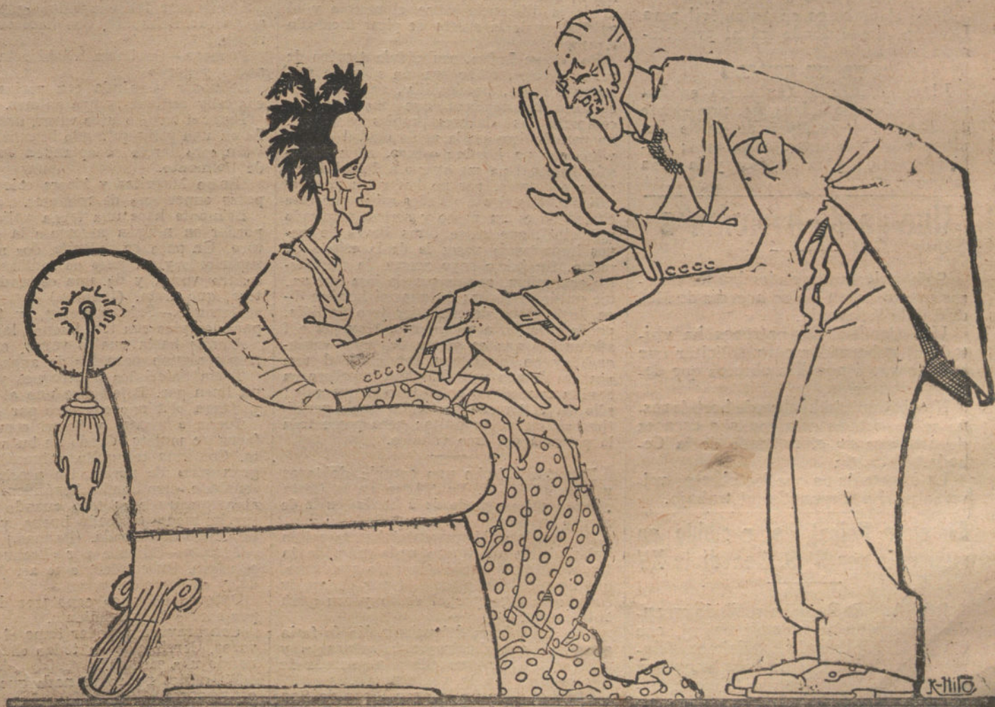
LOS CONSEJOS DEL DOCTOR

Los telegrafistas han desoído los auxilios que algunos agitadores les brin-