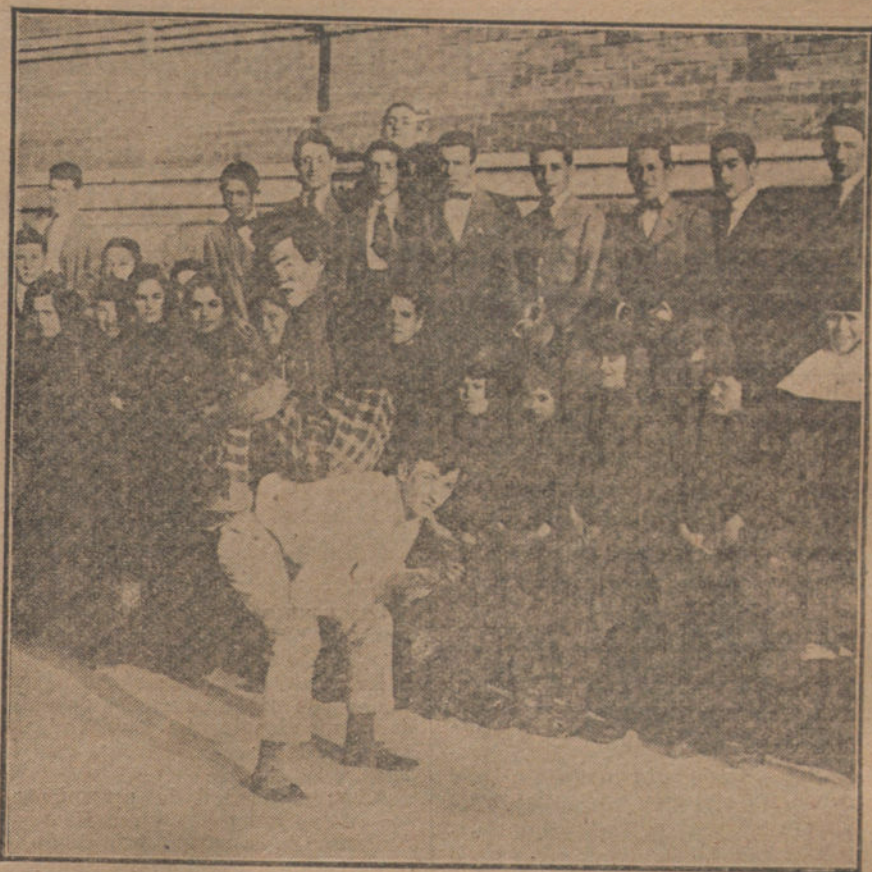
Un momento de los festejos celebrados ayer tarde en el Colegio de Anormales.