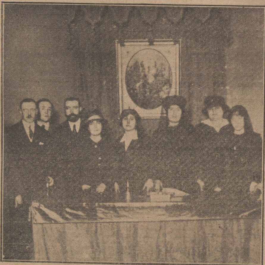
Asamblea de auxiliares de maestros normales, celebrada ayer en la Escuela Normal de Madrid

Orlando, Barzilay y el general Díaz pronunciaron alocuciones y luego se dirigieron a la Prefectura.—Radio.