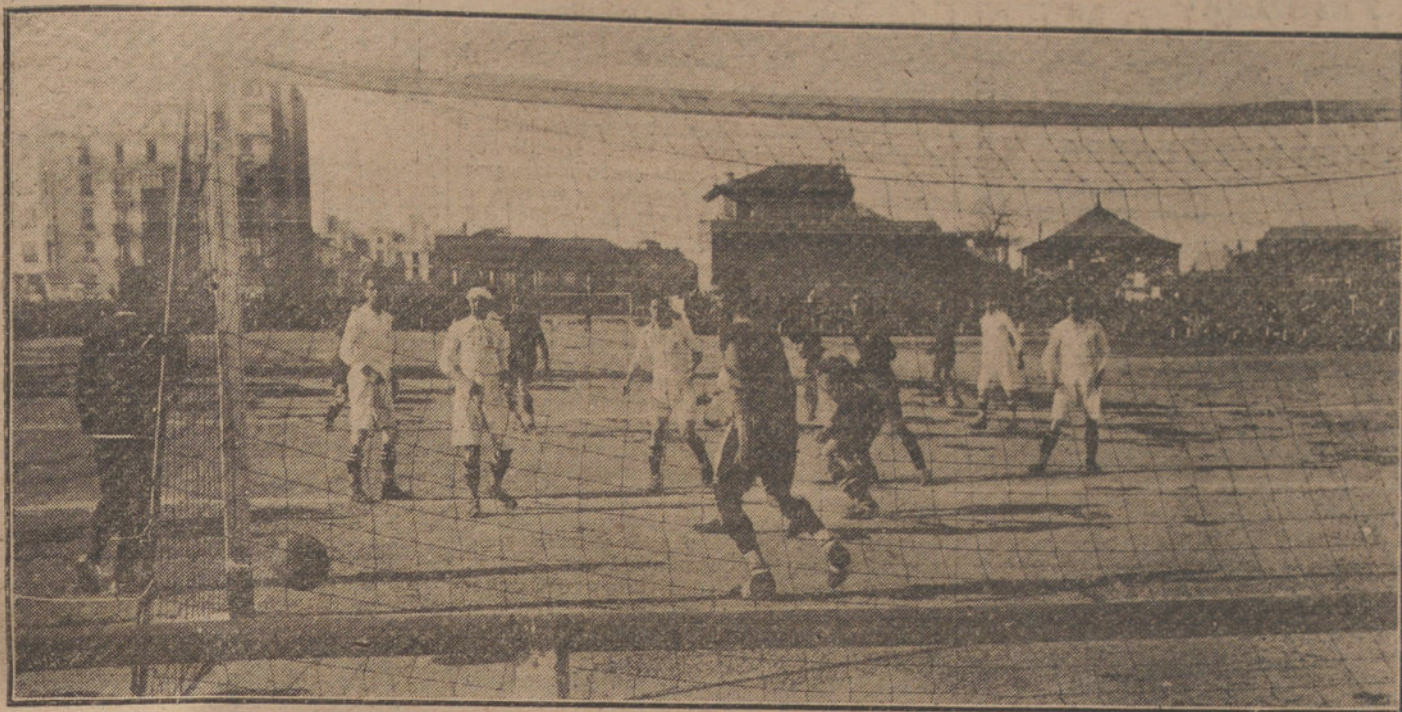
Momento de un «goal», hecho por el equipo de Barcelona, en el partido semifinal del campeonato de foot-ball, jugado ayer contra los de Sevilla.