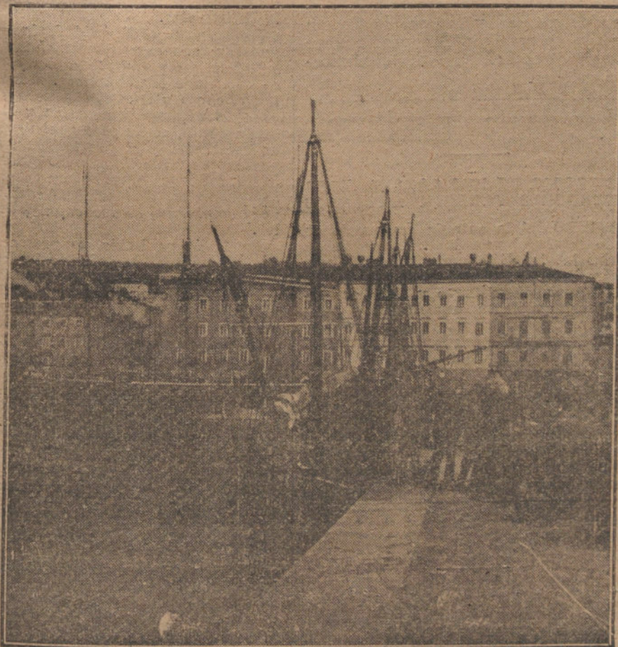
Un detalle del puerto de Fiume, capital cuya posición ha motivado las discrepancias de los italianos en la Conferencia de la paz.

Aunque nada se dice en esta nota de la cuestión de las Cortes, nos consta, y el propio Sr. Maura lo confirmó también anoche, que el Gobierno había deliberado sobre la apertura de las Cortes en relación con las impresiones que el presidente del Consejo había recogido en sus conferencias con los señores conde de Romanones, Alba y D. Melquiades Alvarez.