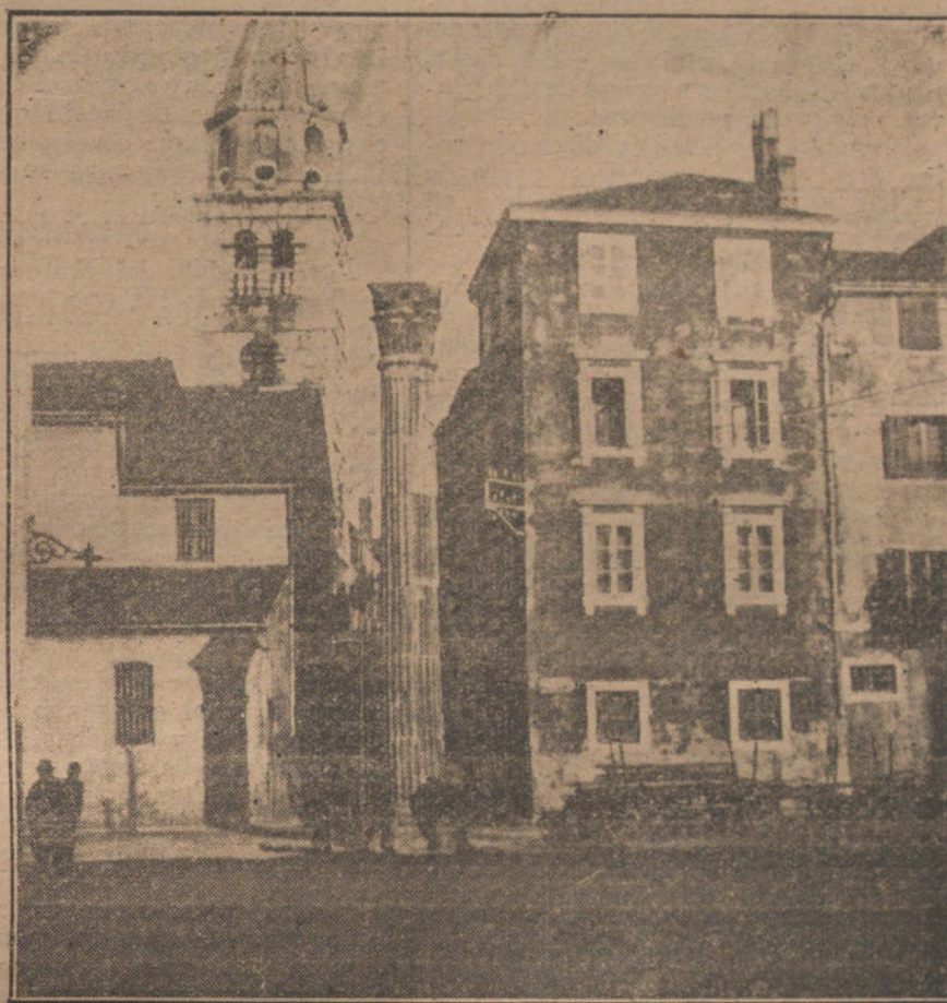
Plaza de la Columna, en Zara, ciudad de Dalmacia, que está siendo objeto de hondas polémicas en la Conferencia de la paz.

En nuestros cotidianos esfuerzos imaginativos seleccionábamos los orígenes de la crisis, sin encontrar más que esta poderosa verdad: Presupuestos.