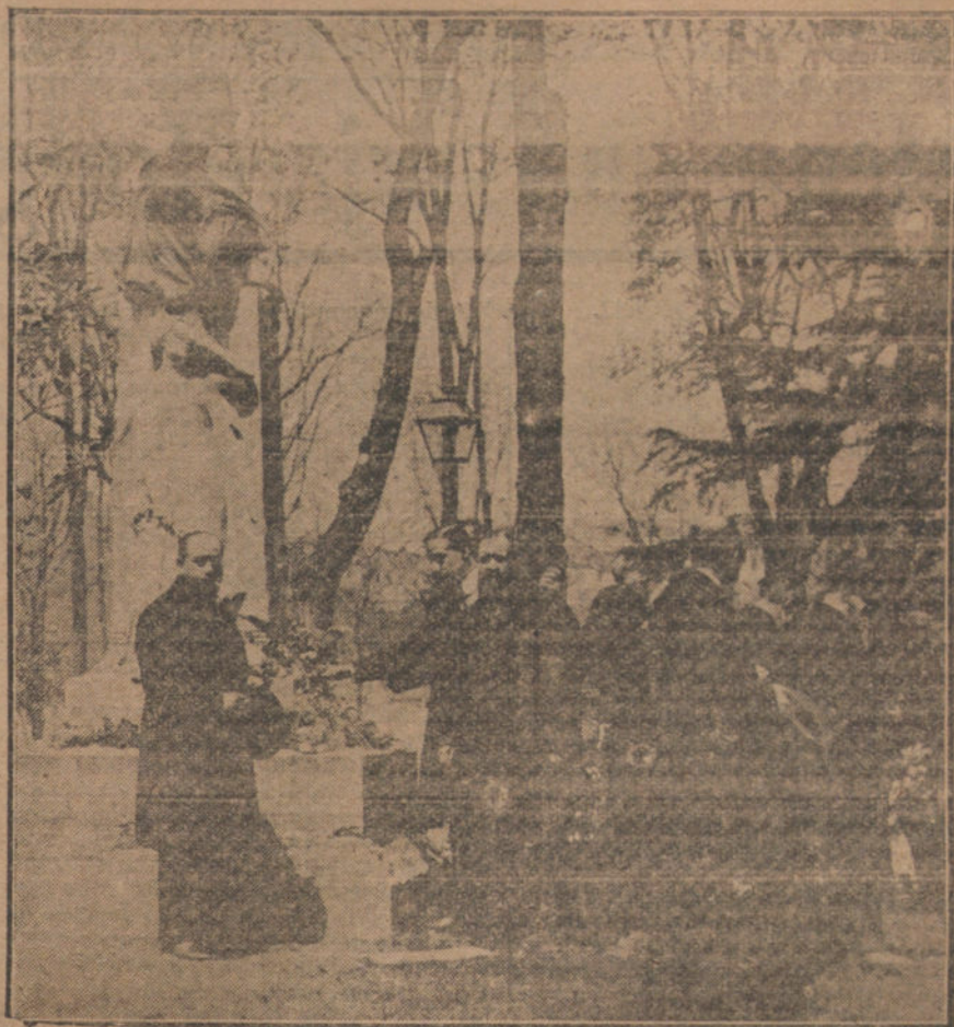
Médicos que fueron alumnos del ilustre doctor San Martín, depositando flores en su monumento, acto verificado esta mañana.

Quinto.—«Copioso». Belmonte lo saluda con unos lances de escaso lucimiento.