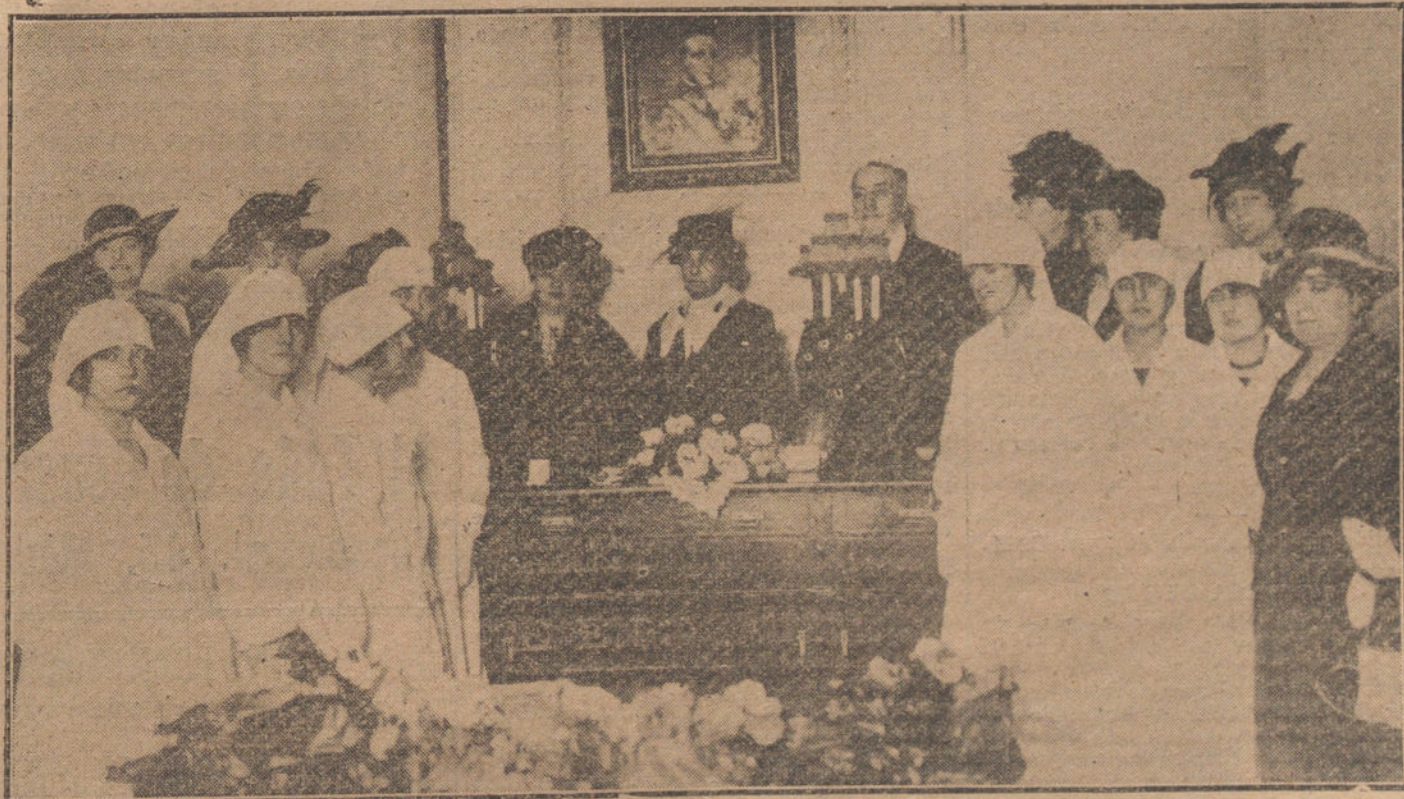
Reunión de la benéfica institución «Comité Femenino de Higiene Popular», para entregar las insignias de enfermeras a las señoritas sanitarias.

LEON. Hace mucho frío, a pesar de encontrarnos en primavera. La gente ha vuelto a sacar los abrigos. Ayer nevó durante todo el día.