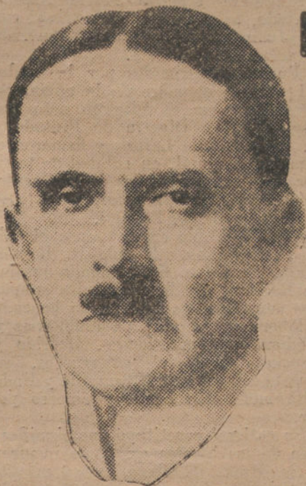
CONDE DE BROCKDORFF-RANTZAU, ministro de Negocios Extranjeros del actual Gobierno alemán.