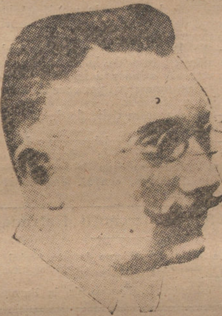
M. A. MUELLER, escritor y ministro de Baviera en Berna.