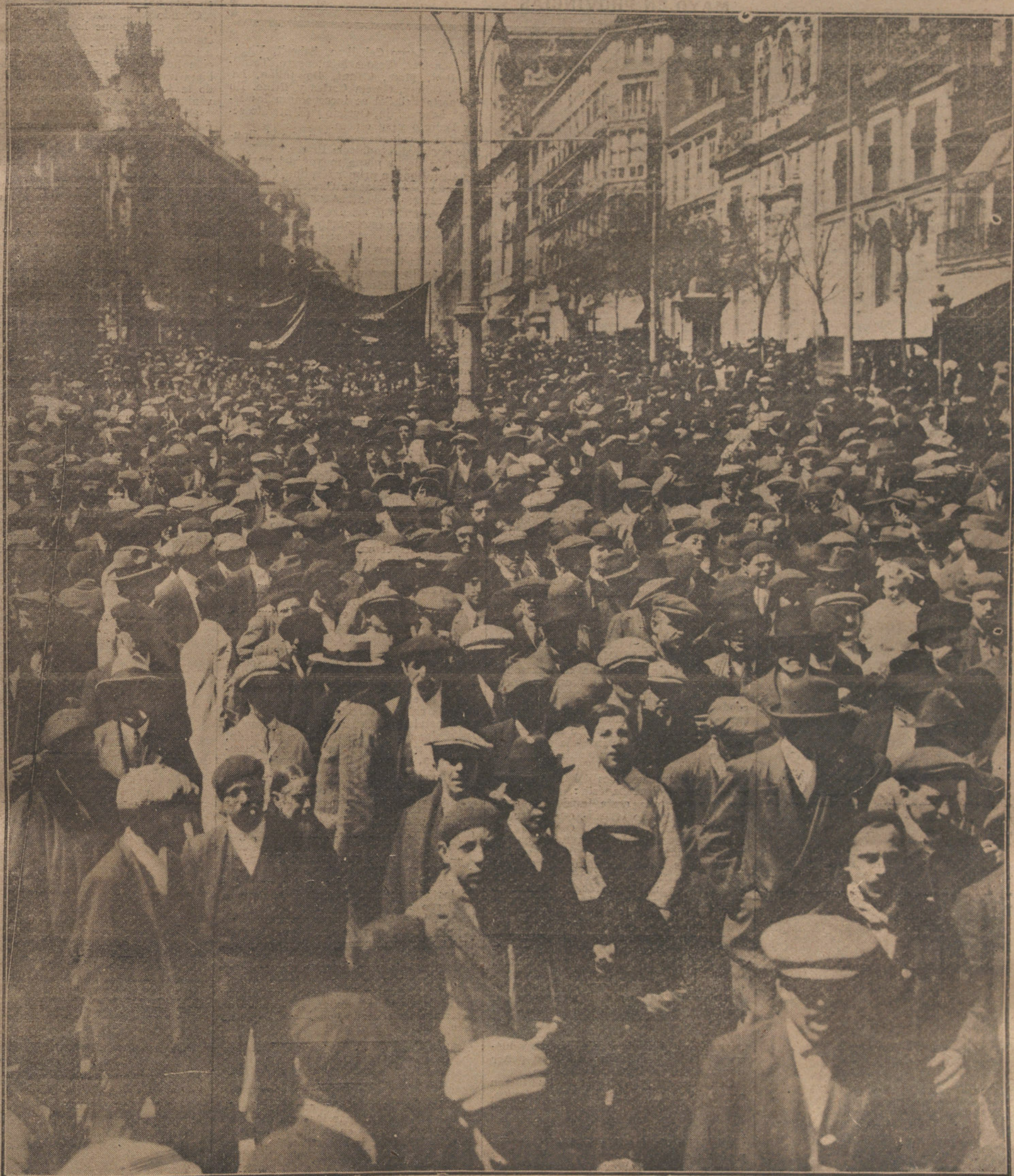
La manifestación obrera celebrada con motivo de la Fiesta del Trabajo, á su paso por la calle de Alcalá.