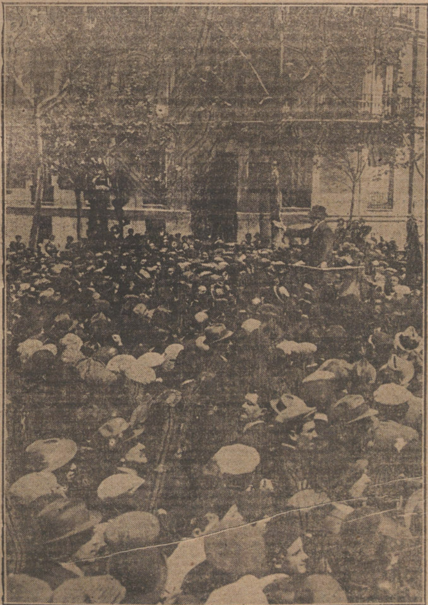
El diputado socialista Pablo Iglesias, dirigiéndose a los manifestantes, desde una de las tribunas levantadas en la plaza de la Independencia.

Después celebró el Consejo de Estado sesión ordinaria, presidida por el Sr. Maura.