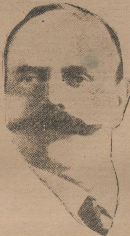
M. GIESBERTS, ministro del Tesoro y de Correos, en el actual Gobierno alemán.