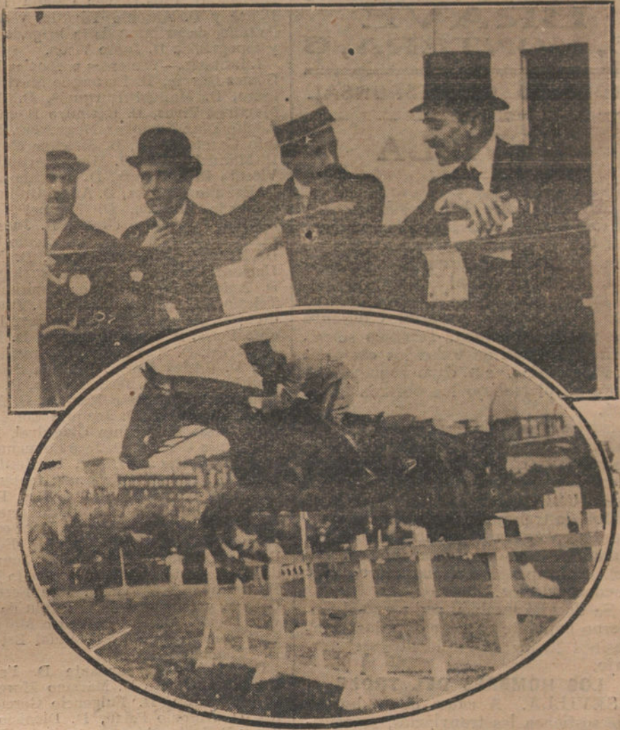
EL CONCURSO HIPICO.—Su Majestad el Rey, presenciando desde la tribuna regia las pruebas verificadas en el Hipódromo.

Porque repetimos que el desengaño nacional alcanza ya los límites de la paciencia, y, perdida ésta, á la opinión le va á dar lo mismo que se unan los conservadores ó que se desunen los li-