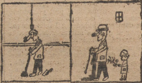
DOS RETRATOS DE MI CRIADO, por José Domínguez (ocho años).

ras, y por encima se le rocía de lo mismo, procurando introducirle bastante por las rajaduras, y se le pone mucho aceite, que casi los cubra; si el pescado es grande, se le pone una poquita agua, batida con aceite. Pueden ponerse alrededor ruedas de patatas.