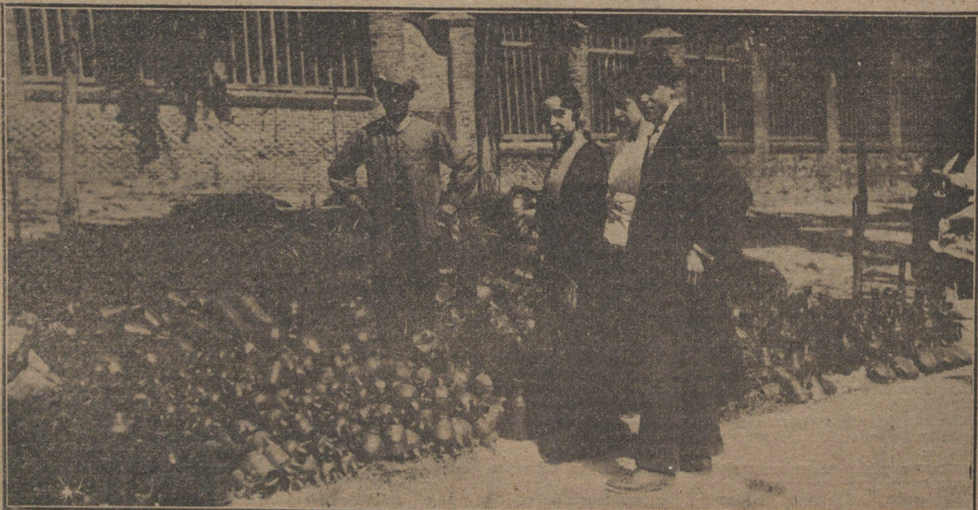
LAS FIESTAS DE MADRID.—Uno de los típicos puestos de «ca harro» en la Pradera de San Isidro.

El gobernador ofreció intervenir, para hallar una solución al conflicto.