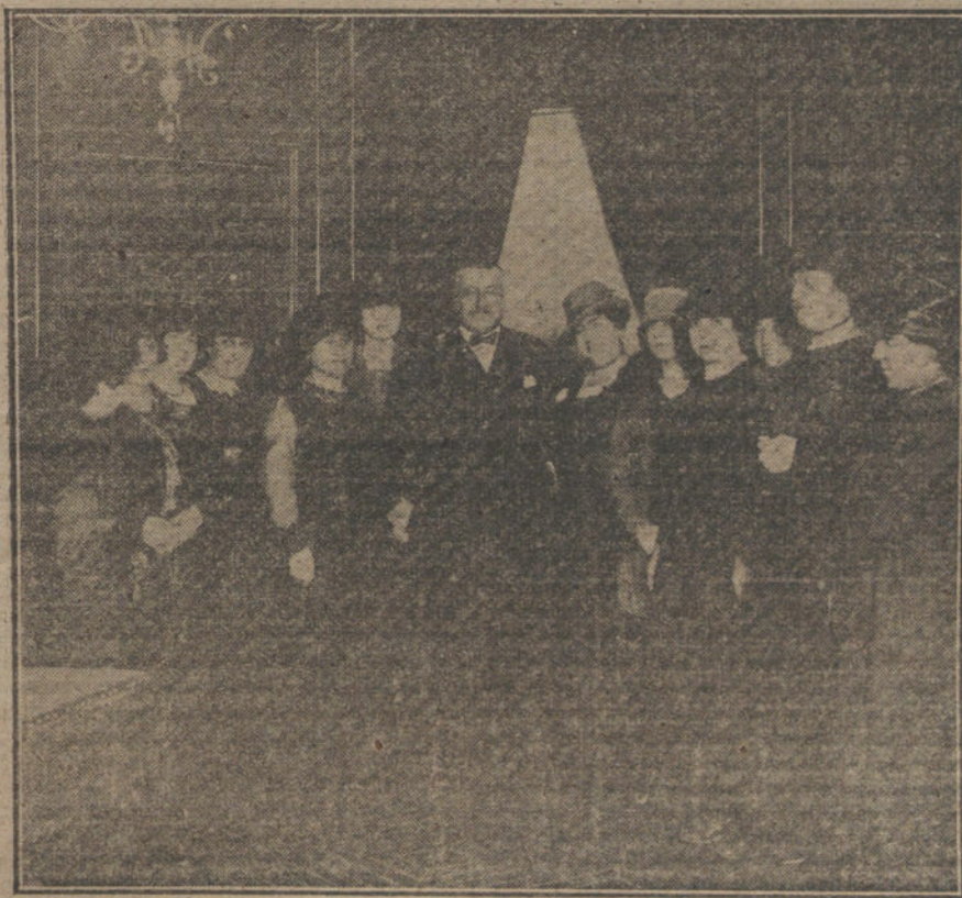
Inauguración del curso de Conferencias feministas, organizado por la Federación Internacional Feminina, en la Real Academia de Jurisprudencia.

El departamento de guerra ha entrado en conversaciones con los representantes de las cinco firmas más importantes de fabricación de conserva. Ha examinado con ellos los métodos que se deben emplear para poder utilizar el «stock» retirado, sin