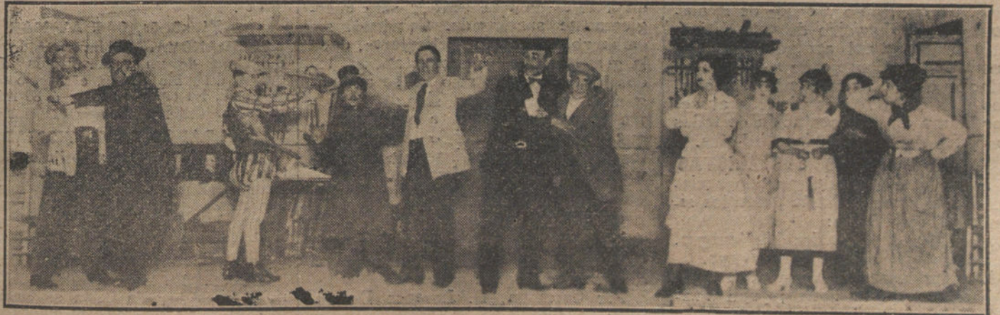
En la foto superior: Una escena de la obra «El rey del Fado», obra estrenada ayer en Novedades.