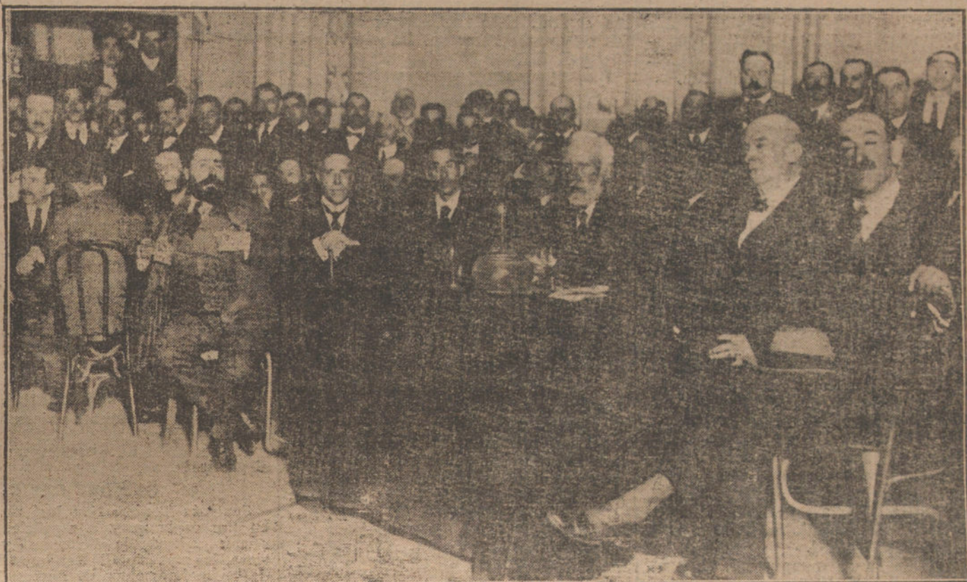
Presidencia del mitin de las izquierdas, celebrado esta mañana.

Esta mañana, a las diez y media, se ha celebrado en el teatro del Centro el mitin organizado por el Directorio de alianza de las izquierdas para iniciar la campaña electoral y presentar a los candidatos.