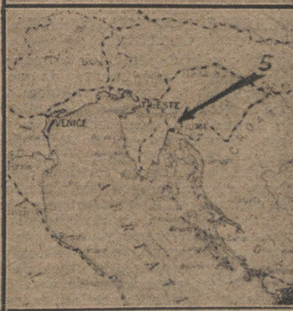
Número 1: Orlando y Sonnino, representantes de Italia en la Conferencia de la paz.—Número 2: Llegada de Orlando a Roma.—Número 3: El puerto de Fiume.—Número 4: Una calle de Fiume.—Núm. 5: Situación geográfica de Fiume.