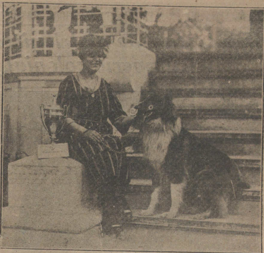
El perro «Kiriki», al que se ha concedido en la Exposición Canina el premio del Ayuntamiento.

El Sr. La Cierva decía ayer a los periodistas: «El ministro de Hacienda no debe ser político, tiene que ser neutral y desligado de la política, puesto que la Hacienda afecta a todos.»