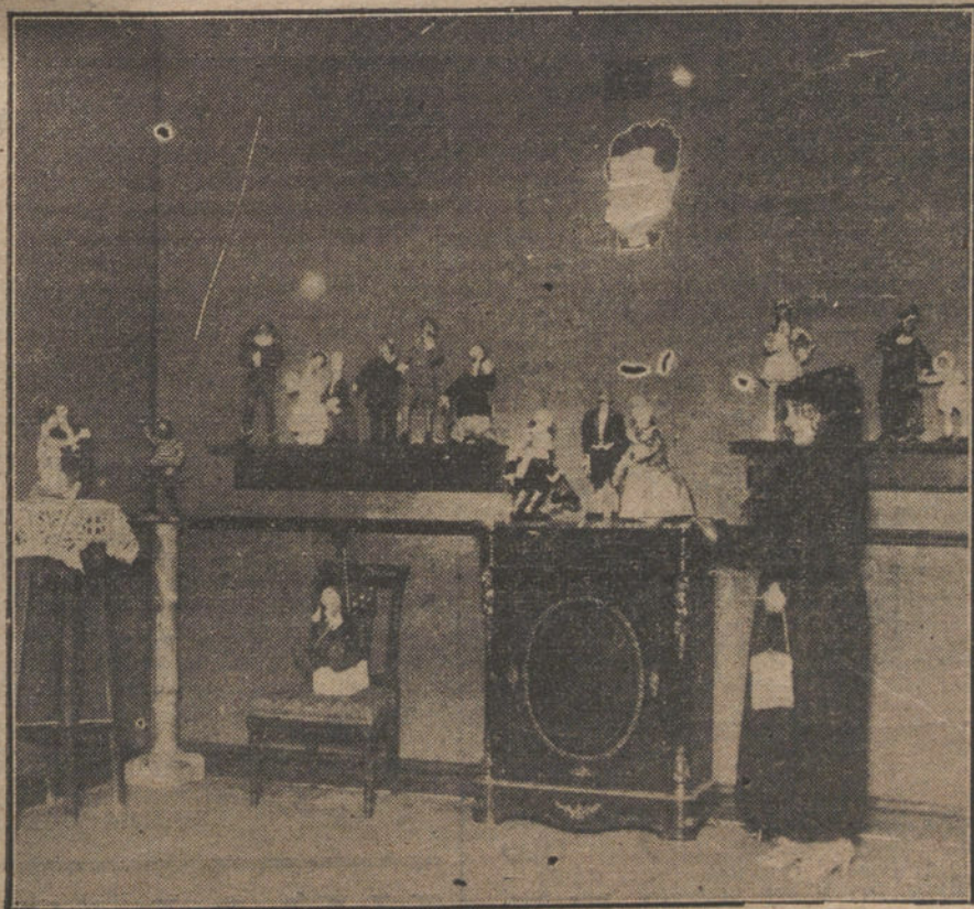
Un detalle de la notable Exposición de muñecos de trapo, de los «K. Hito. Gal. ván y Castillo, inaugurada ayer.

NUMERO DEL TELEFONO DE LA ADMINISTRACIÓN DE «LA TRIBUNA»: PLAZA DE CANALEJAS, 6, 25-51