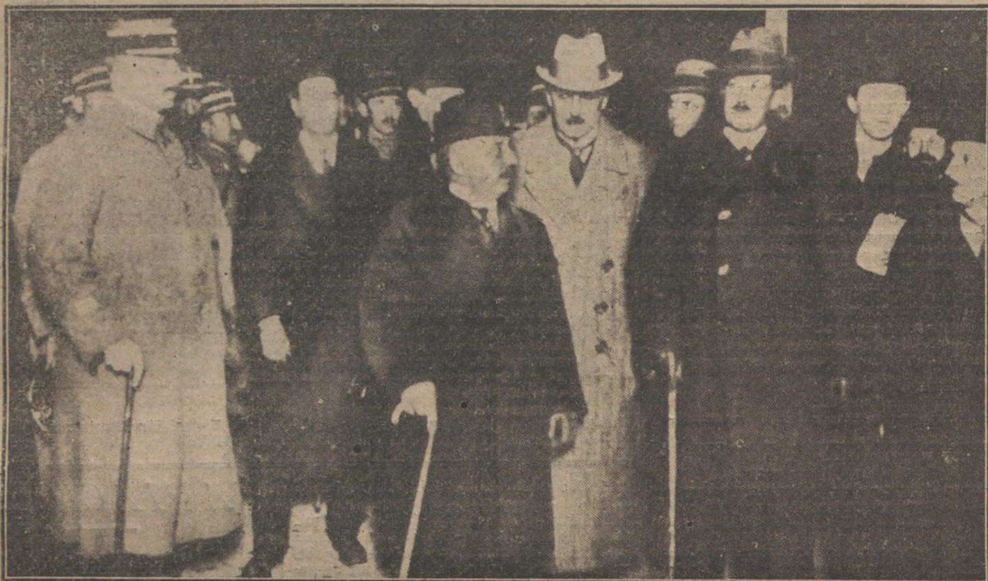
LA CONFERENCIA DE LA PAZ.—Los delegados alemanes, saliendo del Palacio de Versalles, después de la sesión solemne, en la cual les fueron entregadas las condiciones de paz.