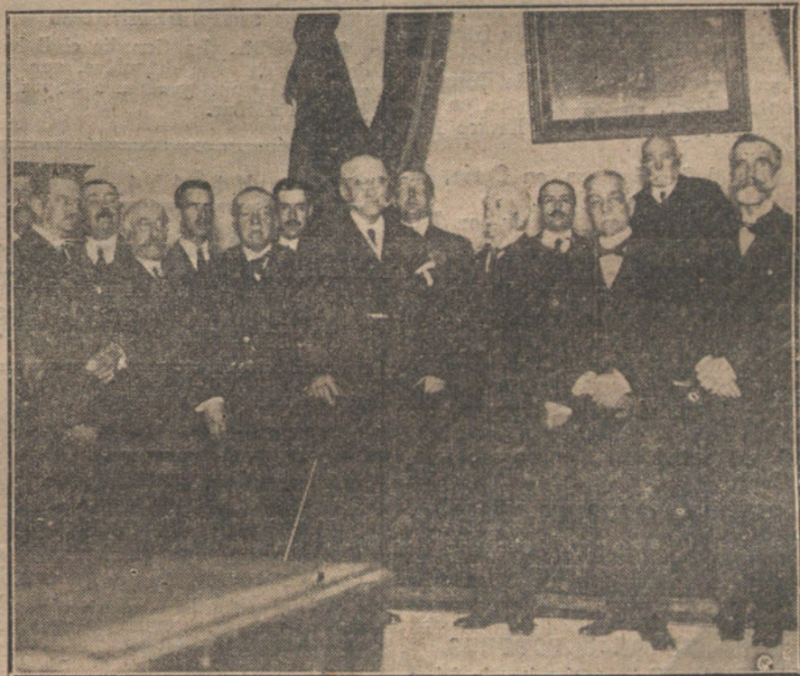
El ministro de Gracia y Justicia y el presidente del Tribunal Supremo, durante la visita que giraron ayer a la Audiencia.

«Excelentísimo señor: Subsistiendo las razones que motivaron la publicación del Real decreto vigente de esta