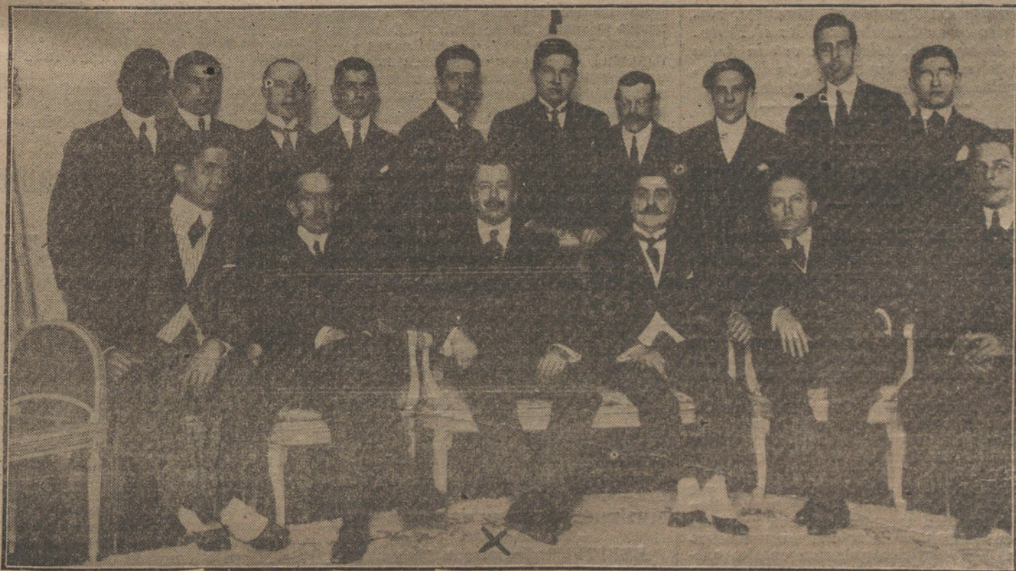
El ministro de Cuba (x), rodeado de la Colonia de su país, que han asistido a la fiesta dada con motivo del aniversario nacional de 20 de Mayo.