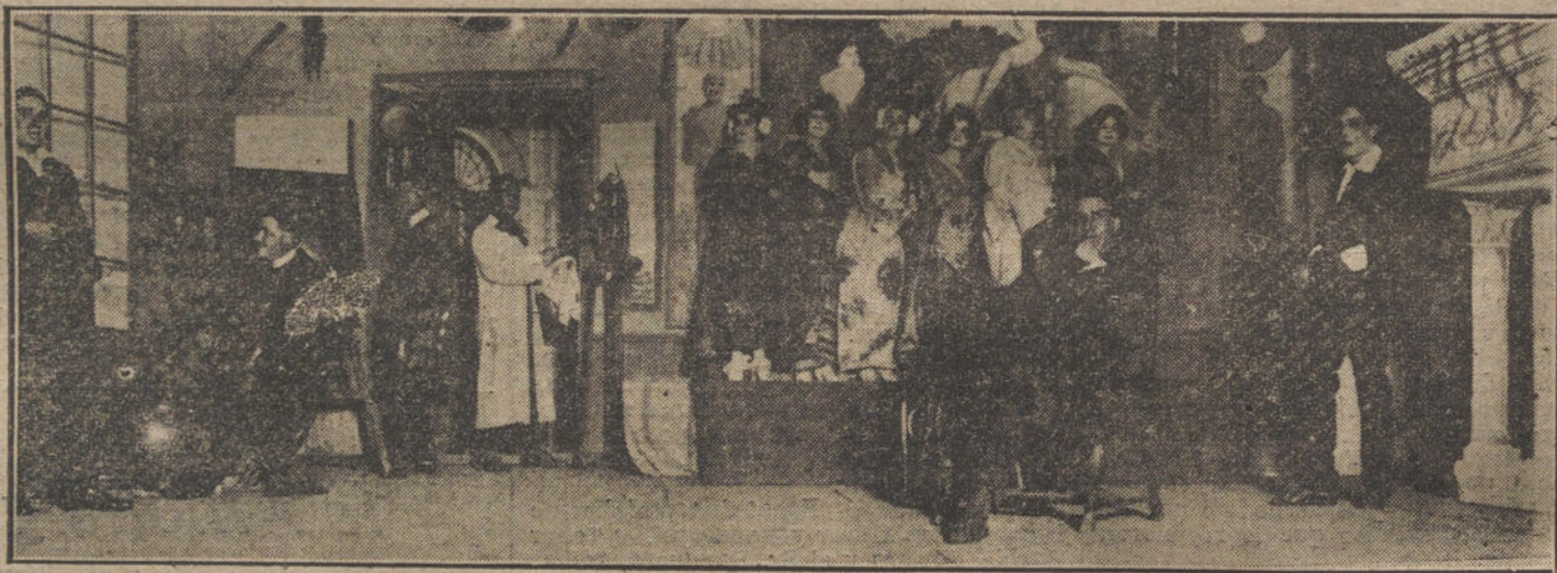
Una escena de la obra «La princesa Zingara», estrenada anoche en el teatro Español.