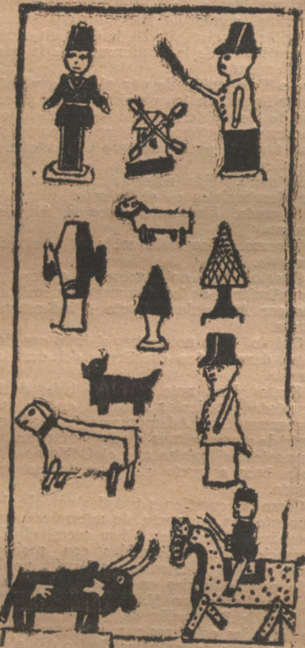
LOS JUGUETES DE MI HERMANO, por Luis de Castro (once años).