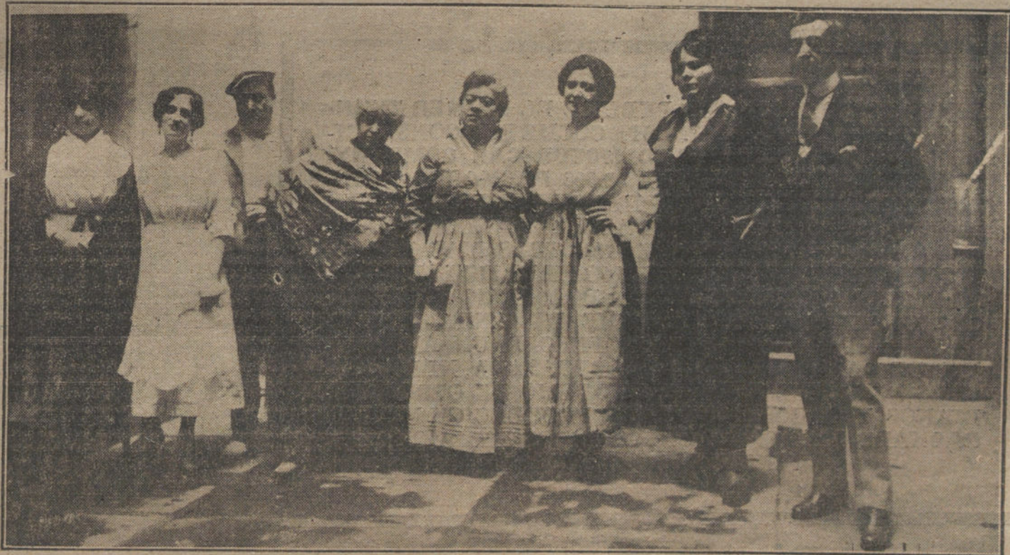
La compañía de Lara, que estrenó la obra de Antonio Casero, «La noche de la verbenas», en la fiesta del Sainete, celebrada ayer en el teatro de Apolo.