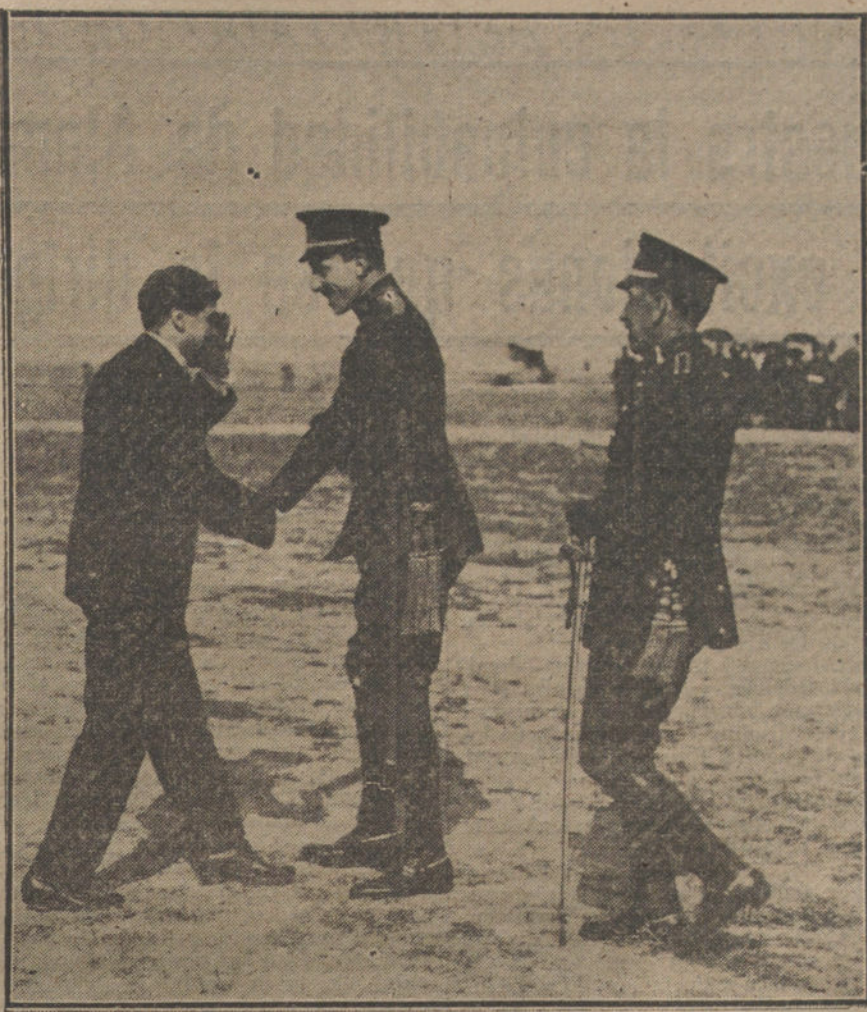
EN EL AERODROMO DE CUATRO VIENTOS.—Su Majestad el Rey felicitando al intrépido aviador O'Page, después de los arriesgados vuelos, verificados esta mañana.

Se conceden licencias por asuntos propios para Lisboa al coronel, capitán de Alabarderos D. Enrique Martínez, y para distintos puntos del extranjero al comandante de Estado Mayor D. Manuel Martí.