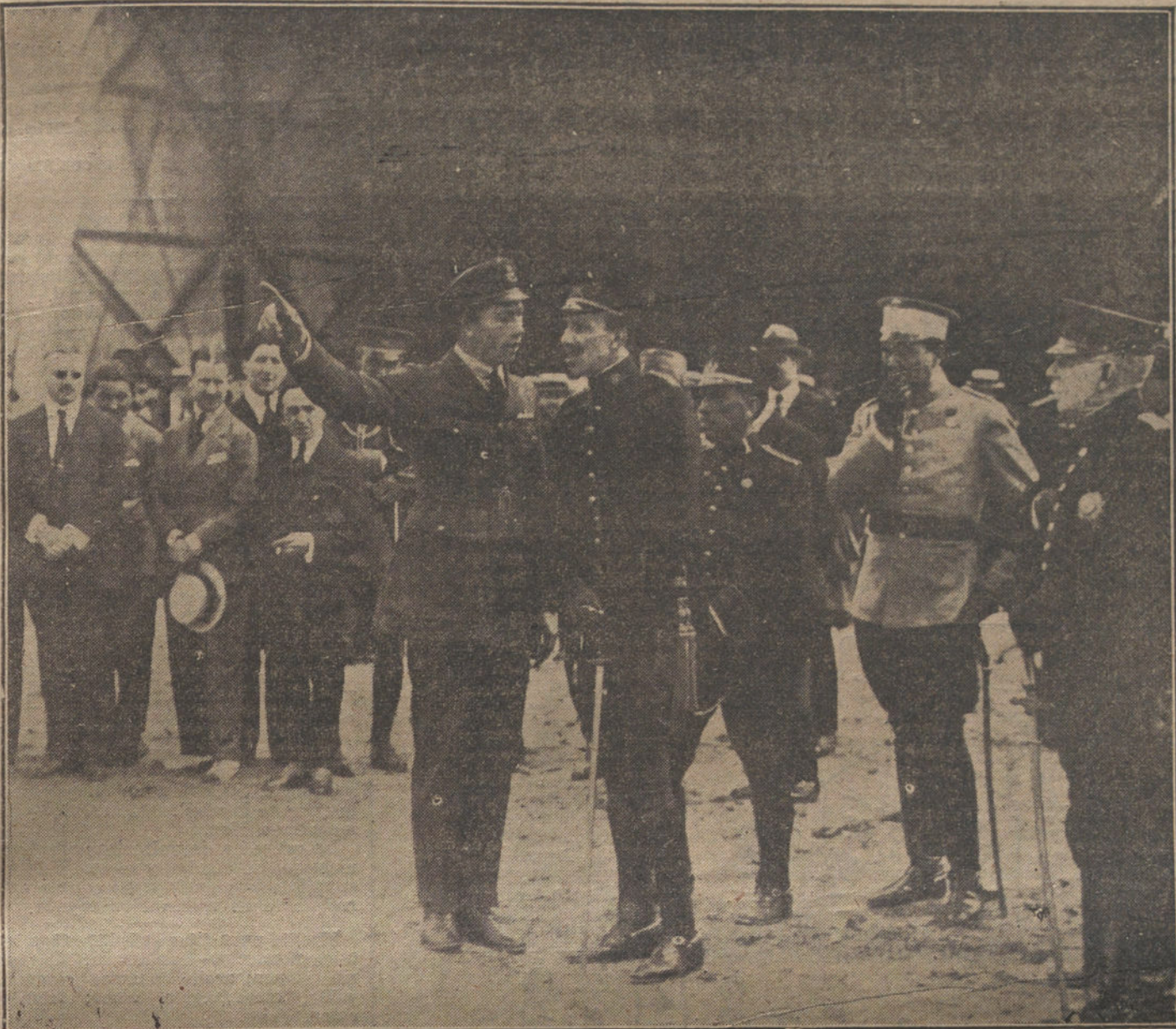
S. M. EL REY EN EL AERODROMO DE CUATRO VIENTOS. El comandante Mayne, del Ejército inglés, explicando a Soberano el funcionamiento del aparato «Handley-Page».

Law dijo que estas personas están sujetas al juicio de un Tribunal, formado según las disposiciones del Tratado de paz.—Radio.