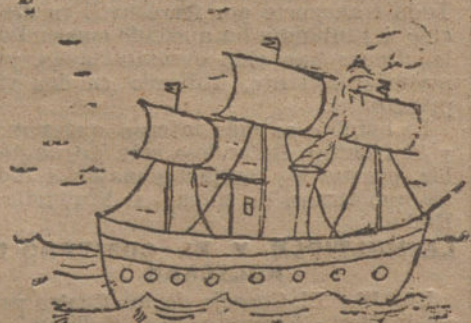
YATE DE RECREO, por A. Correig Massó (nueve años).