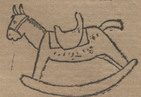
MI CABALLO BABIECA, por Juanito Jiménez Vargas (cinco años).