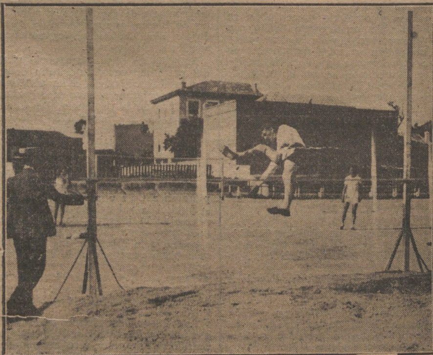
Uno de los momentos más interesantes del festival de juegos olímpicos, verificados ayer en el campo del Athletic.

Lo mismo que en el caso de Alemania, no se permitirá a Austria la posesión de