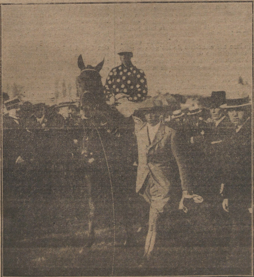
LAS CARRERAS DE CABALLOS.—«Auvin», caballo del conde de la Cigera, que ganó el premio «Teddy», corrido ayer.

El padre de la víctima, que es guarda municipal, se hallaba de servicio en la Casa de Socorro, a la cual fue conducido el cadáver del niño, y al ver a su hijo sufrió una excitación nerviosa agudísima, y cogiendo un revólver quiso agredir al conductor del automóvil.