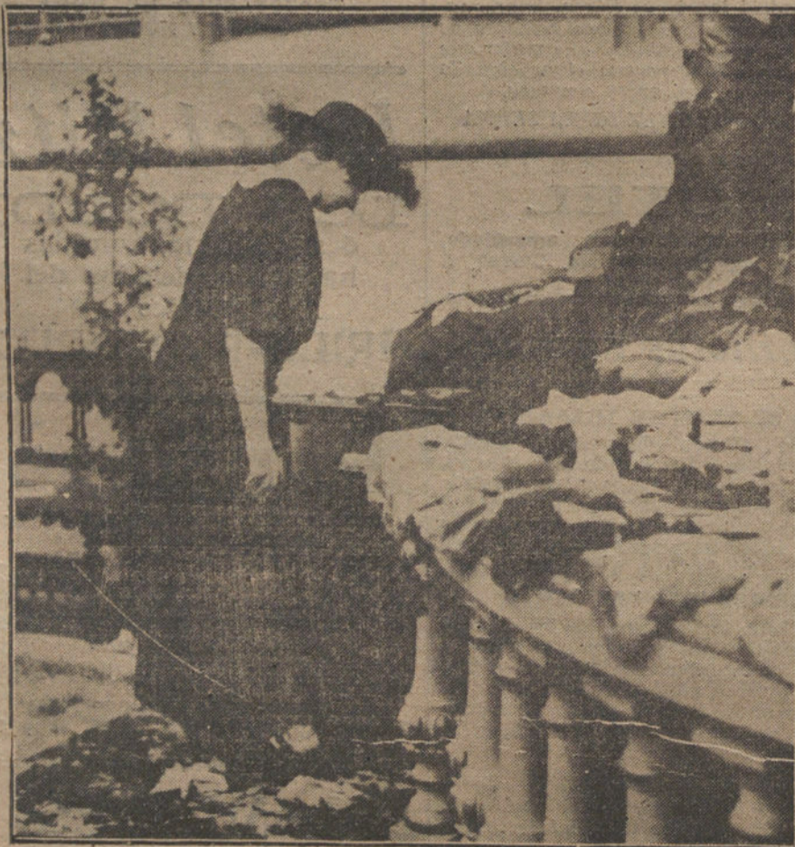
Su Majestad la Reina Victoria, viendo los lotes de ropa que se regalan a las Sociedades obreras, con lo recaudado en la fiesta benéfica celebrada ayer tarde en los jardines de la Biblioteca Nacional.

Referente a la contestación de la jefatura de los socialistas independientes alemanes al radiograma de Tschicherin sobre una ayuda rusa para el pueblo alemán frente a las condiciones de paz manifestada la Prensa burguesa de Berlín que no reina un acuerdo seguro entre los gobernantes bolchevikis rusos y los independientes alemanes, a pesar de este saludo fraternal, porque los comunistas alemanes que tienen