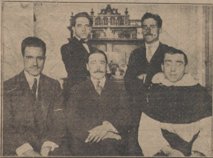
El maestro Turina con sus discípulos.

Desde la altura de su azotea, florcida por los cuidados de la familia sevillana, que atiende con nostálgica predilección a su artificioso jardín, divisamos un horizonte ilimitado, que nos presenta el verdadero sentido que unifica en la idea su preta la diversidad de mediatas finalidades, que pudiéramos decir de servidumbre.