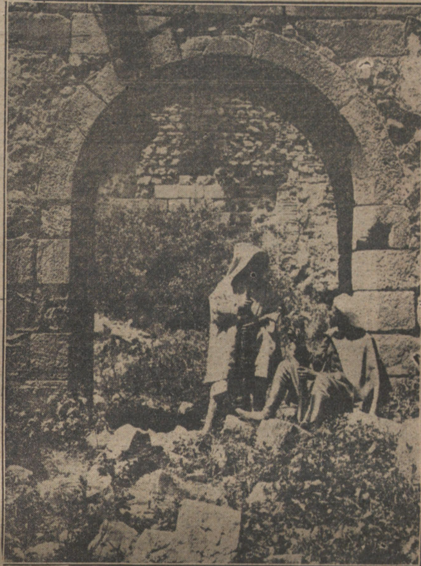
Una de las puertas de entrada al histórico patio del castillo de Alcazarzeguir.

Durante la dominación árabe gozó Alcazarzeguir un altísimo grado de prosperidad. Su valle sirvió de cauce a la arrolladora invasión de Musa Ben Noseir. De su playa partieron las naves que conducían a los guerreros berberiscos de Tarik Ben Zeiad a la conquista victoriosa de Tarifa. Y a su playa volvieron con el glorioso botín recogido en la favorable expedición. Y, esclavas ya del poderío árabe las