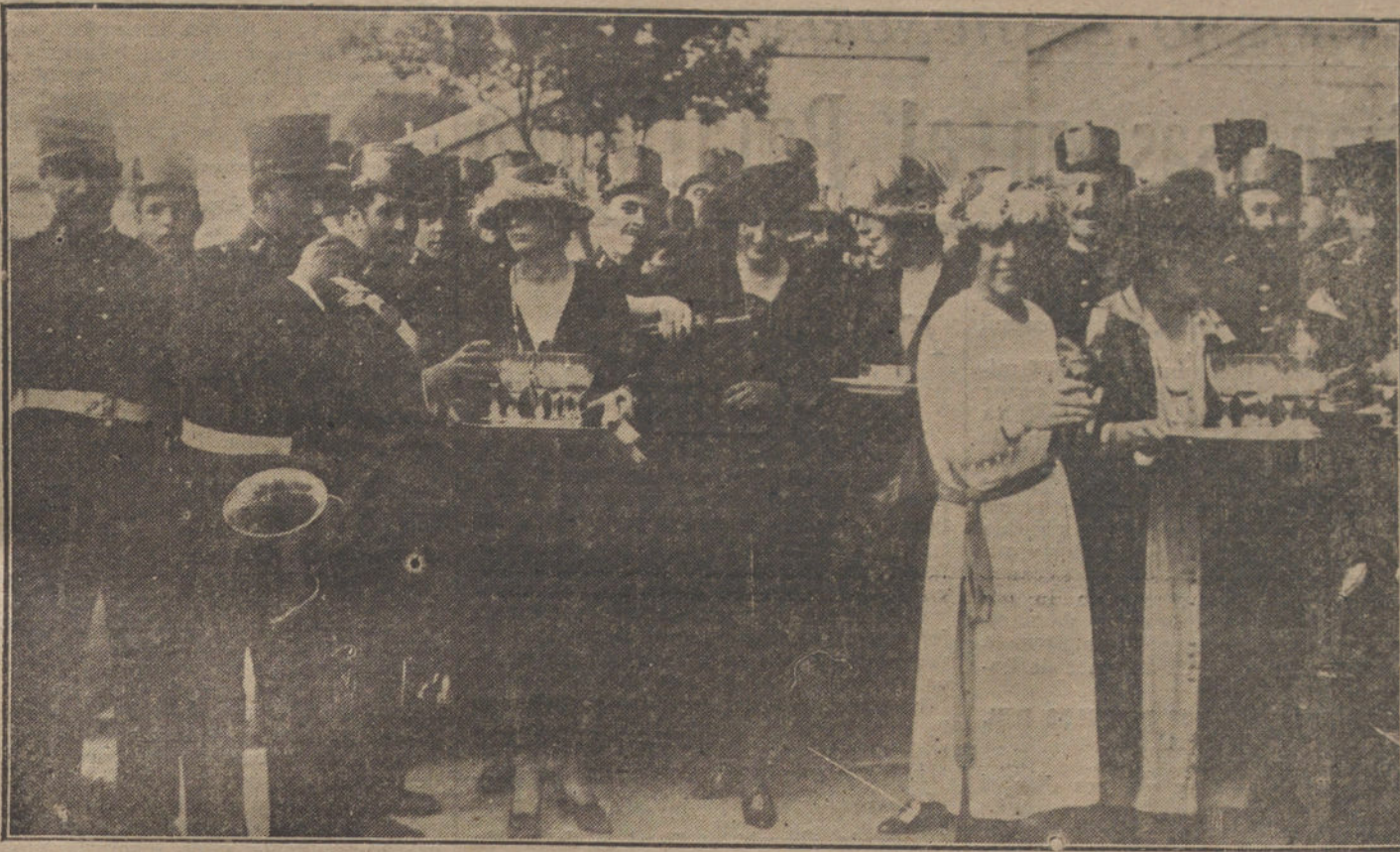
Señoritas de la aristocracia, ofreciendo refrescos a los músicos que tomaron parte en la fiesta benéfica, celebrada ayer en los jardines de la Biblioteca.