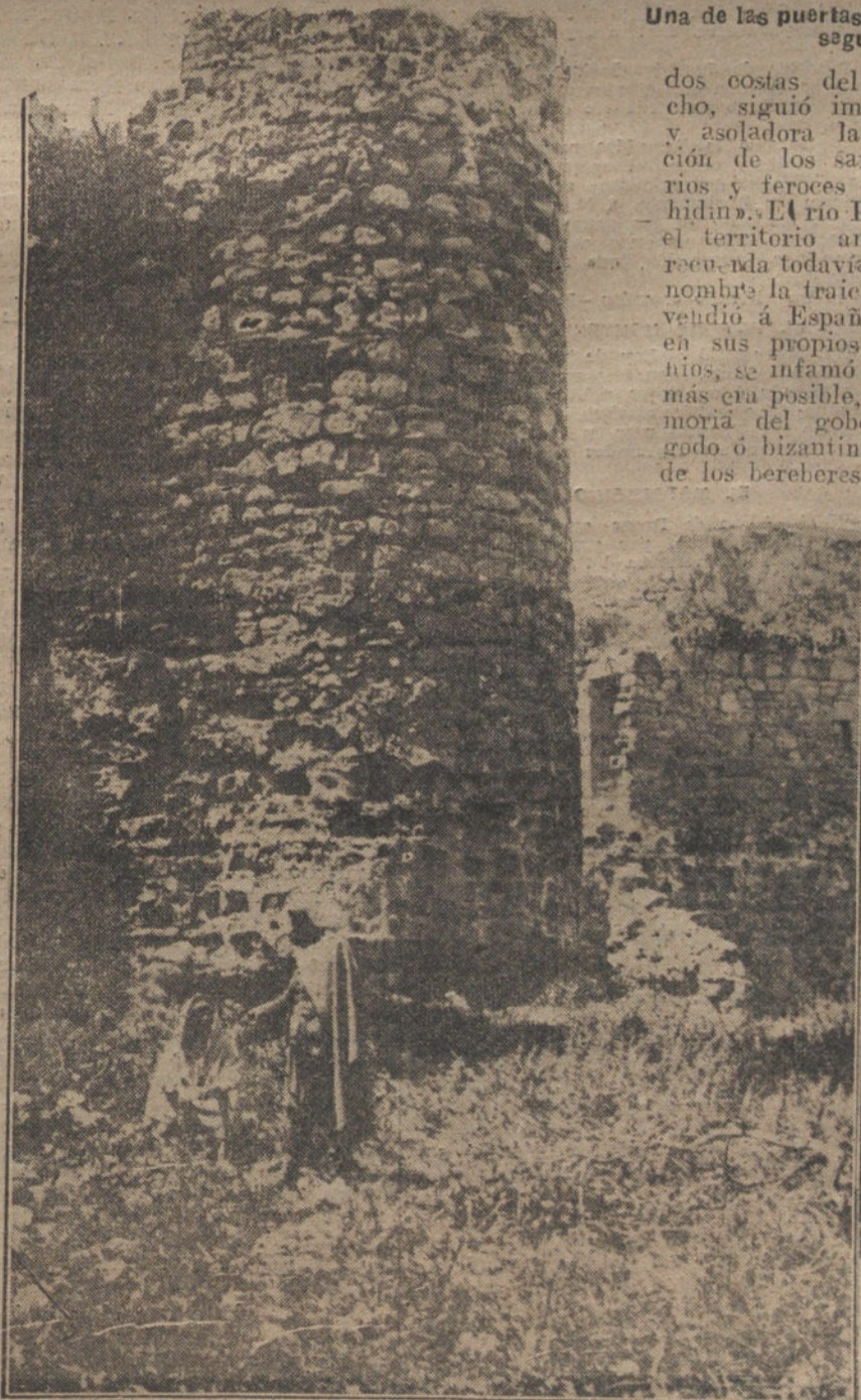
Uno de los famosos torreones de la quinta construida por Jakub Almazmor, cuarto Rey de los Mahometas, en Alcazarzeguir.

«El autor árabe Ez-Zia'i — dice «Muley Hak» — hace remontar la construcción de El Ksar a la época en la cual Tarik ben Ziad tomó Tánger (708-709 J. C., 90 del hégira), atribuyendo la fundación de la ciudad al Príncipe de los Masmuda que en esa época era el famoso donde Yulian, gobernador Bizantino de la región.»