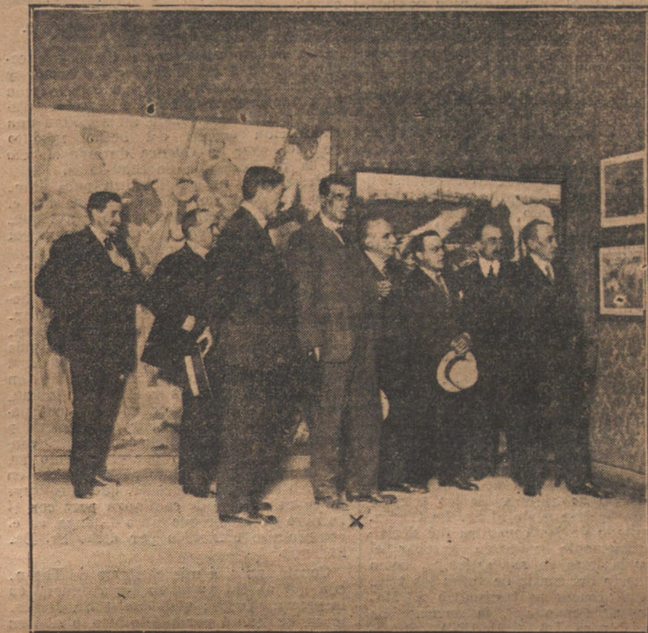
Un detalle de la Exposición Iturrino (x), inaugurada ayer en el salón del Circulo de Bellas Artes.

Vuelve a Madrid dolorido, lleno de vergüenza, apenado ante el panorama que ofrecen esos electores, que con el oro del candidato ministerial cubren el desdoro de su falta. Y nos lo cuenta ayer con sentidas palabras, llenas de emoción. No se puede, ni se debe, entablar un pugilato de dinero. ¿Hay un postor que paga bien el acta y un Gobierno que ampara ese comercio? Pues que se lleven el censo en buena hora y que fabriquen una mayoría artificial. Todo ello ha de servir para redondear el prestigio de los hombres públicos que con tanta impudicia asaltaron el Poder, valiéndose de la anor-