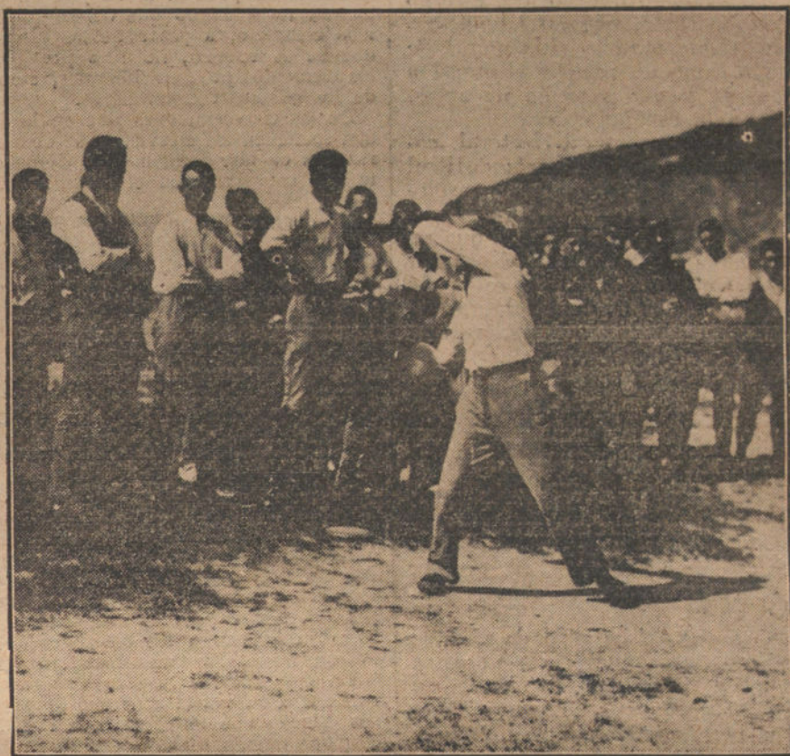
Un momento de las interesantes fiestas deportivas celebradas en San Sebastián por los soldados del regimiento de Sicilia.

«¿Cuál es la condición del ciudadano español? Yo no hablo de la condición teórica y legal, porque esa es espléndida; por todas partes recursos, garantías y amparos. En realidad, el