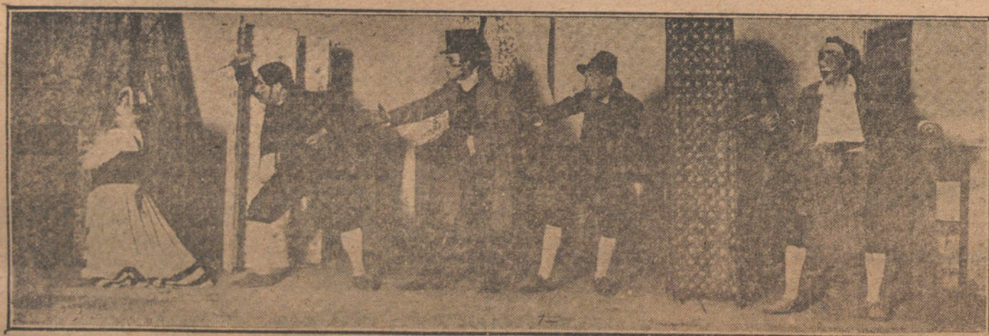
Una escena de la obra «Zerlina», estrenada ayer en el teatro de Novedades.

Después de asistida en la Casa de Socorro, pasó á su domicilio, calle de Trafalgar, núm. 36.