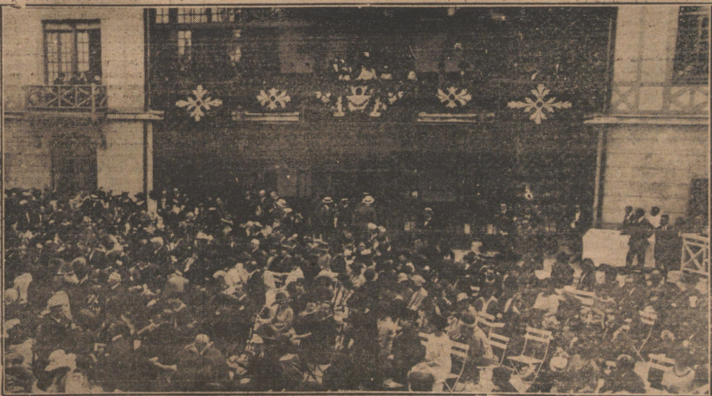
SS. MM. los Reyes presenciando la fiesta benéfica celebrada ayer tarde en Parisiana.

La fiscalización es la mitad de la vida parlamentaria, es la presencia del ciudadano en la gestión delante de la obra de los Gobiernos; pero la fiscalización está influida por las mismas causas, y lo que no se hace responde de tal manera a esto, que más de una vez quien necesita enterarse es la fiscalización, y como todo el mundo sabe las causas de las cosas y el por qué de las actitudes, resulta que una Cámara organizada para ser una representación de contrapuestas colectividades políticas, de ideas tendenciosas, y aun pasiones, no es nada de eso; antes recuerda esas comedias de aficionados que se organizan en las tertulias, en las que de puro estar todos en el secreto, ninguna representación logra eclipsar el nombre ó el apodo del representante. No hay si no ver la actitud del pueblo español cuando se abren las Cortes ó se cierran. ¿Habéis advertido vosotros ningún movimiento de esperanza ó algún desconsuelo por la clausura? ¿Hasta hay quienes creen que con esta gana la seriedad?