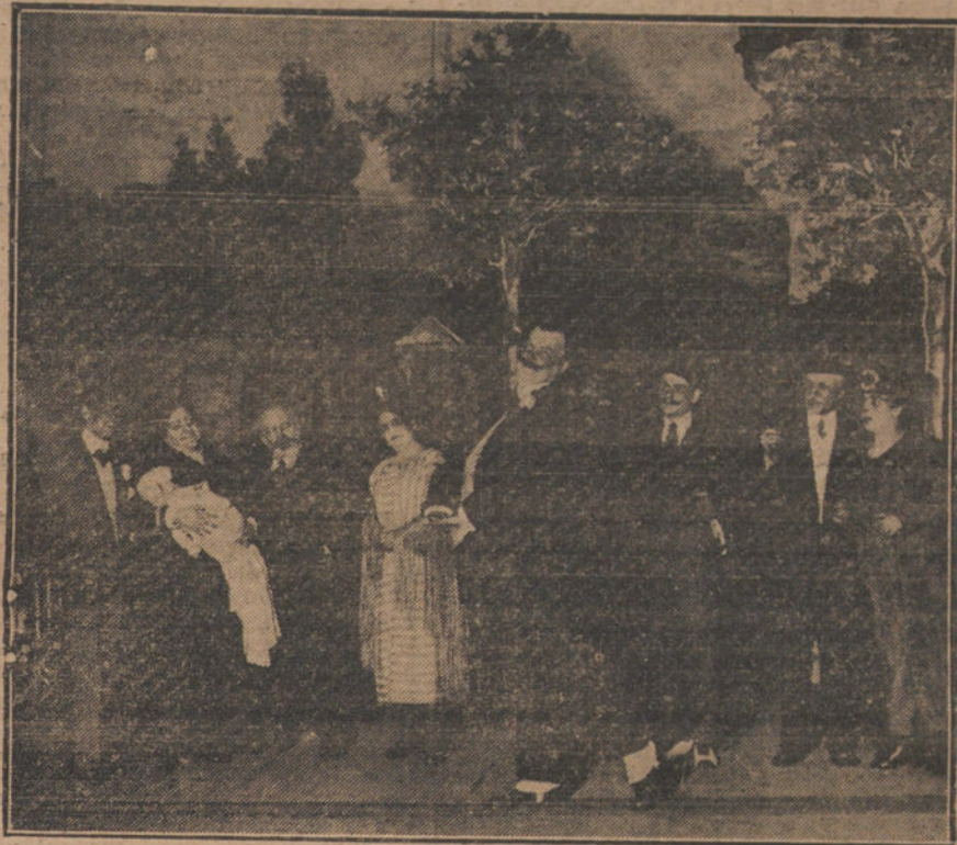
Una escena del sainete «La flor del barrio», estrenado anoche en el teatro de Apolo.

corruptor del país? El Sr. Maura, solo, hubiera sacado de las urnas una compacta mayoría, su mayoría verdad, mayoría honrada, no arrancada al sufragio con procedimientos abominables. Con el Sr. Maura estaban todos los buenos españoles, seguros de que a su mano vendría la regeneración. No hacían falta organizaciones de Comités,