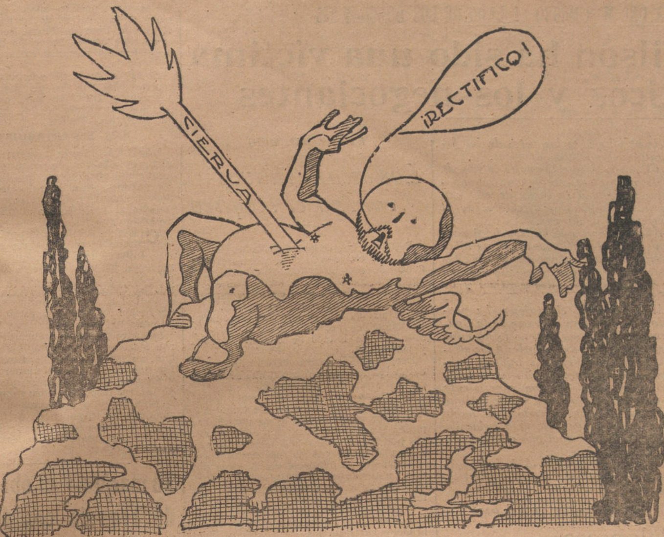
OSSORIO, SI. GALLARDO, NO El Angel caído.

Sus señales radiotelegráficas, muy buenas.—T. S. H.