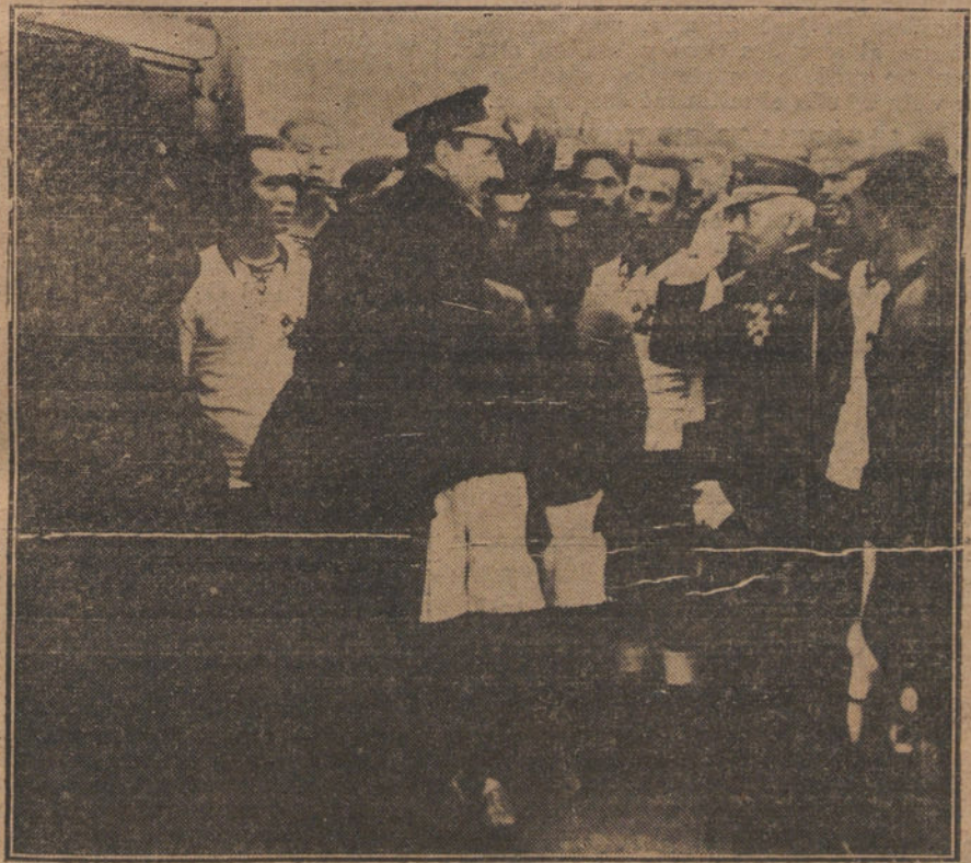
Su Majestad el Rey conversando con los soldados que tomaron parte en el partido de «foot-ball», celebrado ayer tarde.

ni cepos, ni trampas, ni redes, ni artimañas, ni maniobras, para que esa opinión se manifestara libremente. En otros instantes menos decisivos la tuvo de su parte con sólo requerirla. Hubiera sucedido lo mismo de presentarse el Sr. Maura con toda la holgura con que se presentó en los mítines del Real y la Plaza de Toros. Ha preferido, no obstante, venir al Poder ligado a los compromisos funestos del Sr. La Cierva. Se entregó a él, y le ofreció en un feo contubernio cuanto antes defendía, para que el político murciano, con su no disimulada desaprensión, plantase este tinglado de feria, donde todo ha sido adquisiciones a precios fabulosos, chanchullos y atropellos de las peores consecuencias. Porque puede acontecer además que, con tanta osadía, los propósitos del Gobierno no queden satisfechos mañana.