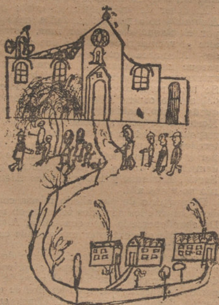
LA IGLESIA DE FUENTES, por Alberto Thierry (once años).

Pintura realista: —¿Ha estado usted en la Exposición de pinturas?