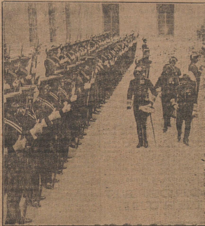
Su Majestad el Rey, revistando las fuerzas de Alabarderos, antes del almuerzo con que ha sido obsequiado esta mañana por la oficialidad del citado real Cuerpo.