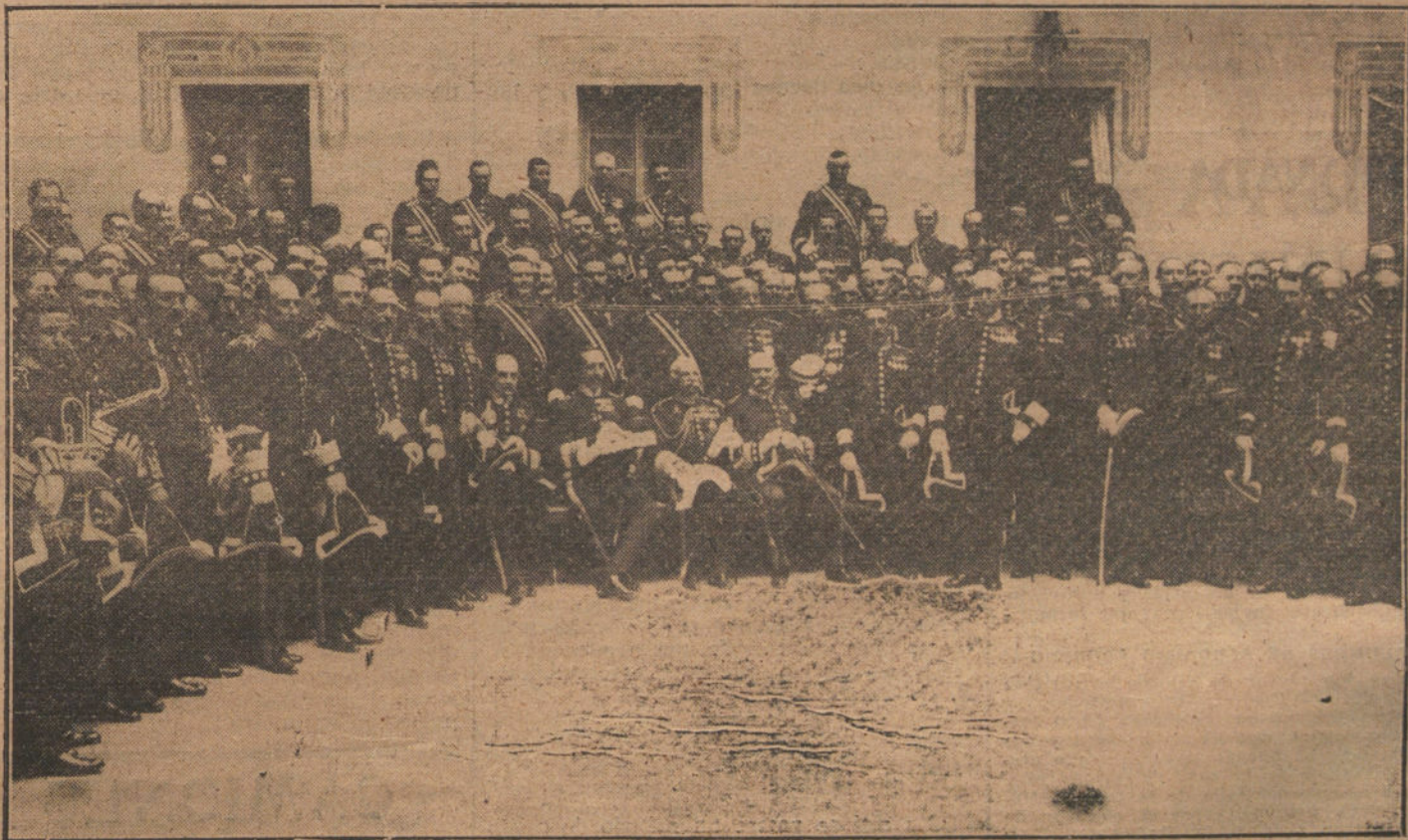
Su Majestad el Rey, rodeado de los jefes, oficiales e individuos del Cuerpo de Alabarderos, después de la visita que les hizo ayer.