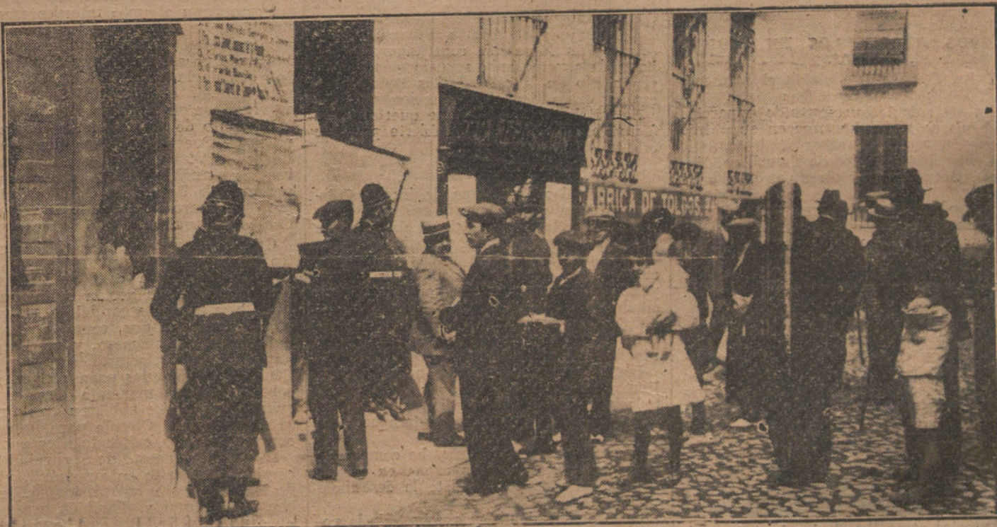
Aspecto de la puerta de un Colegio electoral del distrito de la Latina, durante la mañana de hoy.

Hoy se recogerá la pródiga cosecha. Más de los treinta dineros que percibió Judas por la venta de Cristo, costará a la nación la compra del maurismo. Se ha despilarrado el presupuesto con ampliación de plantillas, aumen-