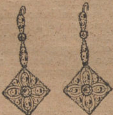
Núm. 1.—Cuatro brillantes y diamantes. Ptas. 200.

CON BRILLANTES DE PRIMERA CALIDAD DIAMANTES ROSAS DE HOLANDA MONTURAS DE PLATINO FINO Y ORO DE LEY 18 QUIATES CONTRASTADO