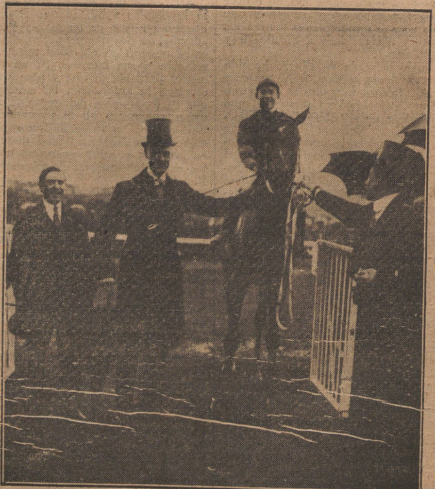
El conde de la Gimera y el marqués de Martorell con su caballo «Nouvel an», ganó el Gran Premio en las carreras de ayer.

SANTANDER. Se espera, procedente de Inglaterra, un vapor con cargamento de patatas, el cual ha sido adquirido por el ministro de Abastecimientos.