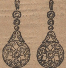
Núm. 4.—Dos brillantes y diamantes. Ptas. 275.