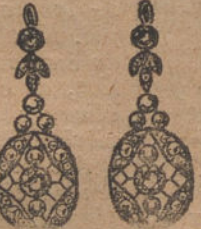
Núm. 7.—Seis brillantes y diamantes. Ptas. 350.