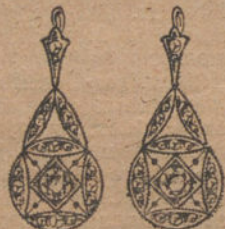
Núm. 5.—Dos brillantes y diamantes. Ptas. 300.