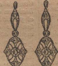
Núm. 3.—Cuatro brillantes y diamantes. Ptas. 250.