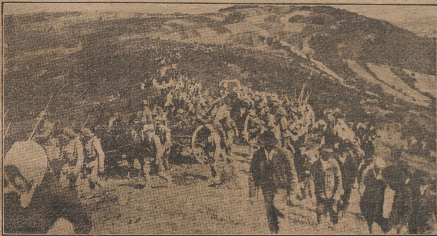
EN LOS NUEVOS ESTADOS.—Entierro del ministro de la Guerra checoslovaco, víctima de un accidente de aviación. (Fotografía ILLUSTRATION.)