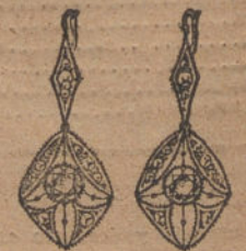
Núm. 8.—Cuatro brillantes y diamantes. Ptas. 375.