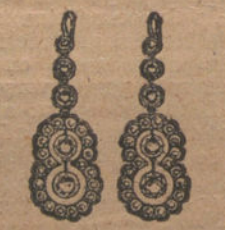
Núm. 9.—Diez brillantes y diamantes. Ptas. 400.