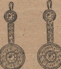
Núm. 6.—Cuatro brillantes y diamantes. Ptas. 325.