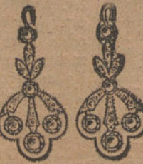
Núm. 11.—Diez brillantes y diamantes. Ptas. 500.