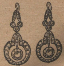
Núm. 12.—Ocho brillantes y diamantes. Ptas. 625.