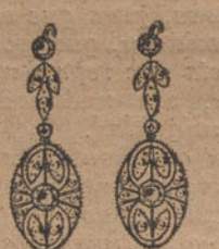
Núm. 2.—Cuatro brillantes y diamantes. Ptas. 225.