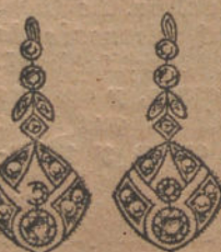
Núm. 10.—Ocho brillantes y diamantes. Ptas. 450.