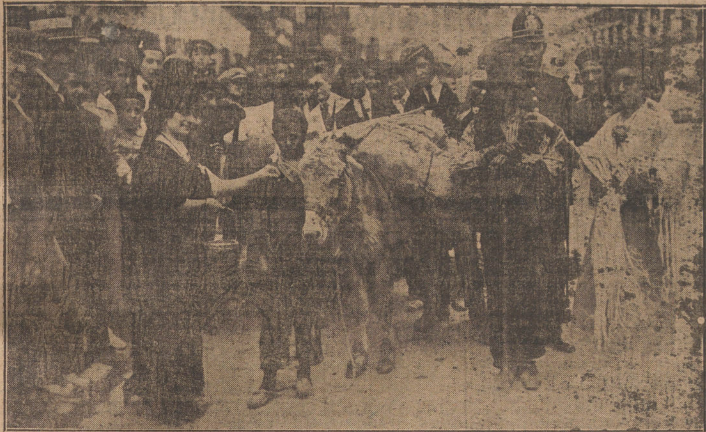
TODOS CONTRIBUYEN A LA FIESTA DE LA FLOR.—Una de las escenas pintorescas, desarrolladas esta mañana en los barrios bajos.

En la serie de prolivos sucesos informativos, ha correspondido el turno a la benéfica Fiesta de la Flor. Como todos los años, la postulación ha sido espléndida, abundante y generosa, realzada por la belleza magnífica de las madrileñas y la fina galantería de los madrileños.