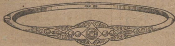
Núm. 3.—Cinco brillantes y diamantes.