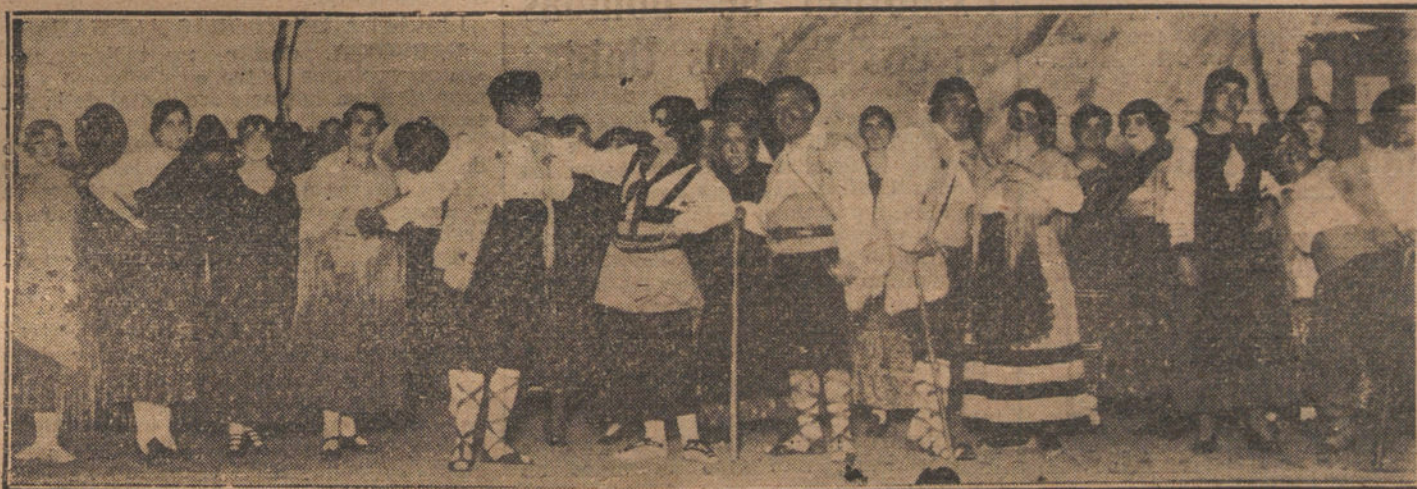
Una escena de la obra «El poder de los humildes», estrenada anoche en el teatro Español.

¿Lo que hizo y lo que ha dejado de hacer se levantará sobre su alma como una terrible acusación?—P.