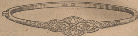
Núm. 2.—Dos brillantes y diamantes.