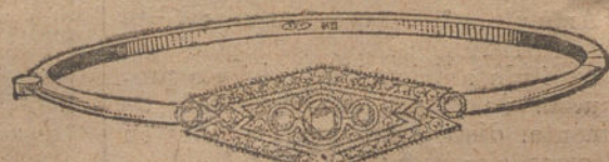
Núm. 4.—Tres brillantes y diamantes.