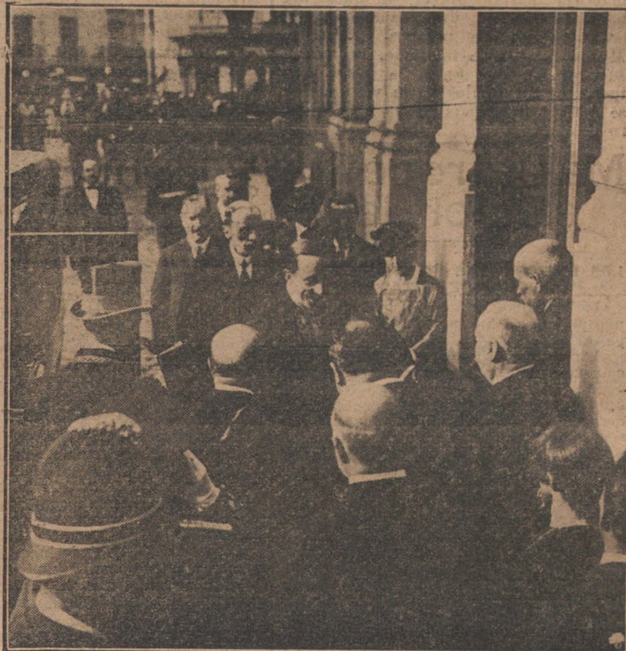
Su Majestad el Rey al llegar ayer tarde al teatro del Centro, para presenciar el reparto de premios de las Mutualidades escolares.