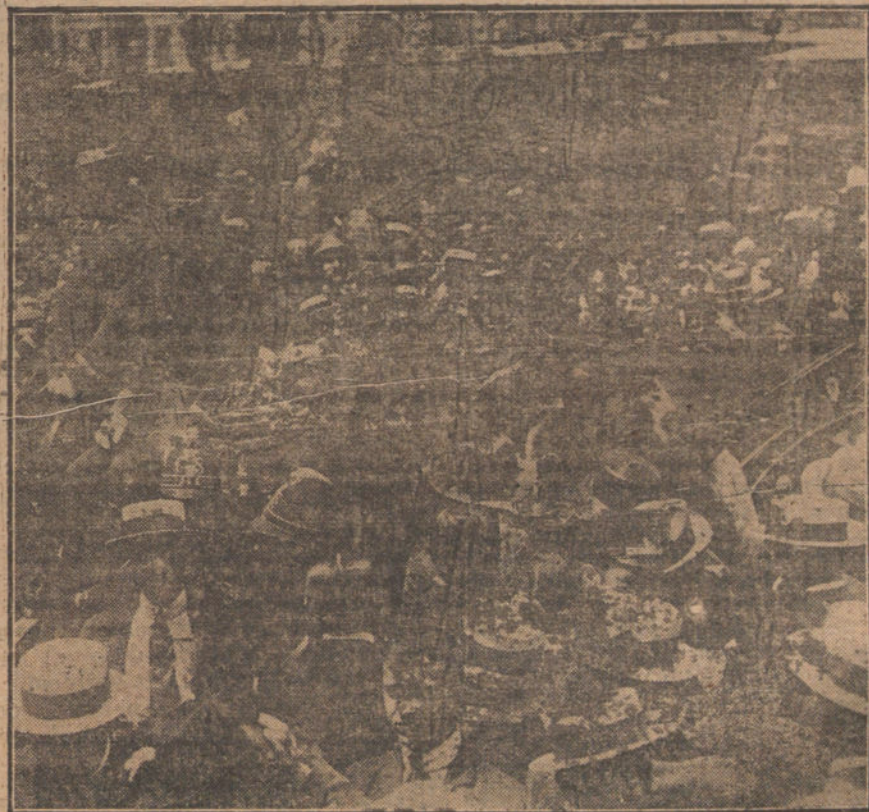
El coche de Su Majestad la Reina Victoria, asaltado por bellas postulantes, al pasar por la calle de Sevilla.

Postulan, entre otras, las distinguidas señoras de Teverga, Sánchez Lozano, Valle de Oradá, Cerdón, Alvear, Sandoval y Méndez de Vigo, todas bellas y exquisitas, y todas afanosas de conseguir una recaudación brillante en beneficio de los pobres enfermos a quienes se dedica la fiesta. Estas admirables mujeres, que vencen su timidez, asaltando a los transeúntes, por procurar el beneficio ajeno, son dignas de toda clase de respetos y alabanzas.