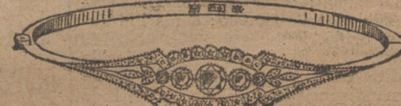
Núm. 6.—Cinco brillantes y diamantes.