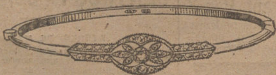
Núm. 1.—Un brillante y diamantes.

MONTURAS DE PLATINO FINO Y ORO DE LEY 18 QUILATES CONTRASTADO