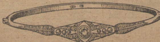
Núm. 5.—Siete brillantes y diamantes.