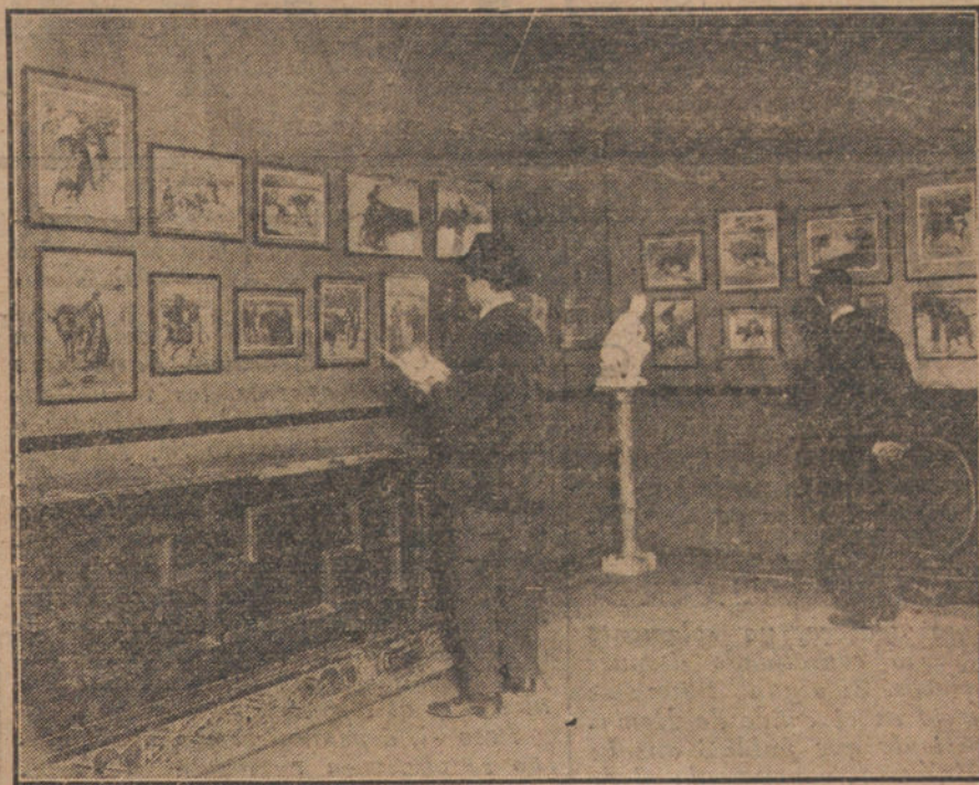
Un detalle de la Exposición de impresiones taurinas, de Ruano Lleó, inaugurada ayer tarde.

Entiendo que deben hacerse programas para poner coto a las excentricidades de algunos vanidosos examinadores; pero esos programas han de ser de asuntos generales, no de preguntas ceñidas cuyas ceñidas respuestas preparen los preparadores de oficio y enseñen los Compendios y Manuales. Han de servir los programas más bien para limitar el terreno, que no para particularizar las cuestiones;