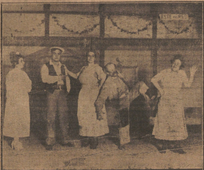
Una escena de la zarzuela «El marquesito», estrenada anoche en el teatro Español.

El jueves próximo, día 12, tendrá lugar en el teatro Alvarez Quintero (San Bernardo, 6r) el anunciado mitin pro Magisterio.