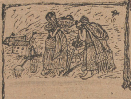
DAR AGUA AL SEDIENTO, por Manuel Gómez Serna (doce años).

Salsa de fondista.—Con una rebanada de pan algo duro o seco y unos veinte gramos de vinagre se hace una mezcla pastosa, a la cual se añade un picadillo de perejil, y así mezclado, se pasa por el tamiz, y la parte que ha pasado se cuece con aceite unos diez minutos, y puede servirse.