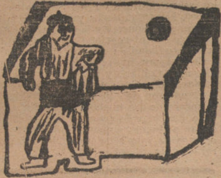
LOS JUGADORES DE MI PUEBLO, por Juan Salas (diez años).

Si realizan los esfuerzos necesarios, podrán llegar a ser oradores bastante apreciados, y crearse un puesto envidiable en la política.—(Continuará.)