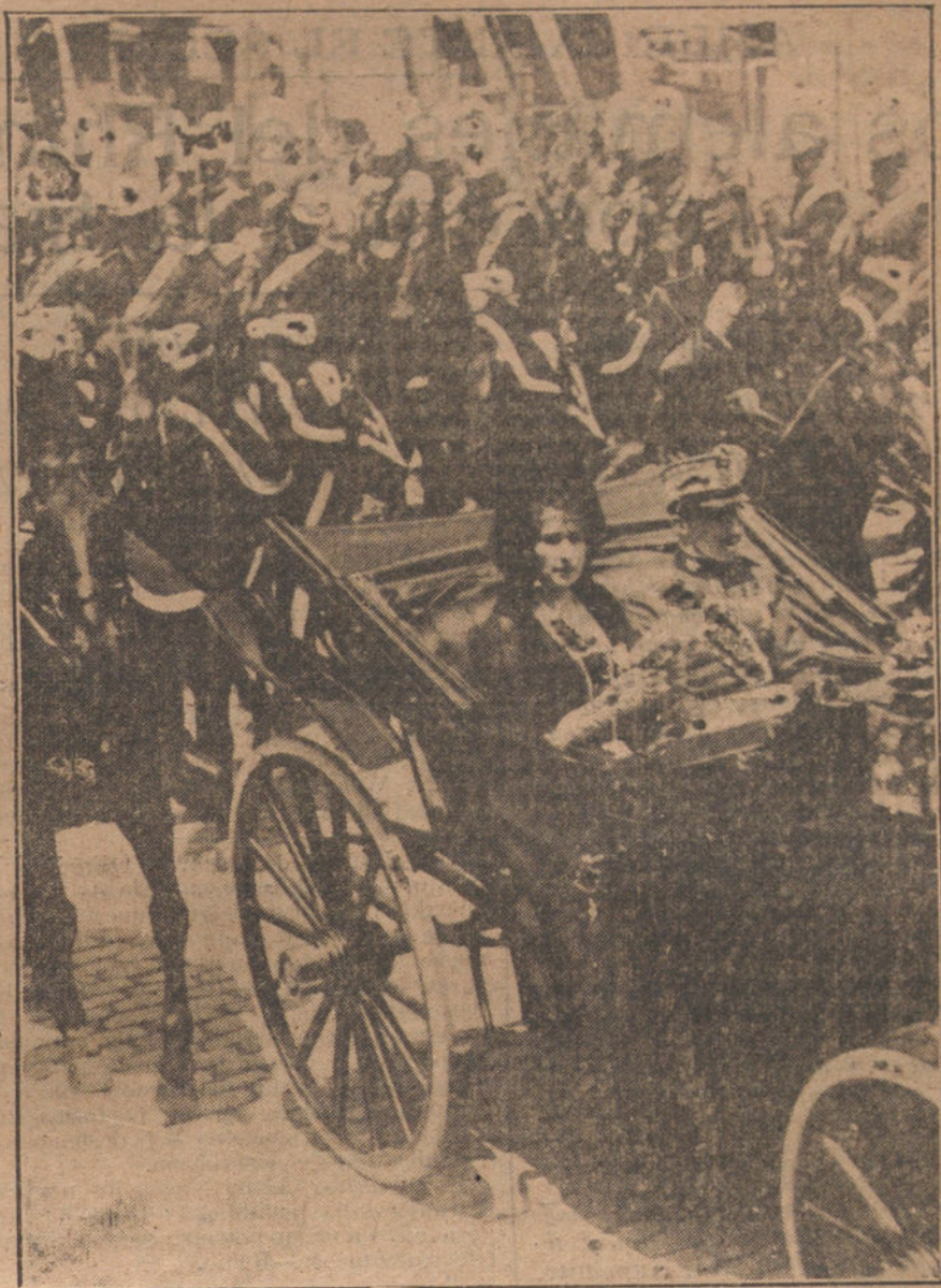
Se exhiben ahora unos papeles de habitación—flores clavadas sobre fondo variado—, que, medio extendidos en los escaparates, parecen telas para casullas.

Los suscriptores á pagar en metálico entregarán, al hacer sus pedidos, el 15 por 100 del importe nominal, recibiendo, en