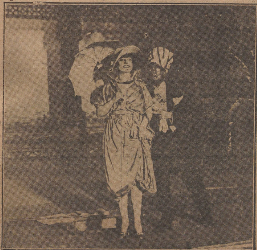
Una escena de «El elefante blanco», opereta estrenada hoy en el teatro del Centro.

Al amanecer del día 20 se organizó la columna para emprender la marcha hacia Alcazarzeguir, tomando entonces el mando de la misma el general de brigada D. Enrique López Sanz, cons-