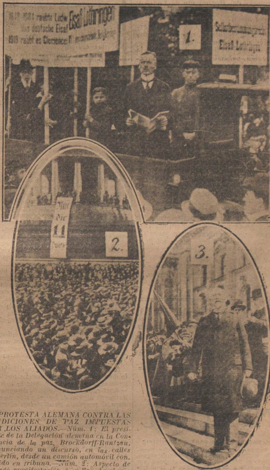
LA PROTESTA ALEMANA CONTRA LAS CONDICIONES DE PAZ IMPUESTAS POR LOS ALIADOS.—Núm. 1: El presidente de la Delegación alemana en la Conferencia de la paz, Brockdorff-Rantzau, pronunciando un discurso, en las calles de Berlín, desde un camión automóvil convertido en tribuna.—Núm. 2: Aspecto de la gran manifestación á su llegada al monumento de las batallas.—Núm. 3: El jefe del Gobierno, Scheiman, arregando á la multitud.

«La existencia misma de su propia dinastía y hasta de la del Islam en España, era la mejor prueba de la facilidad de una nueva conquista de España. Aquel era el punto llano de la costa, y para defenderlo era indispensable, y lo es todavía hoy que España poseyera al otro lado del Estrecho un punto fortificado á manera de cabeza