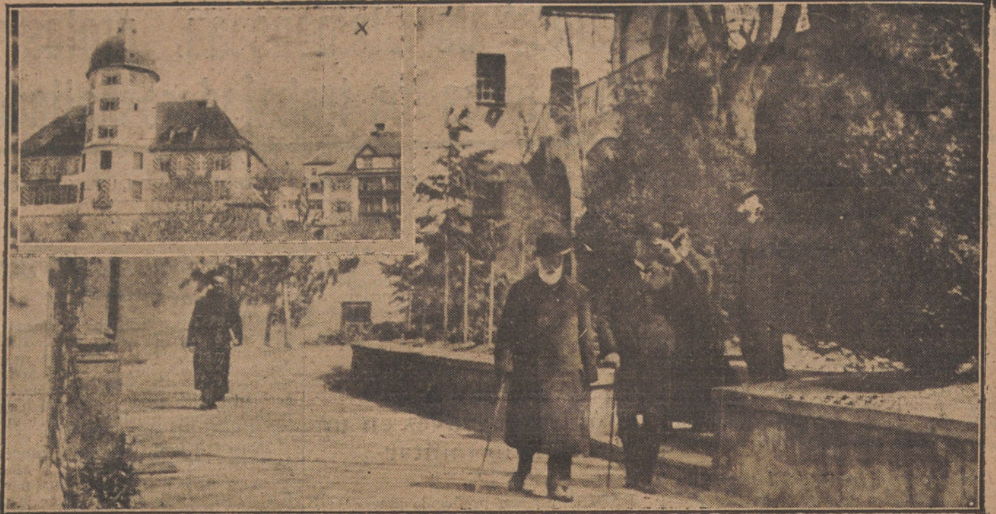
LOS JEFES DE ESTADO EN EL DESTIERRO.—El ex Rey de Baviera, paseando por los jardines del castillo de Salis, en Switzerland (x)

Le Temps dice a este propósito: «Los americanos compran en nuestro país tierras y fábricas. ¿Qué vamos a hacer? Nada. Lo menos, dar una buena acogida a estos asociados de ayer, toda vez que su deber de asociados no ha concluido por completo, puesto que ellos nos ayudan a restablecer nuestras